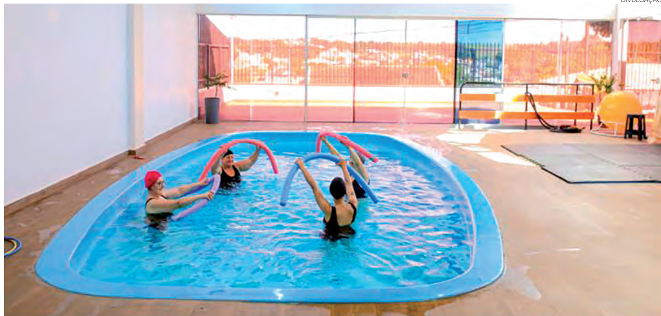
Com a hidroterapia é possível sentir resultados positivos, como alívio de dores e relaxamento muscular, ainda nas primeiras sessões

Entre as principais patologias tratadas pela hidroterapia no tocante ao tratamento de dores crônicas, é possível mencionar os benefícios aos pacientes com doenças reumáticas. Sobre essa ação eficaz da terapia, a fisioterapeuta explica o