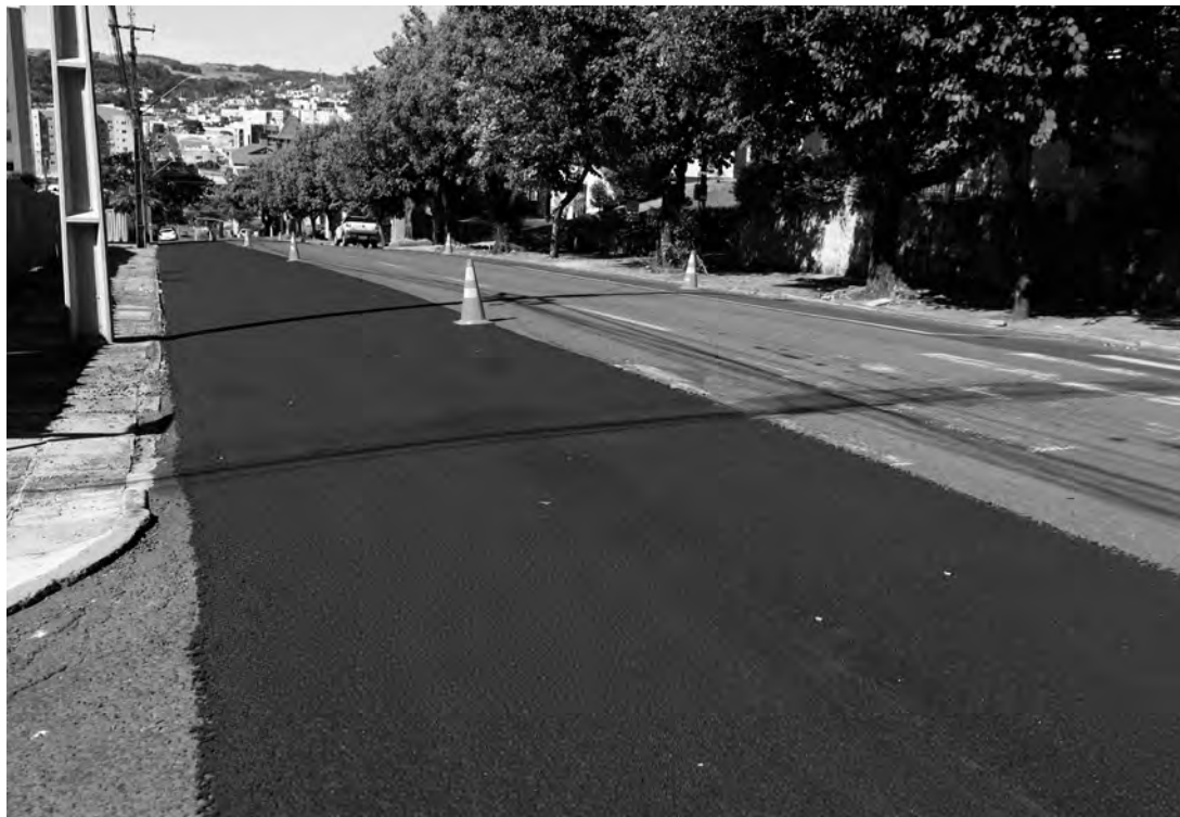
Microrrevestimento asfáltico segundo o Município é mais barato e deve dar maior vida útil ao atual pavimento