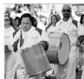
APAE de Cascavel