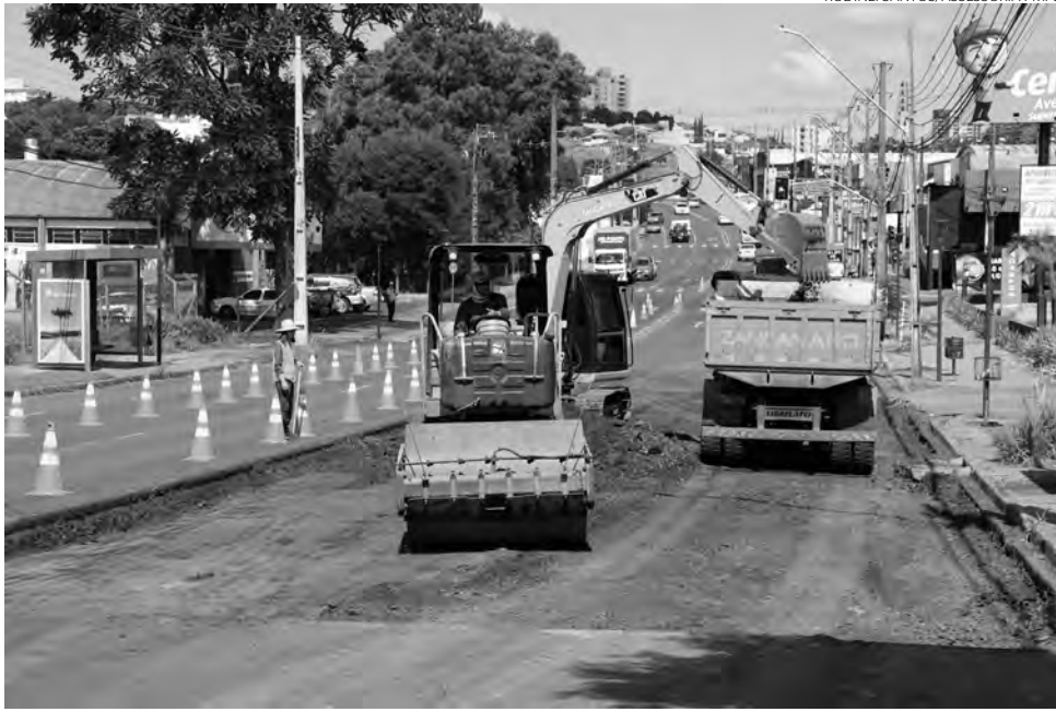
Obras da avenida Tupi estão dentro do cronograma de tempo

Para a realização da reforma da avenida, o Muni-