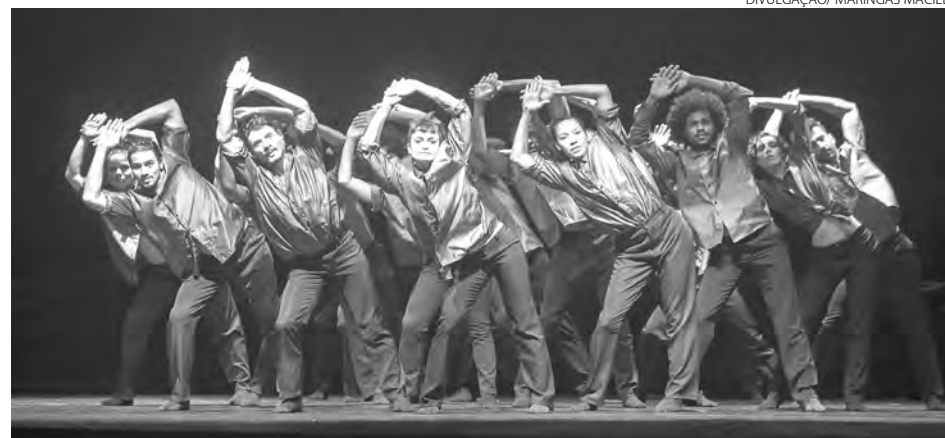
Além de Dois Vizinhos, companhia de balé do Guaíra se apresentará em Toledo