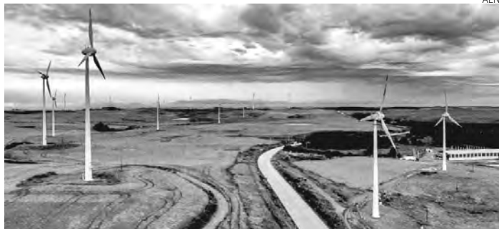
Região está acima de mil metros do nível do mar

Rodovia sedia a primeira usina eólica do sul do Brasil e homenageia o potencial da região