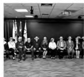
Colégio de Governadores