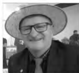
Coordenador da Conferência