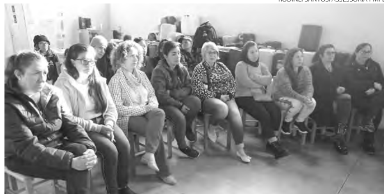
Aproximadamente 60 margaridas atuam na limpeza de Pato Branco