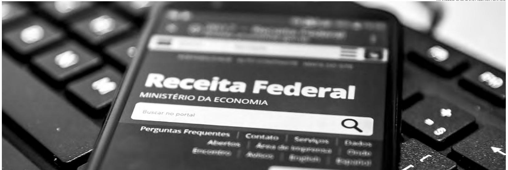
Prazo final para a declaração do Imposto de Renda é em 31 de maio