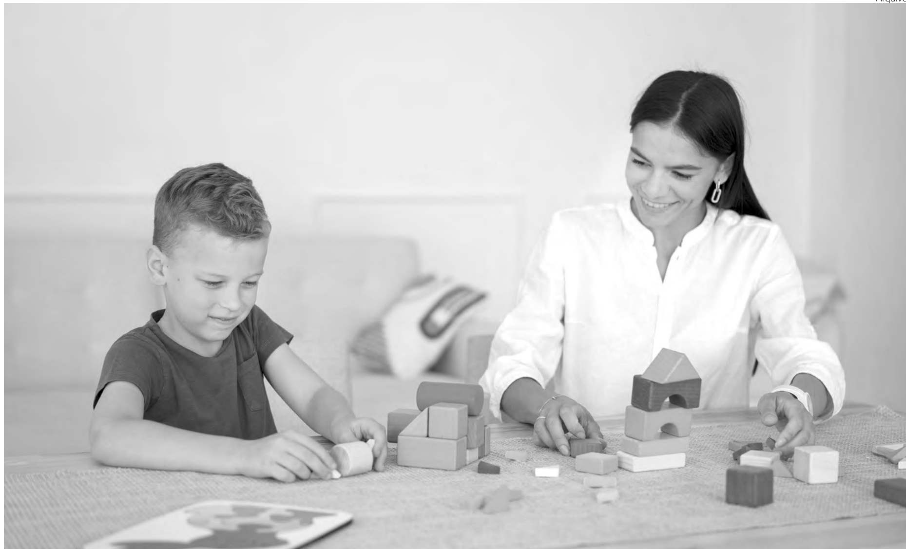
A terapia de integração sensorial tem como objetivo principal, ajudar a desenvolver habilidades dos autistas