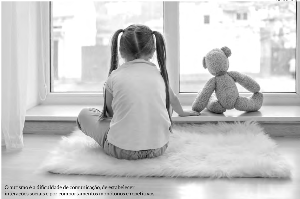
O autismo é a dificuldade de comunicação, de estabelecer interações sociais e por comportamentos monótonos e repetitivos

O que se sabe atualmente é que, entre as possíveis causas do autismo, a herança genética desempenha papel muito importante