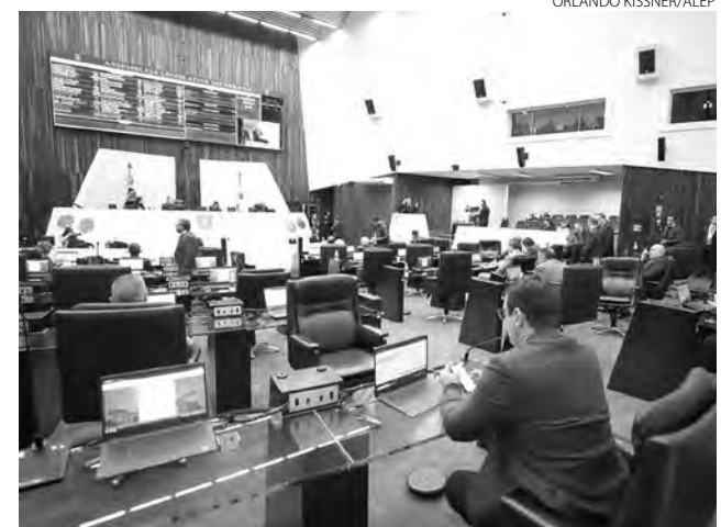
A proposta prevê ampliação de penalidades para crimes de maus-tratos contra animais em todo o estado

nhece a música "Bicho do Paraná", do compositor João Lopes, como Patrimônio Artístico do Paraná, está pausada para ser votada em segundo turno.