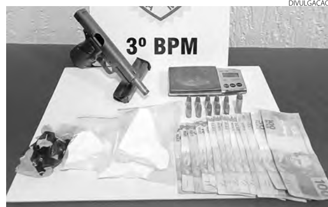
A arma e a droga foram apreendidas no bairro Planalto

Foi dada voz de prisão aos abordados pelos crimes de tráfico de drogas e porte ilegal arma de fogo. Eles foram encaminhados, juntamente com o entorpecente, dinheiro e a arma de fogo, para as providências cabíveis ao fato. (Redação)