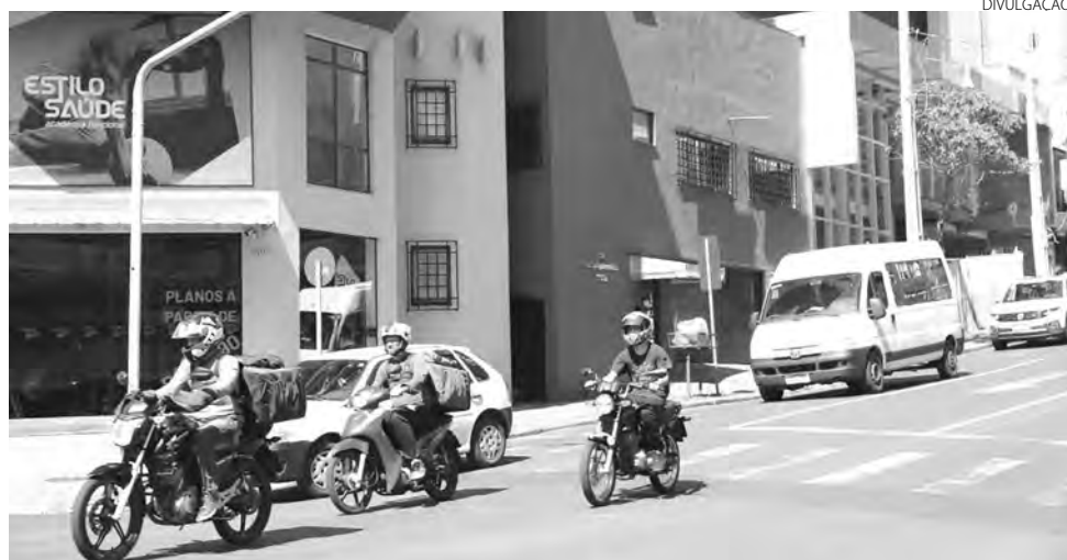
O proposto é que o espaço seja utilizado pelos motociclistas no momento em que o semáforo está fechado

A previsão para início do estudo é para outubro, já que o Depatran está ad-