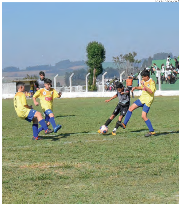
Delegações de 11 municípios participam da competição