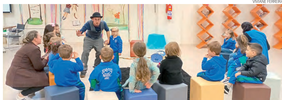
Crianças participam de contação de histórias na Biblioteca Sesc

As oficinas de biblioteca, vídeo-poesia e clube de leitura precisam de matrícula e são gratuitas. Já a visita mediada à exposição, exibição de cinema e a contação de história não necessitam apenas de agendamento prévio. A única atividade que não precisa ser agendada é a visita espontânea à exposição, sem mediação, podendo ser realizada em qualquer dia e