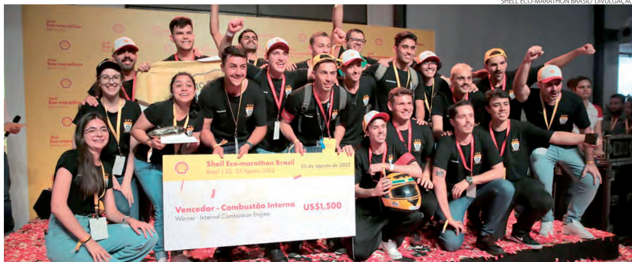
Com conquista deste ano, Pato a Jato mantém hegemonia alcançada em 2017

Da competição que iniciou em 2016, ano que