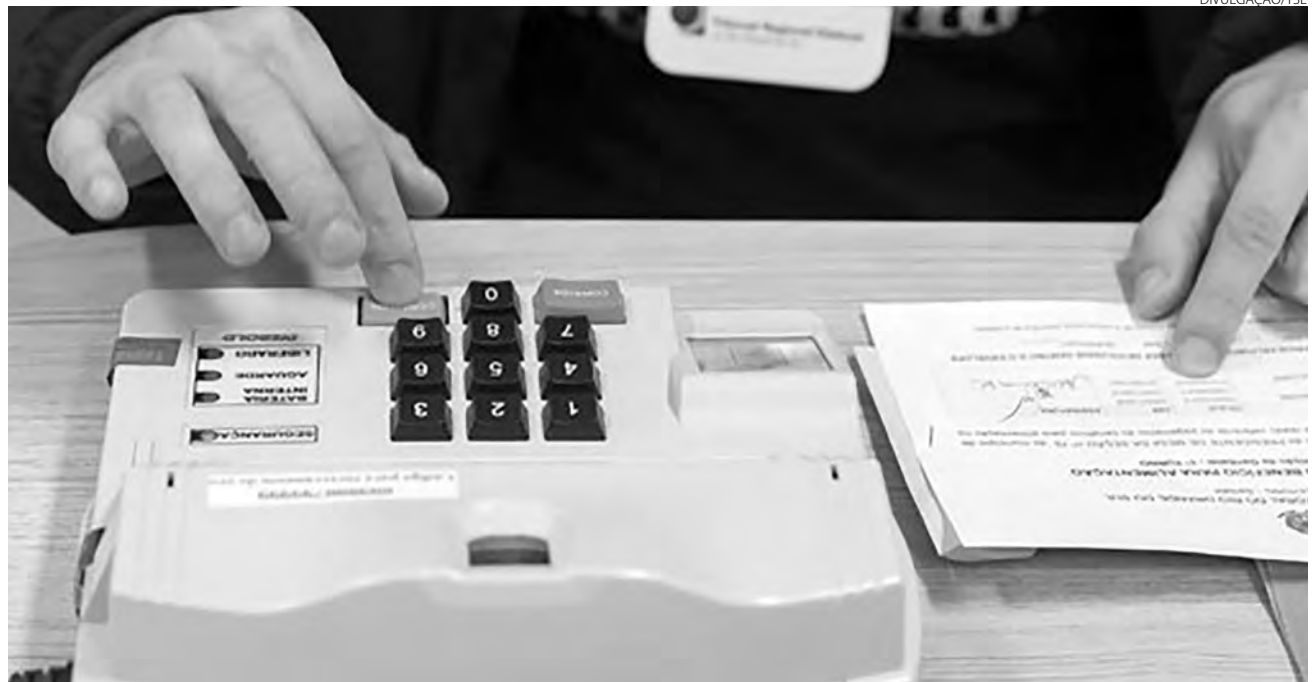
Em Pato Branco, dos 508 mesários convocados para o pleito deste ano, 71,46% são voluntários

escolaridade, entre o gênero feminino, 189 tem curso superior completo, 53 superior incompleto, 73 ensino médio completo, 34 ensino médio incompleto, 6 ensino fundamental incompleto e 4 ensino fundamental completo.