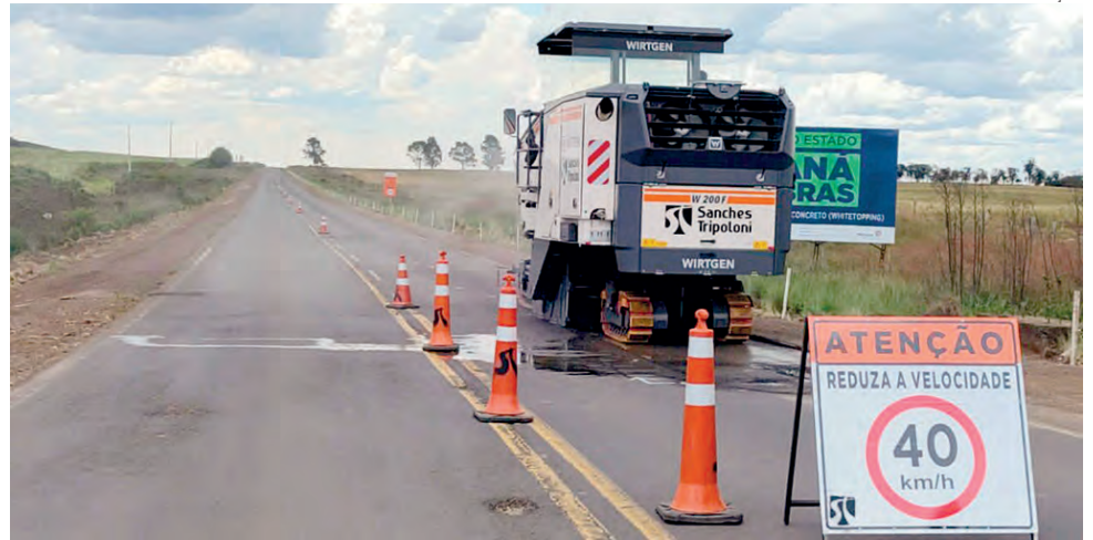
Obras estão sendo realizadas no trecho entre Palmas e o Horizonte