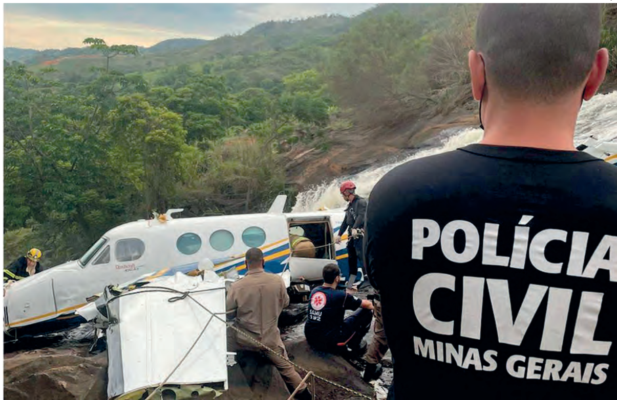
Há 3 anos a cantora cancelou show em Goiás após pane em aeronave

"Com imenso pesar, confirmamos a morte da cantora Marília Mendonça. O avião decolou de Goiânia com destino a Caratinga/MG, onde Marília teria uma apresentação esta noite. De momento, são estas as informações que temos", confirmou também a assessoria.