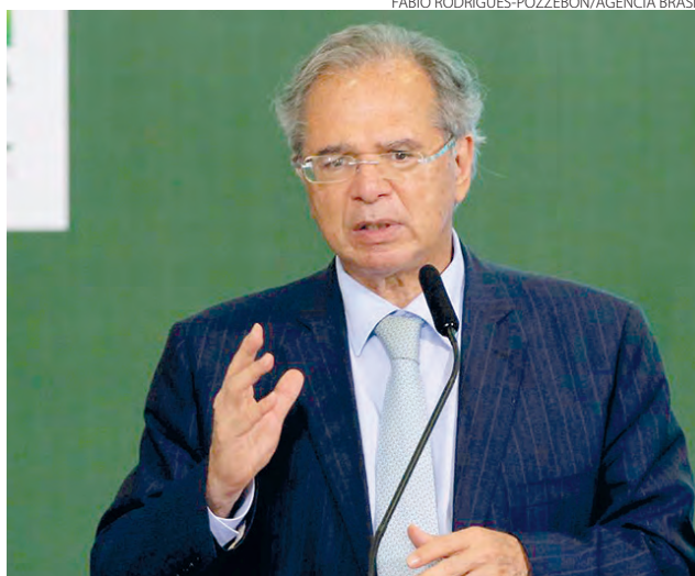
Guedes comentou o corte nas alíquotas durante sua participação na terceira edição da Conferência de Comércio Internacional e Serviços do Mercosul, promovida pelo Conselho de Câmaras de Comércio do bloco econômico.

A medida havia sido acertada com a Argentina