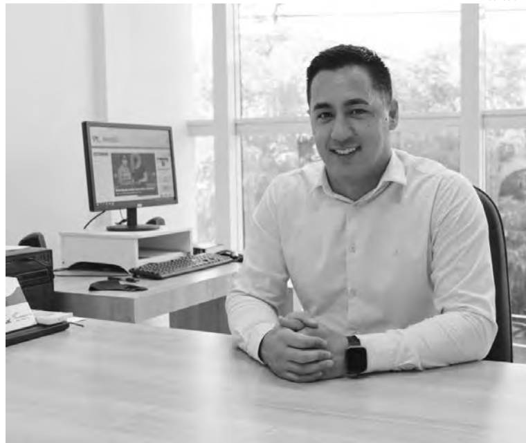
“O primeiro ano de mandato foi desafiador, mas recompensador pela construção que temos sedimentado”, destacou o vereador

nº 5.731, de 2021, de sua autoria, aprovada. A Lei reconhece os prestadores de serviços de atividade física, como essenciais para a saúde da população, atuando na prevenção de patologias físicas e mentais, principalmente durante a pandemia.