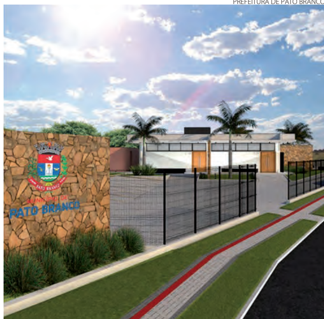
Parte do projeto da capela no cemitério