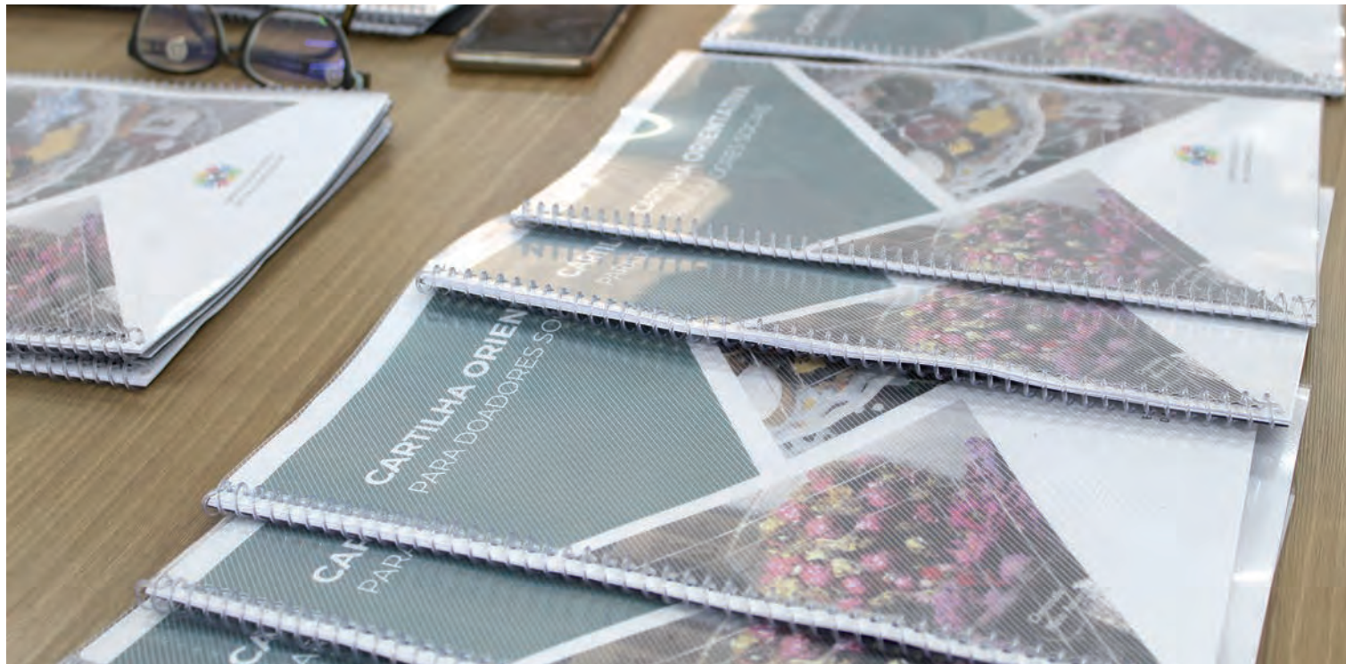
Com a cartilha doadores terão um auxílio sobre como e para quem doar seu dinheiro

Intenção do documento é que a população leve em conta alguns critérios antes de doar, a fim de garantir o uso correto de recursos utilizados em causas sociais