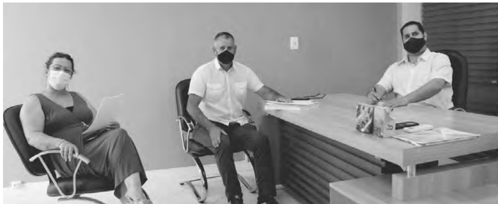
A reunião da Comissão Processante (CP) que decidiu pelo prosseguimento das investigações ocorreu na tarde de sexta-feira (5)