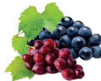
Uva Vitória e Red Glob Bandeja 500g