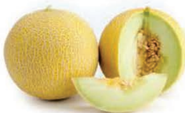
Melão Galia Rendado Kg