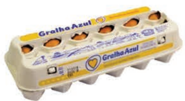
Ovos Vermelho Gralha Azul Dúzia