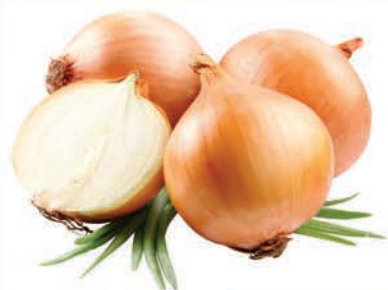
Cebola Nacional Kg