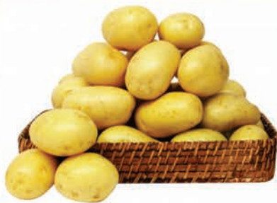
Batata Monalisa Kg