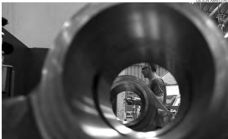
Indústria paranaense avança 13,3% em 2021 e fica entre os três melhores resultados do País

O aumento da indústria no Paraná no acumulado do ano foi puxado pela fabricação de máquinas e equipamentos, que teve evolução de 73,1% nos primeiros nove meses na comparação