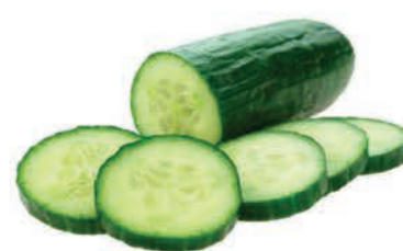
Pepino Salada Kg