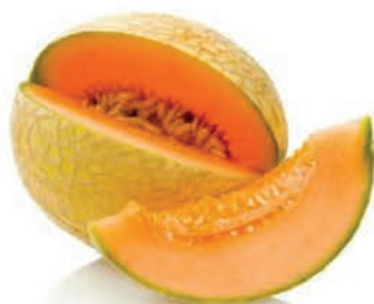
Melão Orange Rendado Cantaloupe Kg