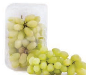
Uva Thompson Bandeja 500g