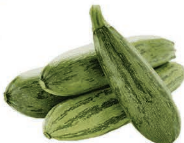
Abobrinha Verde Kg