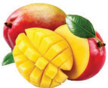
Manga Tommy Kg