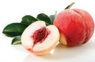
Pêssego Nacional Branco Kg