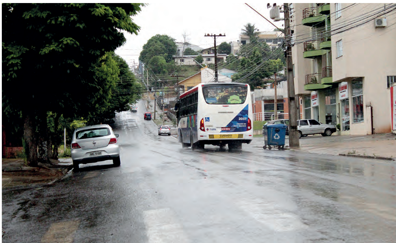
Segundo diretora do Depatran, intenção não é de alterar na velocidade já estabelecida