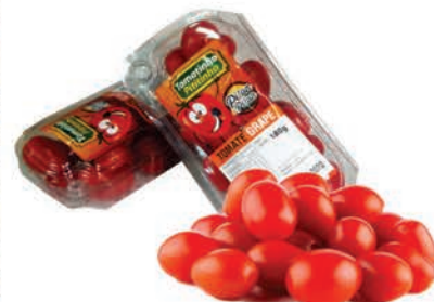
Tomate Cereja Grape Pititinho 180g