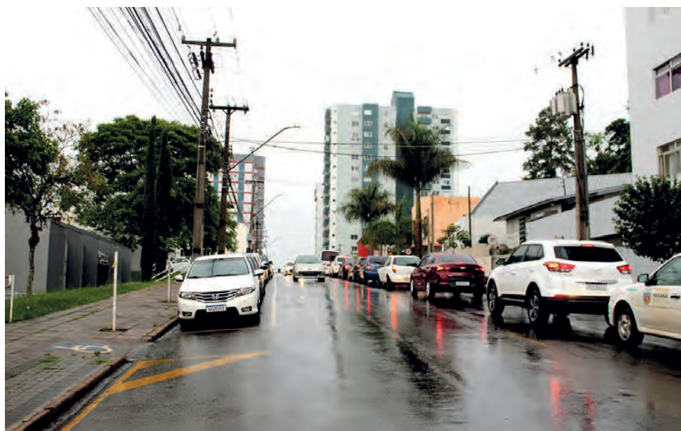
Com base em estatísticas de infrações e acidentes, parte da Tocantins é tida como um ponto crítico

Para a diretora do Depatran, população precisa desmistificar a fiscalização eletrônica, "infelizmente tivemos um fato que não foi um episódio legal para Pato Branco, mas não podemos nos ater a um erro do passado, com medo de crescer."