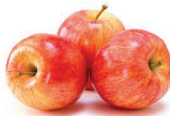
Maçã Fuji Kg