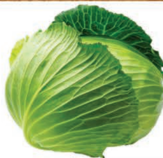
Repolho Verde Kg