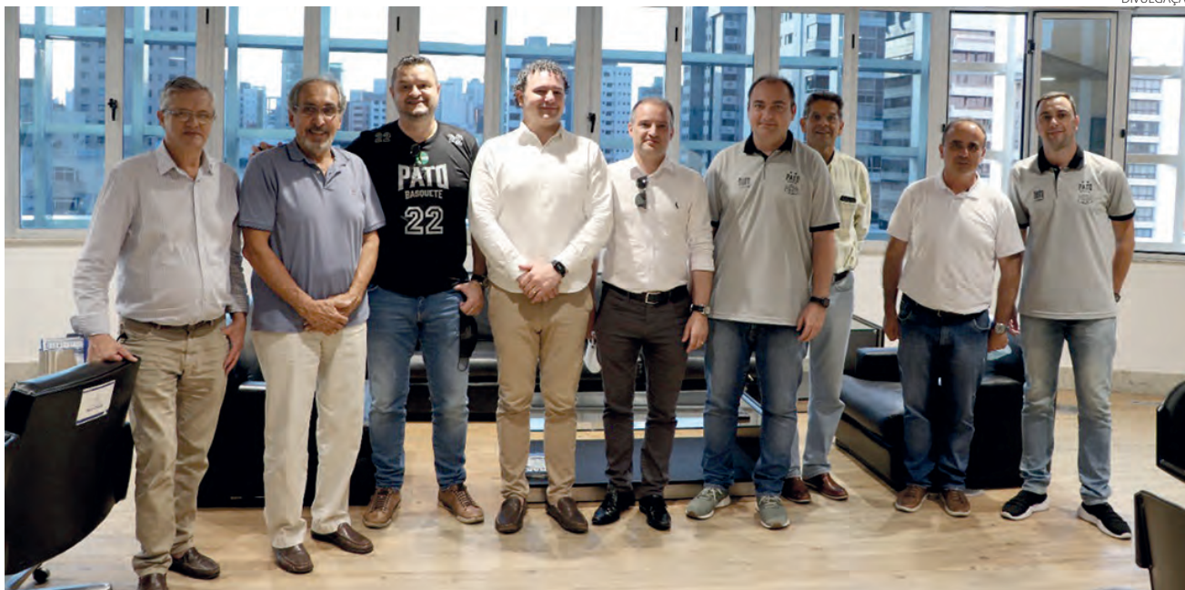
Encontro teve como objetivo conhecer a estrutura e a gestão do Minas