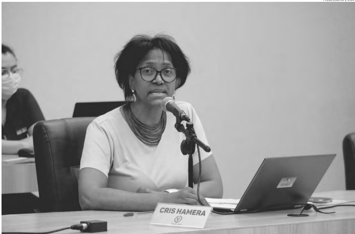
“A cada hora 536 mulheres são agredidas e 177 espancadas no Brasil”, afirmou a vereadora

O benefício de que trata a lei será concedido às mulheres que se enquadrem no mínimo em um dos seguintes critérios: mulher atendida por medida protetiva prevista na Lei Federal nº 11.340, de 7 de agosto de 2006 - Lei Maria da Penha; mulher que for obrigada pelas circunstâncias a abandonar o lar em razão de reiteradas ações de violência, que tornaram insuportável a vida em comum e que esteja colocando em risco a vida da mulher e dos seus filhos menores ou dependentes; mulher em situação de violência doméstica e familiar que com-