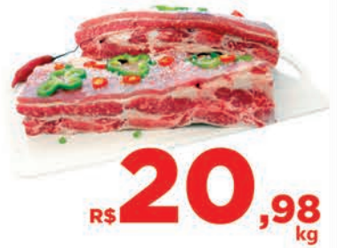
R$ 20,98 kg Carne Bovina Costela Grossa Kg