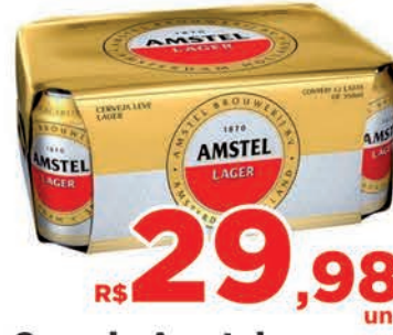
R$ 29,98 un. Cerveja Amstel 12x350ml