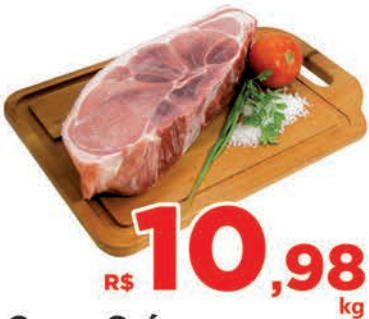
R$ 10,98 kg Carne Suína Paleta c/pele Kg