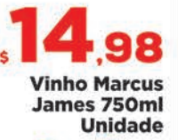
R$ 14,98 Unidade Vinho Marcus James 750ml Unidade