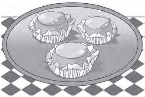
ILUSTRAÇÃO: LUZIMAR LAINES

O quindim é um doce muito POPULAR no Brasil. Foi trazido pelos portugueses, porém sua RECEITA original era preparada com OVOS , açúcar e AMÊNDOAS . Mas como na época da colonização este último INGREDIENTE não existia em nosso país, ele foi substituído pelo coco. Veja, abaixo, uma receita dessa iguaria: