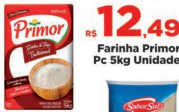
R$ 12,49 Farinha Primor Pc 5kg Unidade