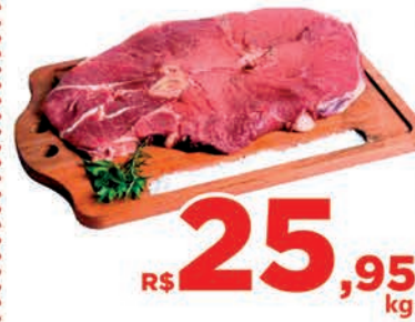
R$ 25,95 kg Carne Bovina Churrascão Americano c/osso Kg