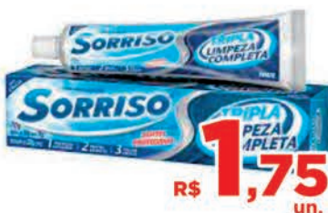
R$ 1,75 un. Creme Dental Sorriso Limpeza Completa 70g