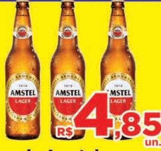
R$ 4,85 un. Cerveja Amstel Garrafa 600ml c/casco