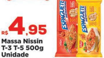
R$ 4,95 Massa Nissin T-3 T-5 500g Unidade