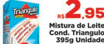
R$ 2,95 Mistura de Leite Cond. Triangulo 395g Unidade