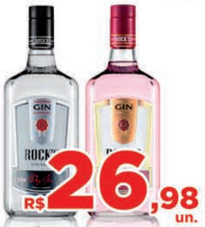
R$ 26,98 un. Gin Rock's 995ml