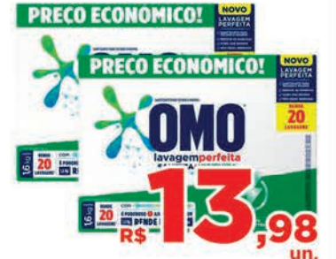
R$ 13,98 un. Sabão em Pó Omo Sanizante 1.6kg

Fone: (46) 3225-4911 - Pato Branco | Horário de atendimento: Segunda a sábado: 8h às 20h | Domingo das 8h às 12h