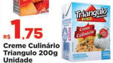
R$ 1,75 Creme Culinário Triangulo 200g Unidade