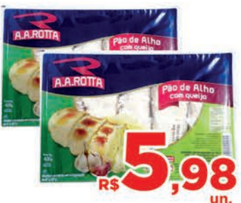
R$ 5,98 un. Pão de Alho A.A. Rotta 400g