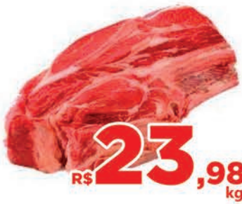
R$ 23,98 kg Carne Bovina Filé Agulha c/osso Kg