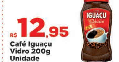
R$ 12,95 Café Iguacu Vidro 200g Unidade