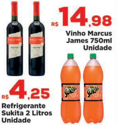
R$ 4,25 Unidade Refrigerante Sukita 2 Litros Unidade