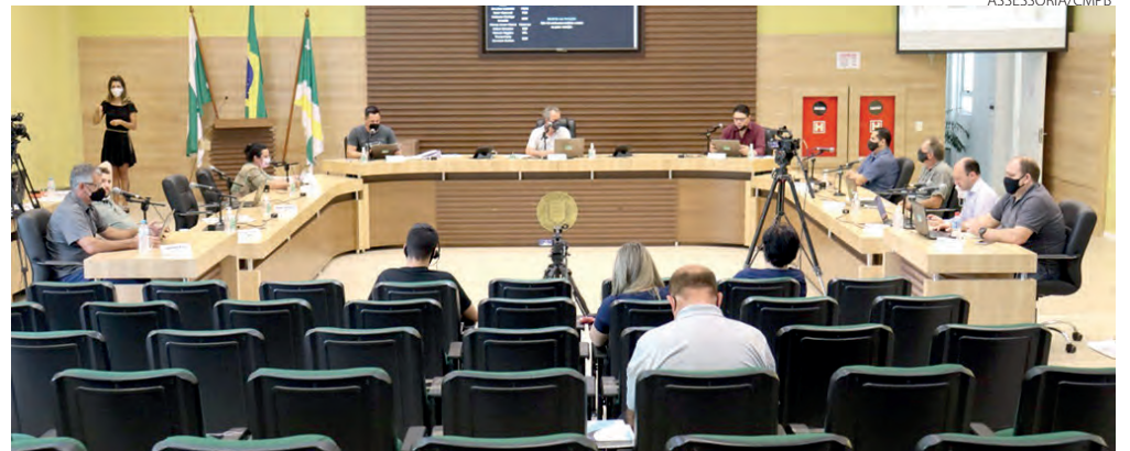
Os vereadores presentes aprovaram por unanimidade o pedido de regime de urgência dos projetos