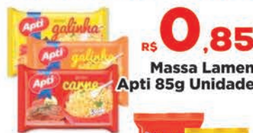
R$ 0,85 Massa Lamen APTI 85g Unidade