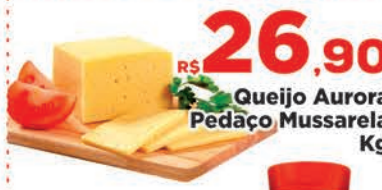
R$ 26,90 Queijo Aurora Pedaco Mussarela Kg