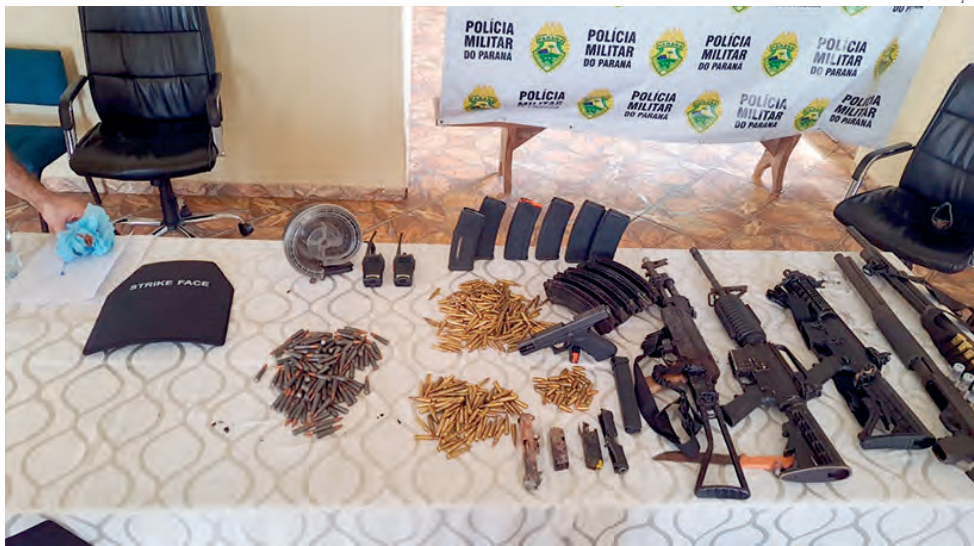
Os bandidos estavam com um arsenal de armas e munições

Durante patrulhamento quarta-feira à noite pelo bairro São José Operário, em Coronel Vivida, a Polícia Militar percebeu quando algumas pessoas abandonaram uma caixa de som e um caixote de madeira e fugiram. Os policiais abordaram uma mulher, que estava nas imediações. Ela relatou que quatro masculinos abandonaram os objetos e fugiram ao perceberem a viatura. Os policiais descobriram que a caixa de som e o caixote de madeira foram furtados na Academia Municipal. Os ladrões não foram localizados e os objetos recuperados entregues na Delegacia da Polícia Civil para as devidas providências.