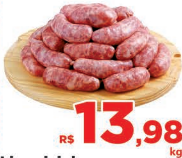
R$ 13,98 kg Linguicinha Toscana Seara Kg