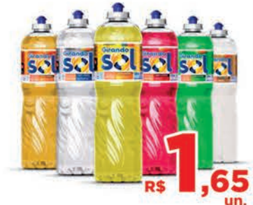
R$ 1,65 un. Detergente Girando Sol 500ml