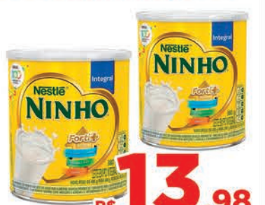
R$ 13,98 un. Leite em Pó Ninho Integral 380g