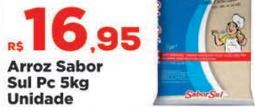
R$ 16,95 Arroz Sabor Sul Pc 5kg Unidade