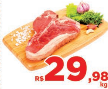
R$ 29,98 kg Carne Bovina Filé Duplo Kg