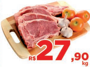
R$ 27,90 kg Carne Bovina Filé Simples c/osso Kg