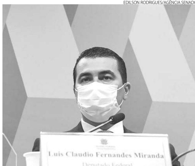
A decisão do Conselho de Ética da Câmara foi tomada nessa quarta-feira (3)