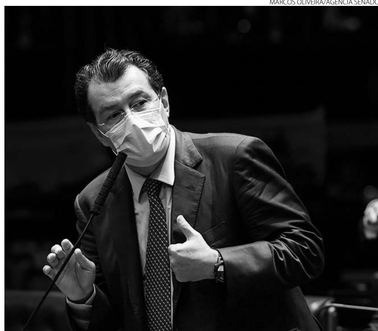
A proposta é do Senador Eduardo Braga (PMDB-AM)

O projeto 3717/2021 irá alterar a Lei nº 13.667, de 17 de maio de 2018 (Lei do Sistema Nacional de Emprego - Sine), para dar maior atenção às demandas da