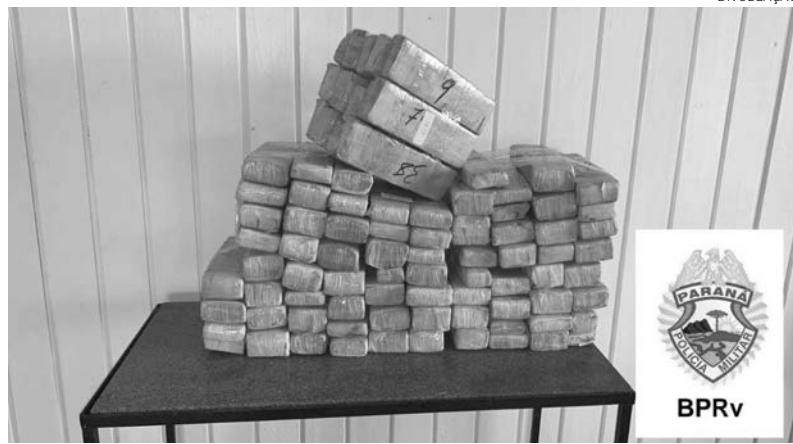
A maconha era transportada num veículo proveniente do Paraguai

Ladrões arrombaram, na última terça-feira, uma residência, em Barracão. O proprietário comunicou a Polícia Militar que foi arrombada a janela dos fundos da sua casa e os ladrões levaram cerca de R$ 2.000,00, que estava num armário. Ele contou que a residência não foi muito revirada e que não havia ninguém no momento do furto. A Polícia Militar esteve no local e realizou buscas, mas os ladrões não foram localizados.