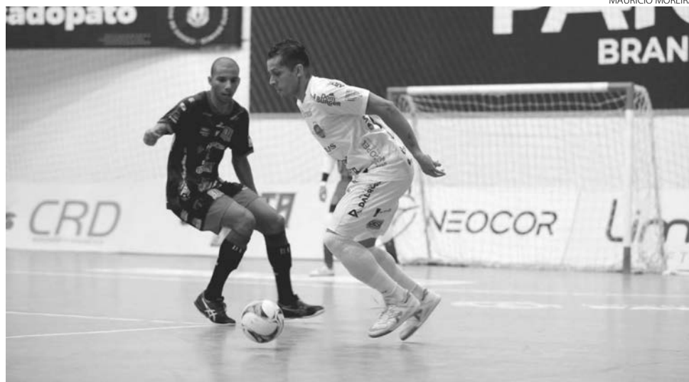
Novamente pela Liga Paraná, o Pato entra em quadra no sábado em Guarapuava