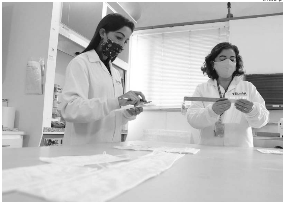
O Tecpar orienta gestores e servidores públicos sobre como definir critérios mínimos de qualidade para a aquisição de produtos

O Tecpar já orientou diversos órgãos públicos e