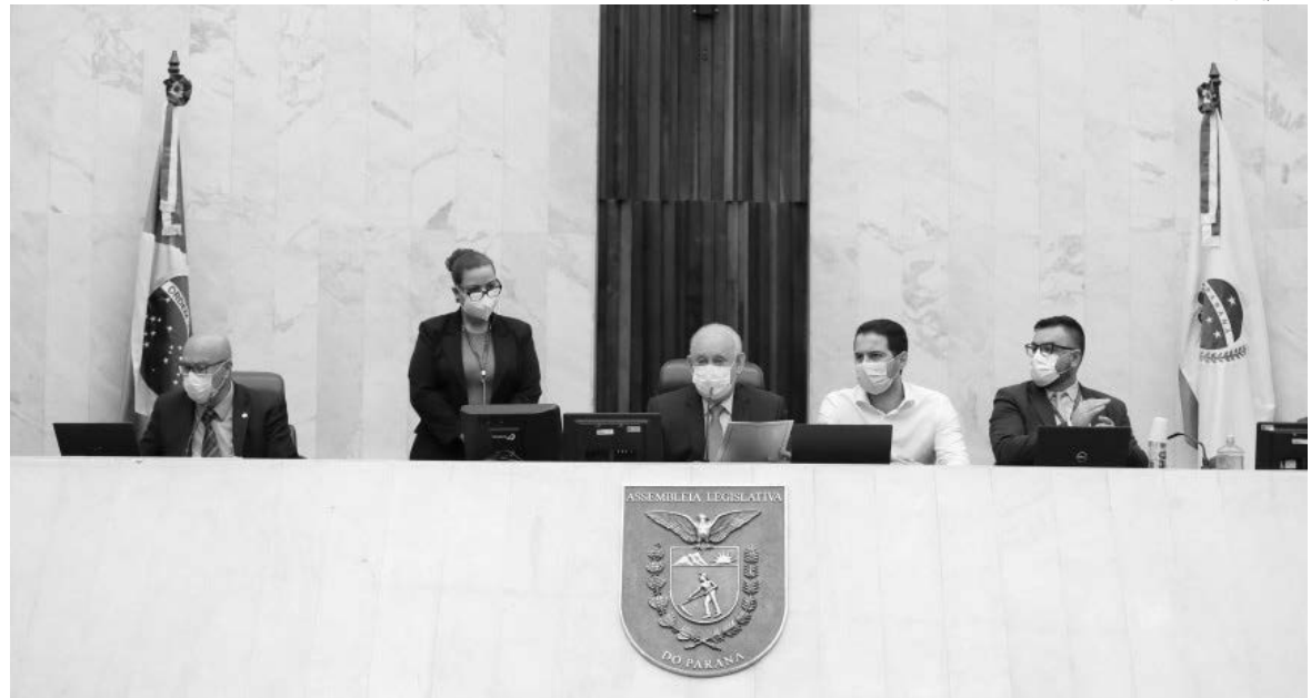
Novos deputados assumem mandato na Assembleia Legislativa do Paraná na segunda-feira (8)