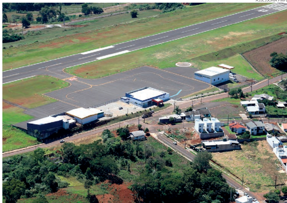
Publicação da nova denominação do aeroporto ocorreu na semana passada

Como o Diário do Sudoeste divulgou na semana