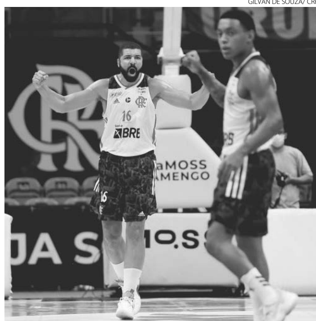
Com 100% de aproveitamento, Flamengo venceu o Pato Basquete nesta quarta-feira (3)

No segundo período, Pato conseguiu encostar no placar com a defesa fazendo uma pressão muito forte na equipe adversária, que