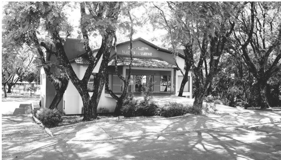
A iniciativa busca selecionar propostas de eventos, que possam ser apoiados pelo Departamento Municipal de Cultura

A abertura do processo justifica-se pela continuidade do cenário de crise sanitária causada pela pandemia da covid-19, que teve grande impacto no setor cultural.