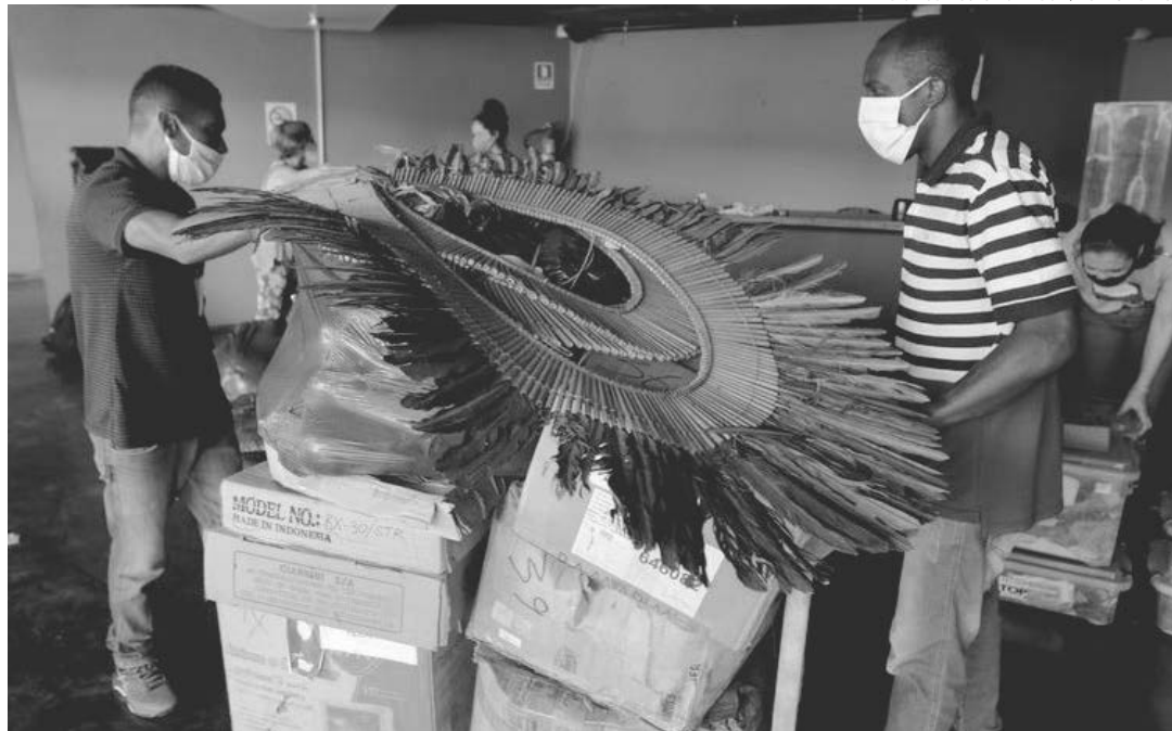
PF faz entrega de objetos indígenas apreendidos durante a Operação Pindorama