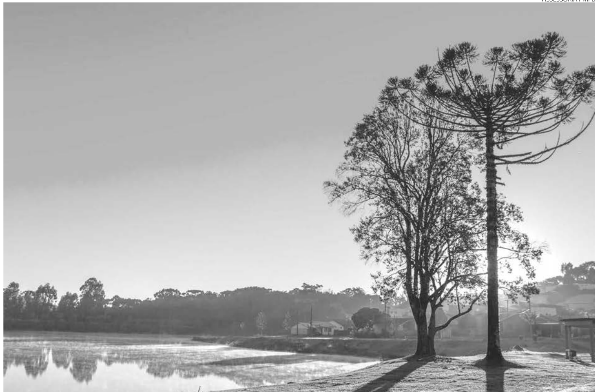
Documento que traçou 11 metas para o biênio foi elaborado na Conferência do Meio Ambiente

Ainda de acordo com a secretária, “O estabelecimento de metas é imprescindível para nortear a atuação da Se-