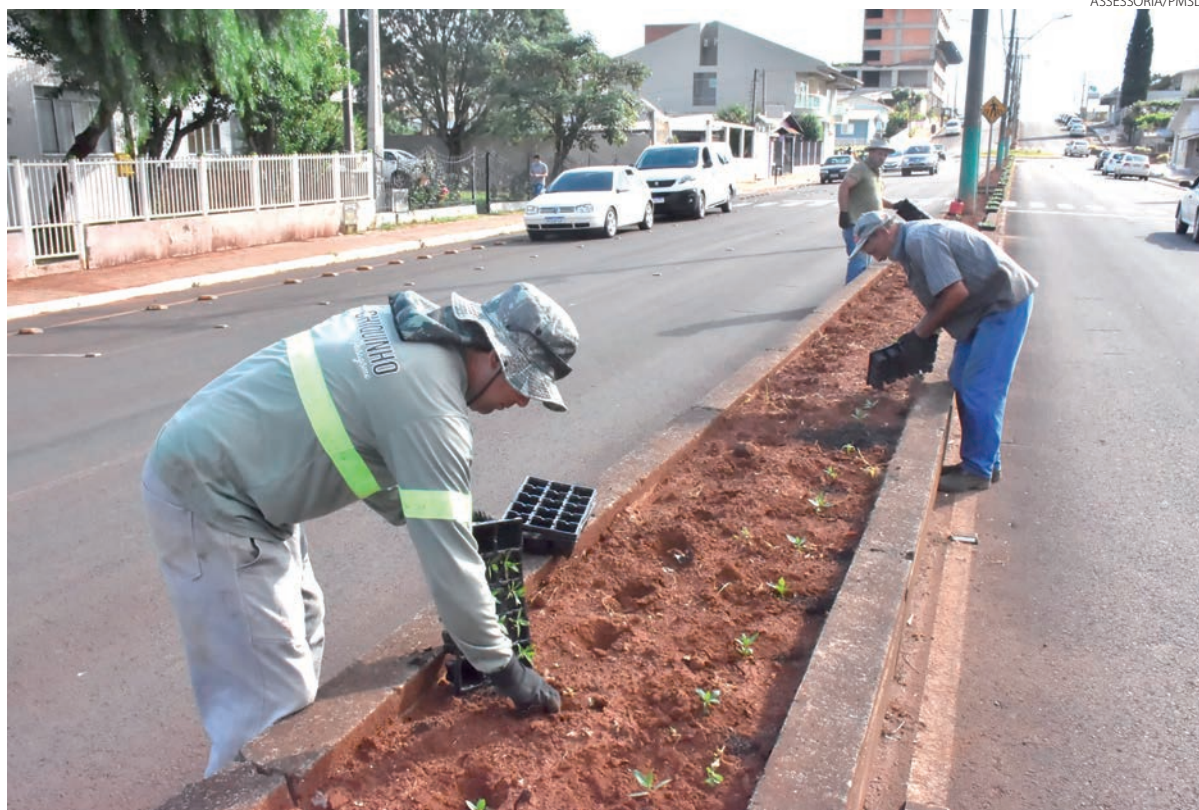
Cidade Jardim ganhando novas cores, em São Lourenço do Oeste (SC). Equipe trabalhando no plantio das chamadas flores de verão.