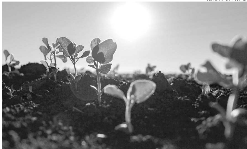
JONATHAN CAMPOS / AEN

O boletim traz, ainda, informações do Departamento de Agricultura dos Estados Unidos (USDA) sobre as estimativas para a produção mundial de soja no ciclo 2021/22. De acordo com o órgão norte-americano, serão produzidas aproximadamente 384 milhões de toneladas do grão, com o Brasil liderando o ranking mundial, responsável por aproximadamente 144 milhões de toneladas, seguido dos Estados Unidos (aproximada-