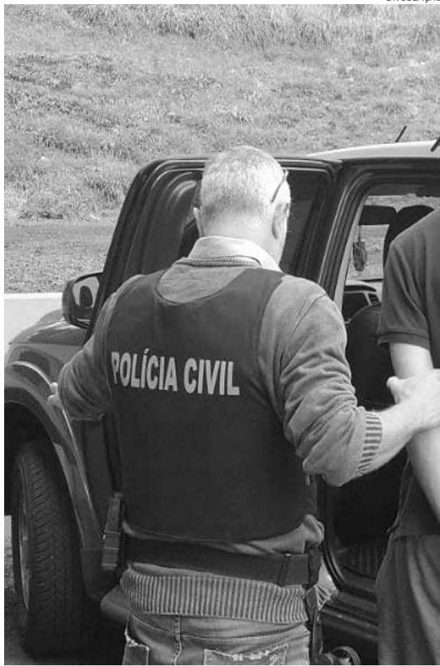
Os crimes teriam ocorrido no interior da residência do acusado, em Pato Branco

Durante a vistoria foi localizado por um cão farejador, dentro de um travesseiro, 7,500kg de maconha. A proprietária disse ter pegado a droga em Foz do Iguaçu e receberia a quantia de R$ 500,00 pelo transporte até São Leopoldo (RS). Ela foi presa e encaminhada, juntamente com o entorpecente, ao órgão competente para as providências cabíveis.