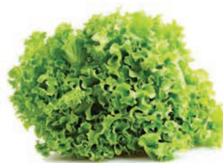
Alface Lotti Unidade.