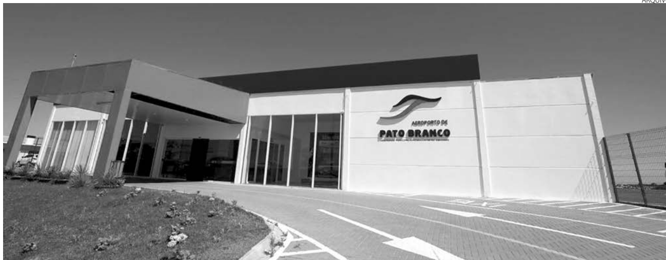
O aeroporto possui características técnicas e operacionais para a denominação Regional