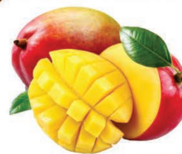
Manga Tommy Kg