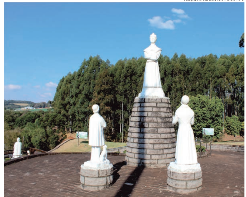
A romaria ocorrerá com programação diferenciada devido à pandemia