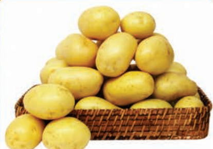
Batata Monalisa Especial Kg