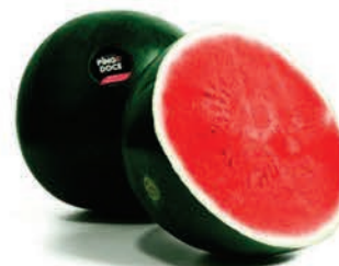
Melancia Pingo Doce Inteira Kg