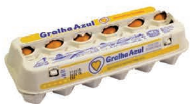
Ovos Vermelho Galha Azul Dúzia