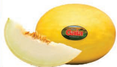
Melão Amarelo Gaia Kg