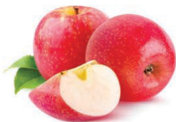
Maça Cripps Pink Kg