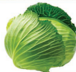
Repolho Verde Kg