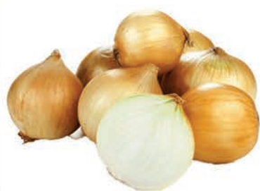
Cebola Nacional Kg