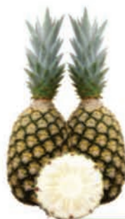
Abacaxi Pérola Extra Unidade