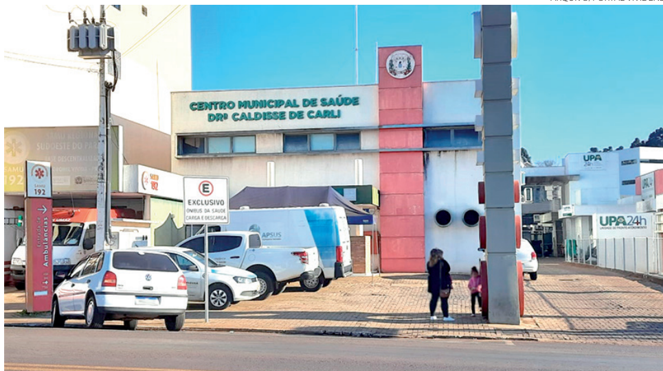
Em Coronel Vivida, os exames serão feitos na Unidade de Saúde Central

Os horários de atendimento, prestados na praça atrás da prefeitura, serão nas segundas-feiras, das 13h às 17h; terças, quartas