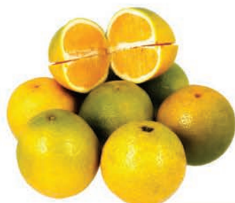
Laranja Pera Cutrale Kg