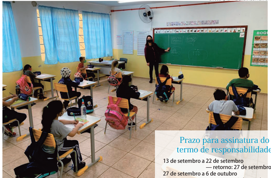
Para que alunos voltem a suas atividades em sala de aula, pais devem assinar um termo de compromisso

Para utilização do transporte escolar público, ao entrar no veículo, os alunos do interior, que utilizam o sistema, deverão estar acompanhados por um responsável, pois, se a temperatura estiver superior a 37º o estudante não poderá entrar e deverá voltar para casa.