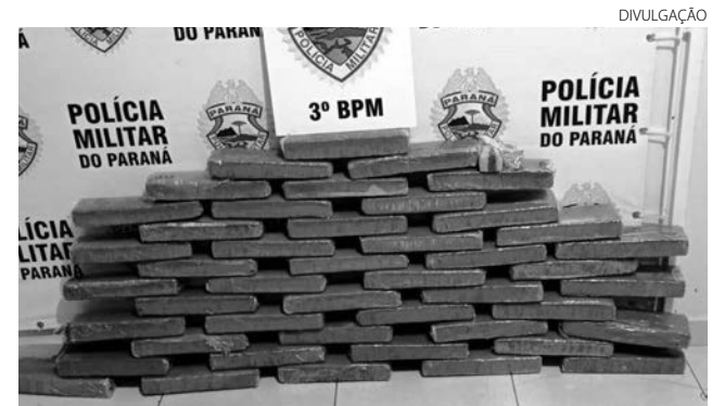
A maconha estava sendo transportada para Palhoça (SC)

O rapaz foi preso em flagrante. Ele e as drogas foram entregues na Delegacia da Polícia Civil para as devidas providências. (AB)