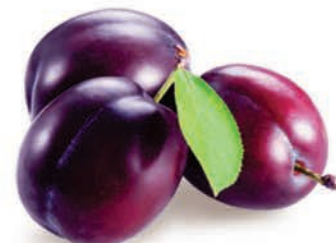
Ameixa Importada Kg