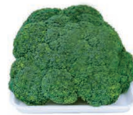
Brocolis da Ilha Bandeja