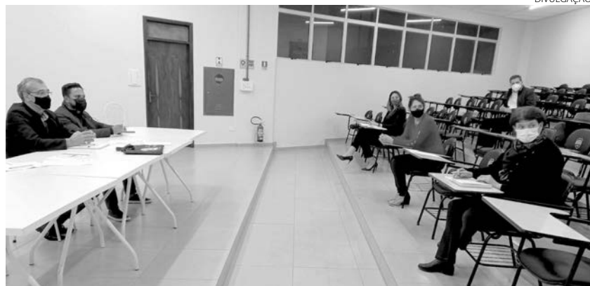
O debate será sobre a adoção de lombadas eletrônicas

As mais expressivas entidades de Pato Branco estarão reunidas no dia 30 de setembro, às 18h30, no Auditório Cidadão (Antigo Fórum), para um amplo debate sobre “Trânsito Urbano Seguro”.