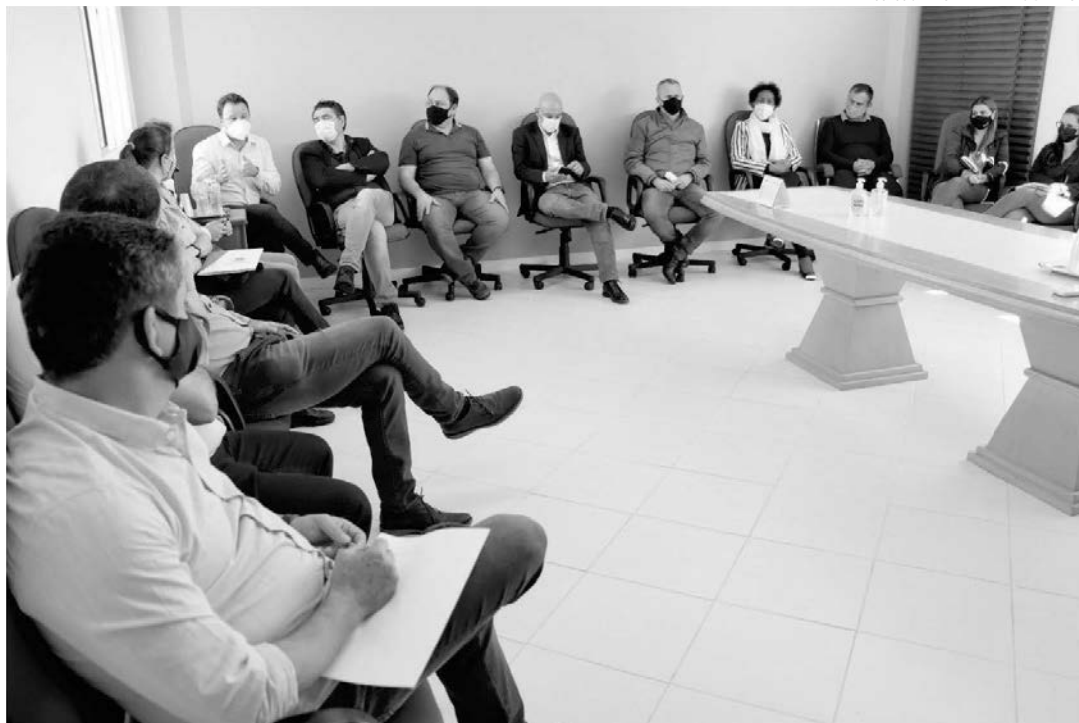
Nos próximos dias, o Executivo deve encaminhar ao Legislativo proposta referente ao transporte coletivo