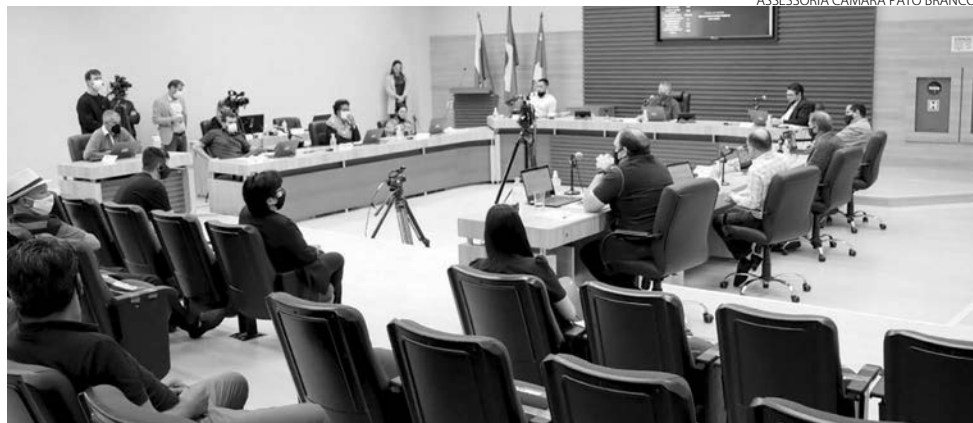
Rejeição dos vetos foi aprovada na segunda-feira

De acordo com o parecer da CJR, "após análise criteriosa da justificativa de Veto de cada Ação, foi obser-