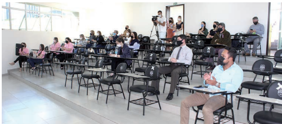
Assinatura do termo de parceria ocorreu na Delegacia da Mulher de Pato Branco