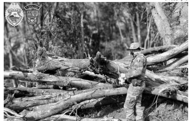
A operação teve por objetivo salvaguardar nascentes e proteger áreas de preservação permanente

Os proprietários de terra flagrados tiveram a sua área embargada, não podendo mais plantar naquela localidade devendo recuperar a integralidade da área desmatada. Eles irão ainda responder por crime ambiental e devem realizar o pagamento da multa.