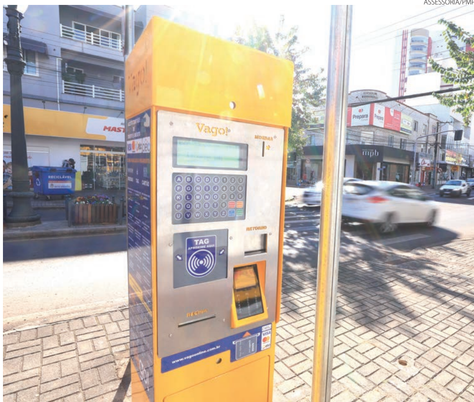
Parquímetros serão usados em caráter de teste

Ainda segundo Francieli, além de gerenciar a utilização das vagas o equipamento também permite o paga-