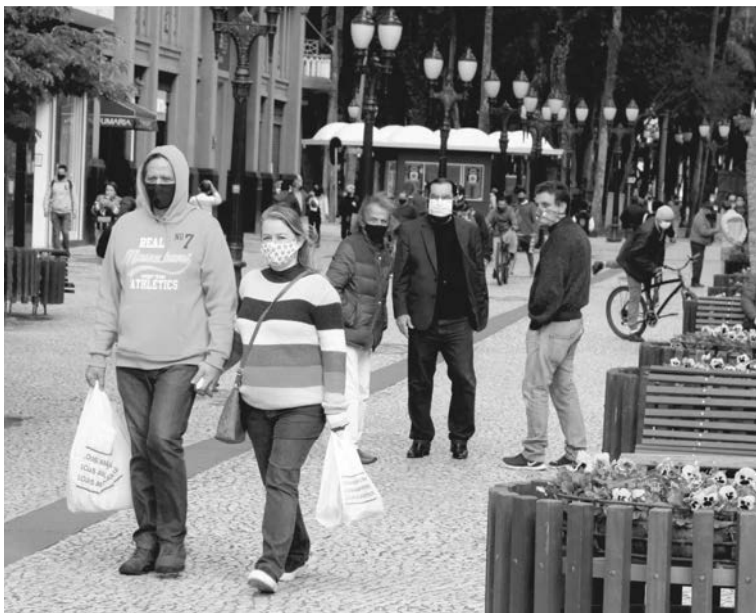
As regras são definidas com base em indicadores da covid-19 e refletem o cenário pandêmico do momento

Em locais fechados, por sua vez, a taxa de ocupação é de 40% para até 500 pessoas, sem ne-