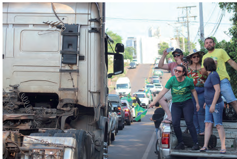
Boa parte dos manifestantes desrespeitaram as leis de trânsito e as medidas sanitárias de enfrentamento a pandemia