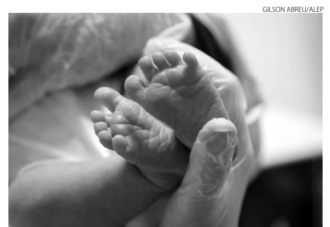
A triagem neonatal agora deve detectar uma série muito mais completa de patologias

“A triagem ampliada vai possibilitar o rastreamento de mais de 100 doenças e contribuirá para diminuir significativamente a descoberta tardia, visando oportunizar à criança o tratamento adequado o mais breve possível”, completa a justificati-