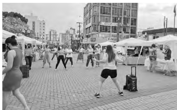
Caps realizou uma atividade física em meio aos artesãos que estavam expondo seus trabalhos na praça

Na manhã de sábado (4), profissionais do Centro de Atenção Psicossocial (Caps) de Pato Branco organizaram uma intervenção para chamar a atenção da população para o significado da campanha 'Setembro Amarelo'. A ação ocorreu na praça Presidente Vargas. Equipes do Município distribuíram panfletos, conversaram