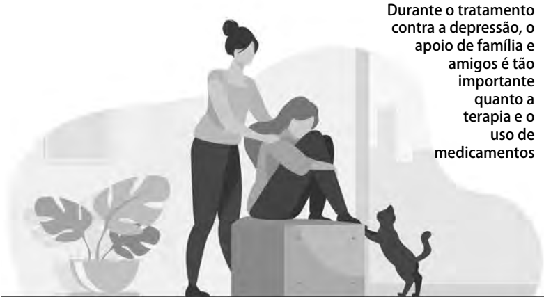
Durante o tratamento contra a depressão, o apoio de família e amigos é tão importante quanto a terapia e o uso de medicamentos

sunto é suicídio. Pessoas que comentam sobre o assunto são exatamente as com maiores chances de se matar. Além disso, os que tentam, tendem a tentar de novo, pois, como aponta Francieli, “o melhor indicativo de um futuro suicídio é uma tentativa.”