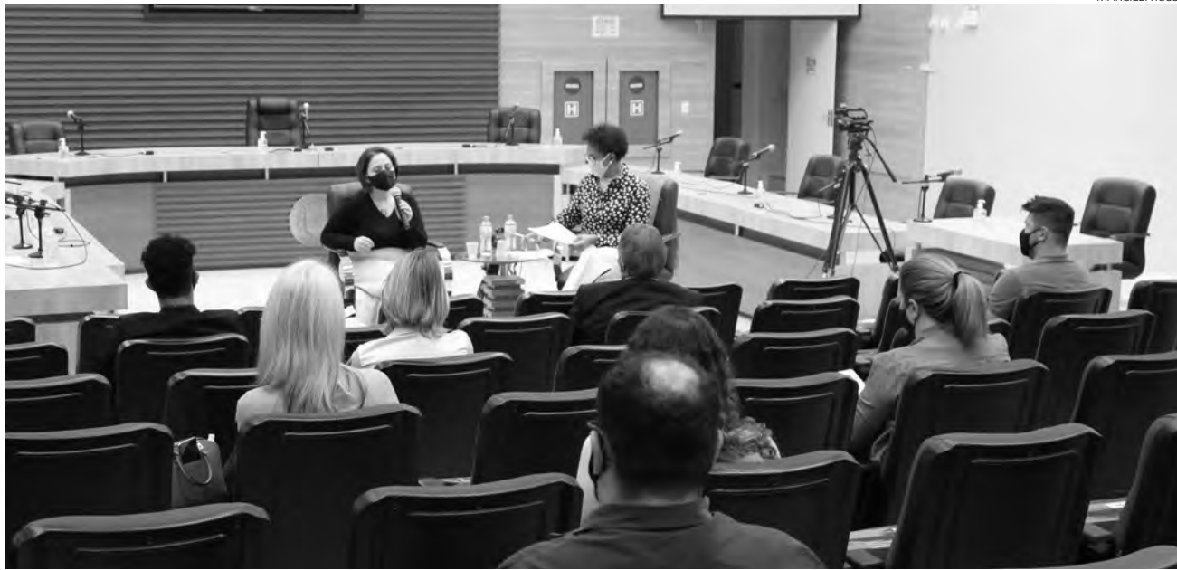
A reunião na Câmara foi realizada na última quinta-feira (2)

O objetivo, segundo os parlamentares, era discutir e obter melhor compreensão sobre o projeto que trata do Programa Família Acolhedora e debater com a comunidade algumas