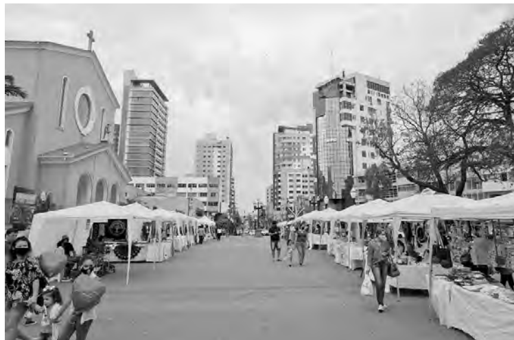
Feira do Artesão ocorre na praça Presidente Vargas nos dois primeiros sábados de cada mês

Para maiores dúvidas, população pode procurar o departamento na rua Araribóia, nº 749, bairro La Salle. Os horários de atendimento ao público são das 8h às 11h30 e das 13h30 às 17h30.