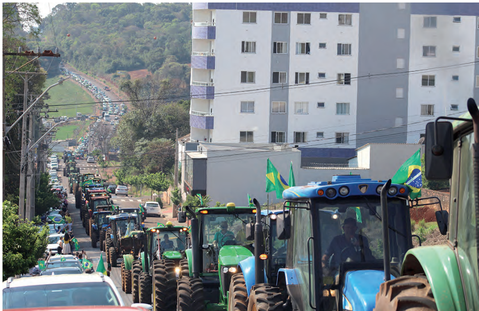
Maioria dos participantes da carreata percorreram o trajeto em camionetes, caminhões, tratores, motos e outros veículos com modelos mais atuais

De acordo com o médico anestesista, que liderou o movimento no município, os manifestantes são contrários a alguns membros do Supremo Tribunal Federal (STF) e pediram pela volta do voto impresso — extinto no Brasil desde 1996, quando as urnas eletrônicas passaram a ser utilizadas em todo território brasileiro, e que, recentemente, teve a proposta de retorno, repro-