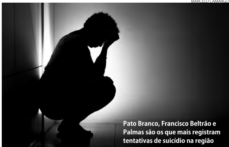
Pato Branco, Francisco Beltrão e Palmas são os que mais registram tentativas de suicídio na região