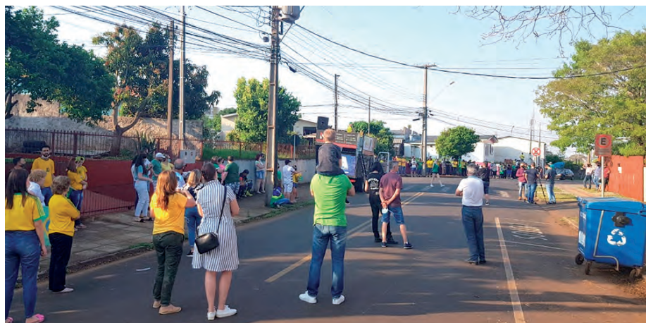
Ato pró-Bolsonaro em frente ao 3º BPM em Pato Branco