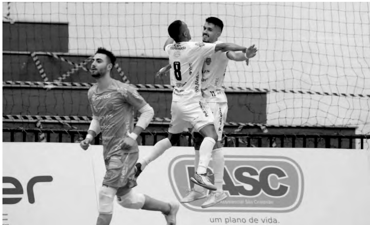
O Pato Futsal entra nos playoffs após golear o Ampére, por 4 a 1

A Federação Paranaense de Futsal confirmou as datas e horários dos jogos da 2ª fase da Série Ouro do Campeonato Paranaense de 2021. O Pato Futsal vai enfrentar o Palmas, sendo que o jogo de ida ocorre na próxima sexta-feira (10), às 20h15, no Ginásio de Esportes Monsenhor Engelberto, em Palmas. Já o confronto da vol-