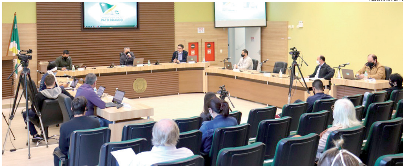
O Requerimento foi apresentado na sessão de quarta-feira (11), na Câmara de Pato Branco

O Projeto de Lei nº 116/2021, protocolado na Câmara Municipal de Pato Branco ainda em julho, estabelece que após criado o Cadastro de Lista de Espera de interessados pelas sobras das vacinas de Covid-19, as chamadas ‘xepas’, a forma de realização desse cadastro será regulamentada