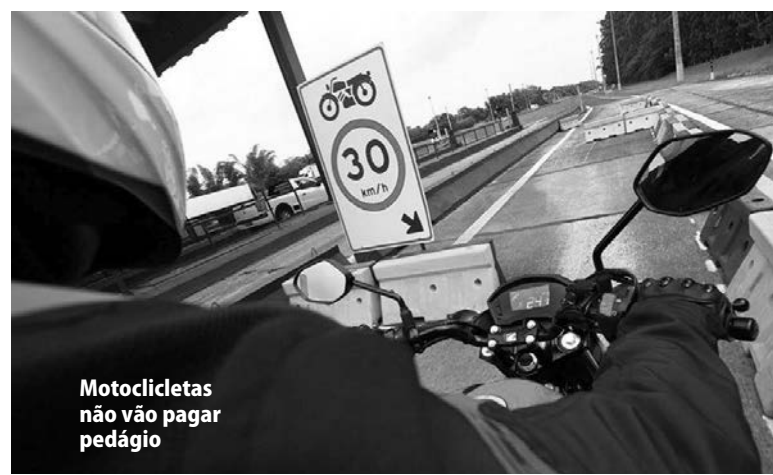
Motocicletas não vão pagar pedágio

Com a nova diretriz, a Agência Nacional de Transportes Terrestres (ANTT) também deverá adotar as providências pertinentes, em especial quanto aos ajustes nos Estudos de Viabilidade Técnica, Econômica e Ambiental (EVTEA) dos projetos atingidos.