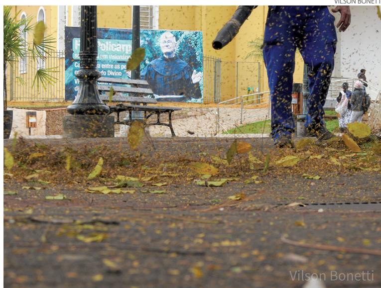
Equipe da Prefeitura de Pato Branco realizando a limpeza na praça Presidente Vargas, no centro de Pato Branco, na manhã de quinta-feira (12)