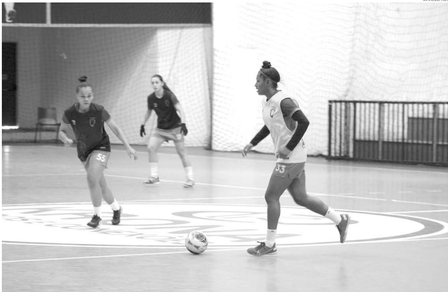
As Patinhas vão enfrentar na estreia a equipe da Apec/PVA (MT)