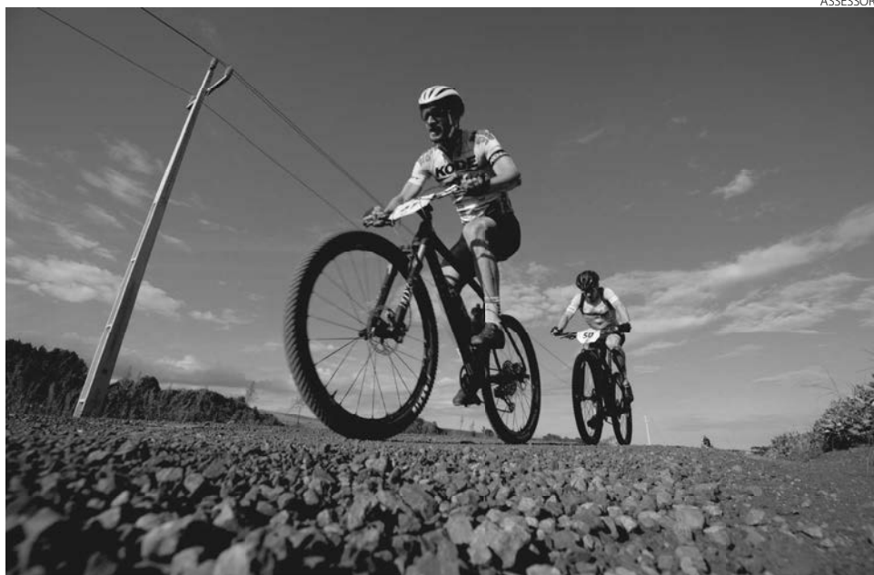
Circuito estadual pretende fomentar a prática do ciclismo

Por parte do Governo do Estado, nestes locais serão instalados totens de