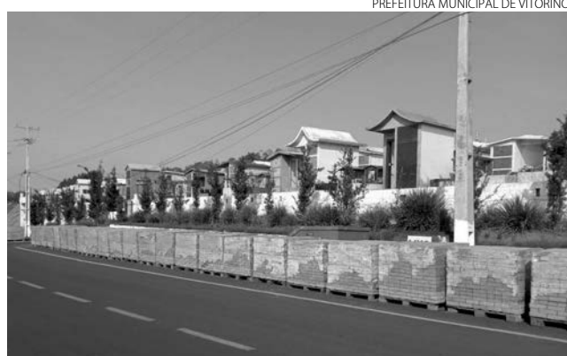
Fachada do cemitério com os materiais para reforma em frente

“O cemitério nunca foi revitalizado, havia apenas um grupo de voluntários que prestavam serviços, e ainda o fazem. É importante que o poder público se preocupe em cuidar da cidade como um todo, deixar tudo limpo, com flores, e precisamos olhar com carinho e atenção o cemitério, que é