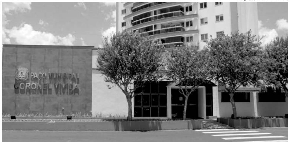
As vagas serão em qualquer uma das Unidades Administrativas, desde que compatível com o curso do estagiário

Mais informações podem ser obtidas no edital, disponível em: https://bit.ly/3yZ8hcG .