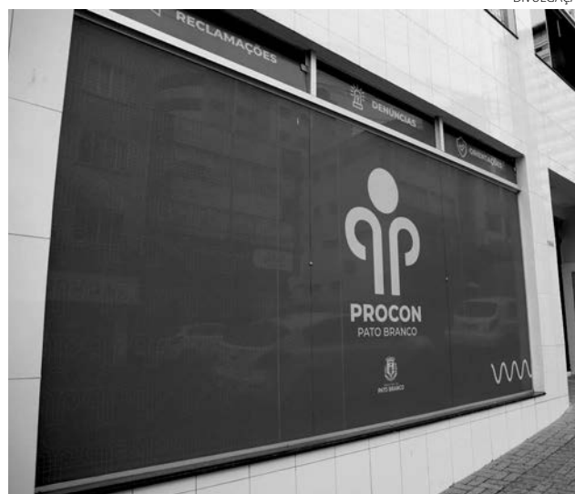
O objetivo da ação é evitar a judicialização das medidas

Para participar, a pessoa deve ir até o Procon munida com cópia dos seus documentos pessoais, comprovante de endereço, telefone e informar qual a instituição com que pretende negociar, indicando qual a