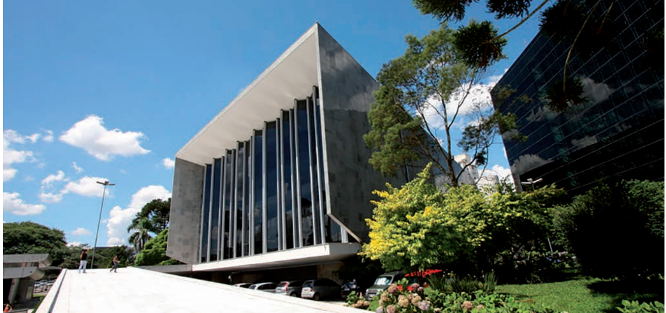
Escolha dos nomes da comissão foi feita pelos líderes partidários. Presidente e relator ainda serão definidos