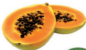
Mamão Papaya Kg