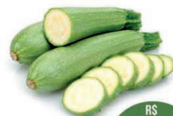
Abobrinha Verde Kg