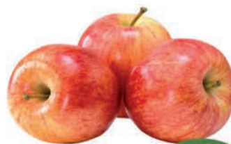
Maçã Fuji Kg