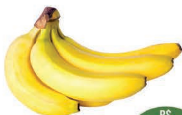
Banana Caturra Kg