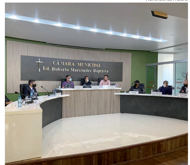
Reunião ocorreu na Câmara de Vereadores de Palmas

riores um pleiteamento de que o Batalhão de Palmas vire uma companhia", disse o vice-prefeito.