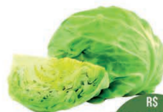
Repolho Verde Kg