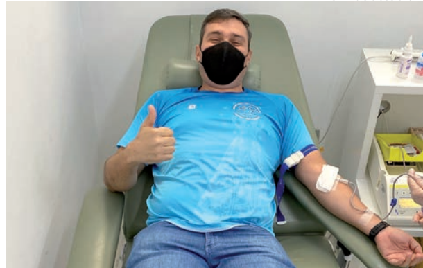
No momento a urgência no Hemonúcleo é O positivo e O negativo