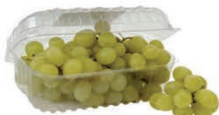
Uva Thompson Bandeja 500g