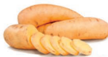
Batata Salsa Kg