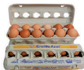
Ovos Vermelho Galinha Azul Dúzia