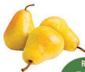
Pêra Importada Willians Kg