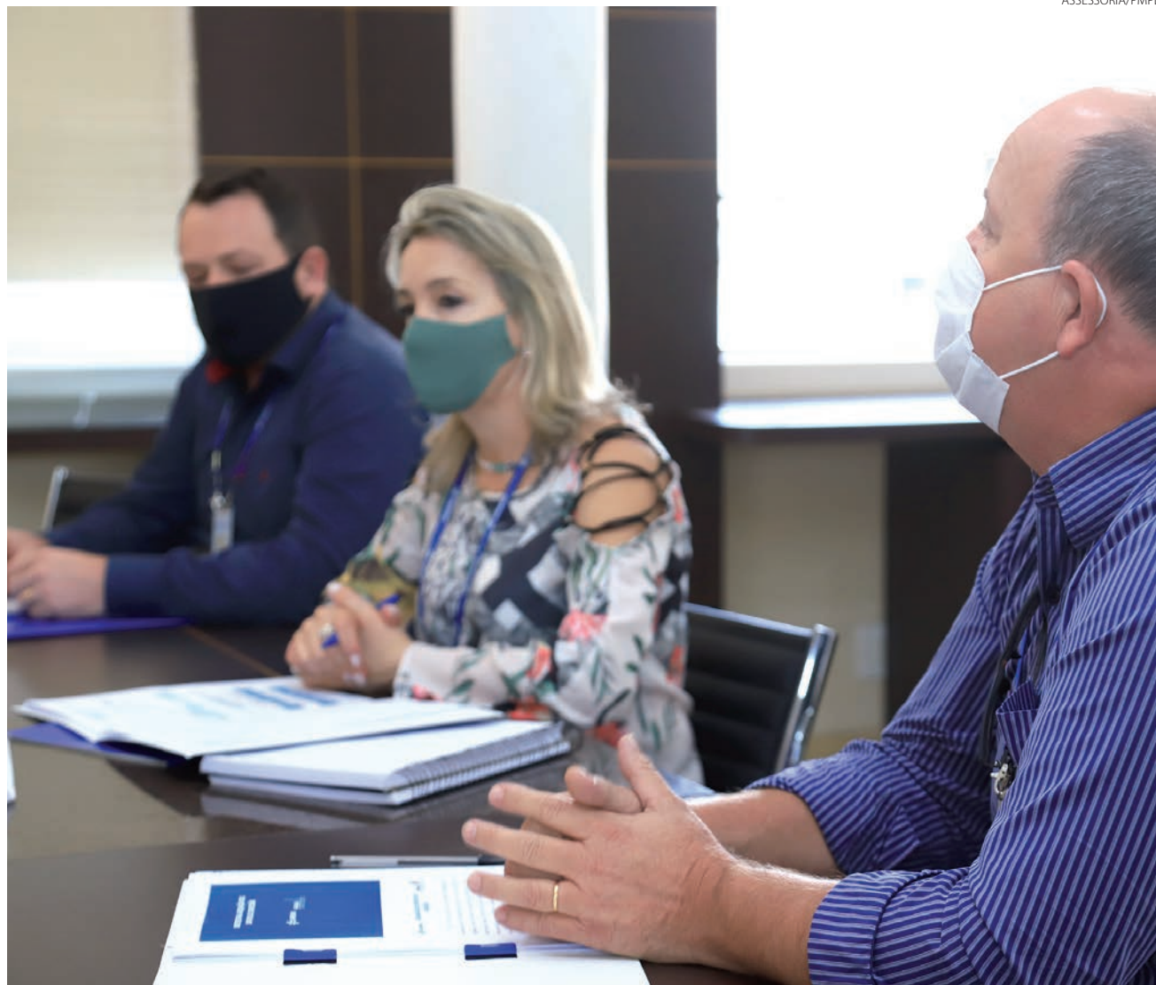
Equipe técnica da Sanepar se reuniu com o Executivo, nessa segunda-feira (26), no gabinete municipal