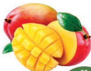
Manga Tommy Kg