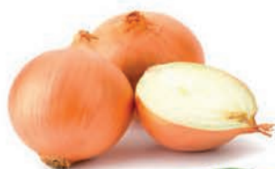
Cebola Importada Kg