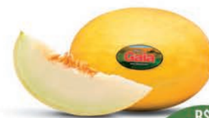
Melão Amarelo Gaia Kg