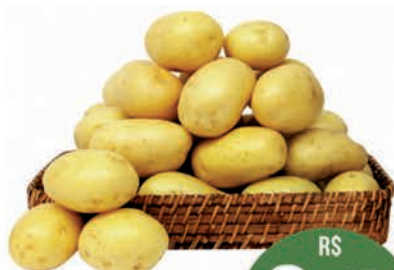
Batata Monalisa Kg