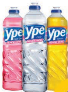
Detergente Líquido Ypê 500ml