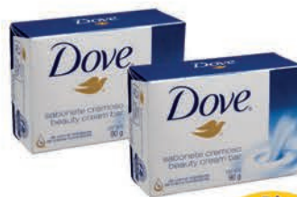
Sabonete Dove Tradicional 90g