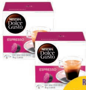
Café Dolce Gusto Espresso Tradicional C/16 Capsulas