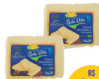
Queijo Mussarela Bela Vila Fatiado 150g