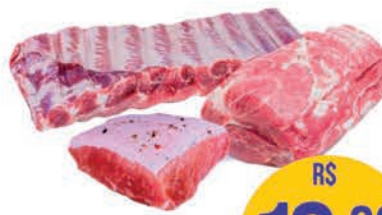
Costela, Copa e Picanha Suína Temperada Miolar Kg