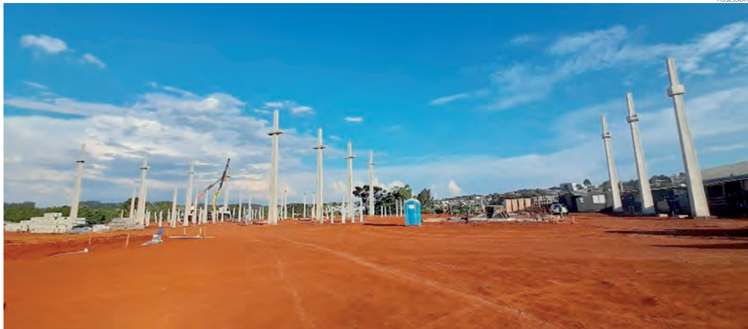
A Subestação Bela Vista 138 kV está sendo construída entre os bairros Cristo Rei e Novo Horizonte

Cristina Vargas cristina@diariosudoeste.com.br