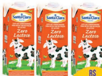
Leite Santa Clara Zero Lactose 1l