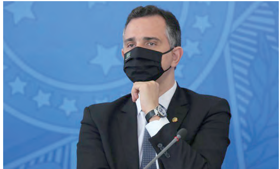
Rodrigo Pacheco anunciou como pautas das reuniões de segunda (19) e terça-feira (20) a análise de vetos presidenciais e projeto orçamentário

Outro motivo que atende ao Poder Executivo está no fato de que o projeto orçamentário que será analisado pelo Congresso abre caminho para mais gastos neste ano. O argumento do governo federal é retomar programas de socorro a empresas, como o Pronampe e a redução de jornadas e salários. A proposta, porém, vai além e autoriza aumento de outras despesas sem compensação financeira em 2021, inclusive para aten-