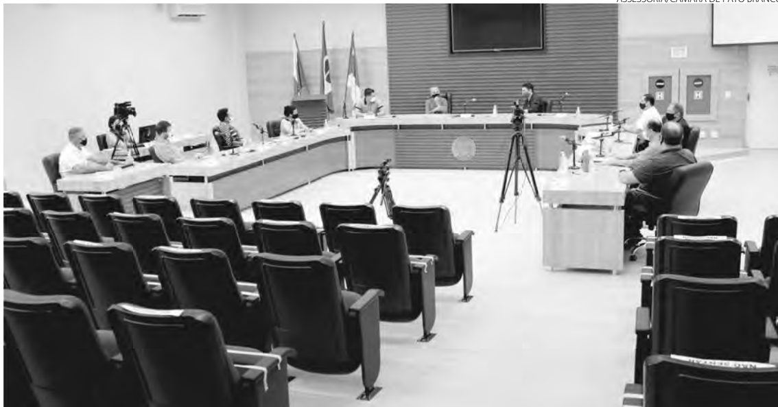
ASSESSORIA/CÂMARA DE PATO BRANCO

Vereadores se reuniram de portas fechadas para discutirem sobre Pelom