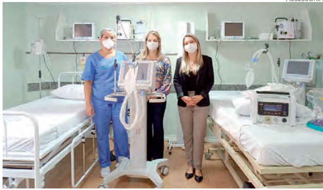
Investimento para novos leitos foi de R$ 400 mil

Segundo informações repassadas pelo chefe de gabinete, Rafael Barboza, o investimento para a aquisição dos leitos custou aos cofres da Prefeitura o valor de R$ 400 mil. Os leitos são para uso de pacientes do