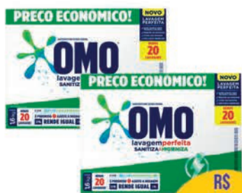
Sanitiza Roupas Omo Lavagem Perfeita 1,6kg