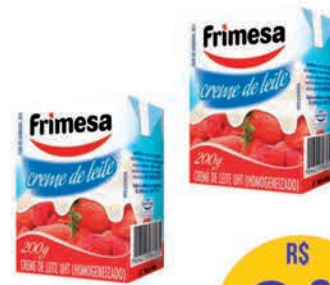
Creme de Leite Frimesa Tradicional 200g