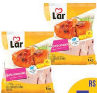
Sobrecoxa Frango Lar 1kg