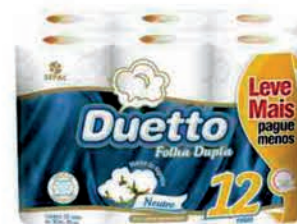
Papel Higiénico Duetto C/12 Rolos 30m Leve Mais Pague Menos