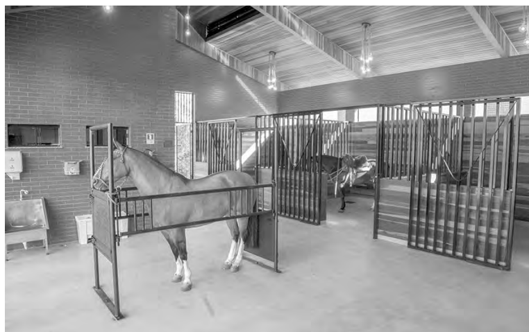
O Centro Veterinário possui três baias para cavalos, uma sendo UTI

A estrutura ainda conta com quatro laboratórios [análises clínicas, microbiologia, histopatologia e reprodução de grandes animais]. Além disso, há salas de internos, raio-X, área para isolamento de animais com doenças infecciosas e uma sala de necropsia.