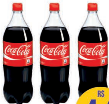
Refrigerante Coca-Cola Tradicional 1,5l