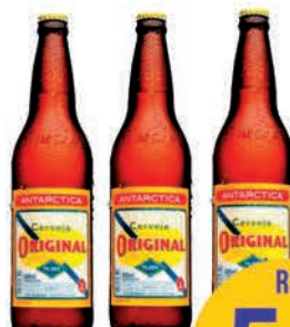
Cerveja Antarctica Original C/Casco 600ml