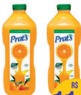
Suco Prat's Laranja 1,7l