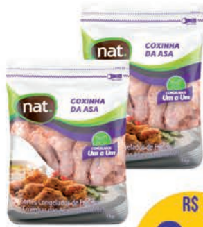
Coxinha Asa Frango Nat Pacote 1qf 1kg