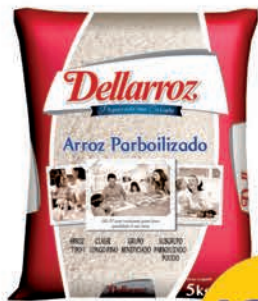
Arroz Parboilizado Dellarroz 5kg