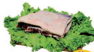
Costela Minga Bovina Kg