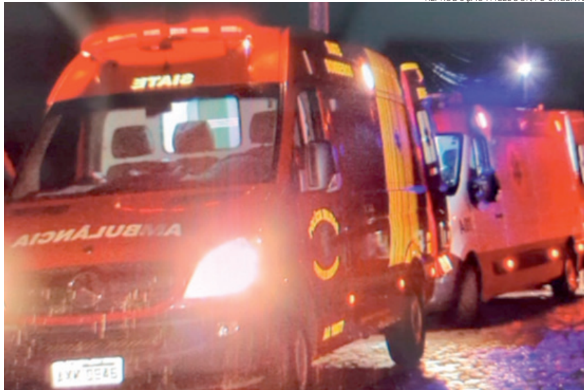
Equipe do Corpo de Bombeiros fez os primeiros socorros na vítima em Pato Branco antes da chegada do Samu