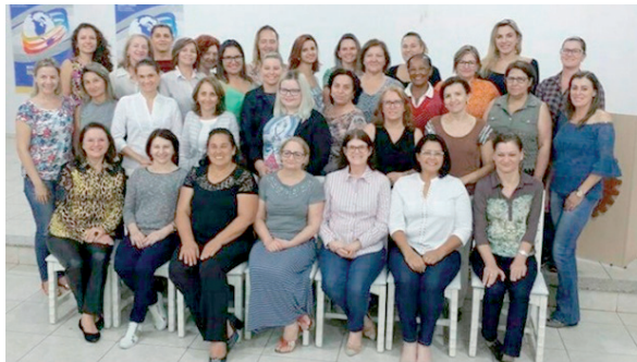
Fundação do Rotary Club de Pato Branco-Guarani – Companheiras 2017/18