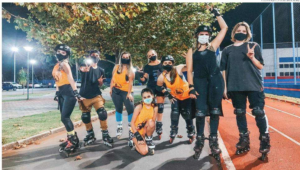
PATINS PATO BRANCO

O grupo é sem fins lucrativos e todos os participantes são amadores da pa-