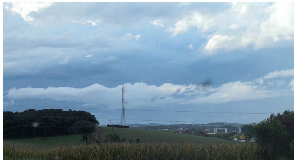
Massa de ar frio chegou ao Sudoeste trazendo o primeiro friozinho do ano