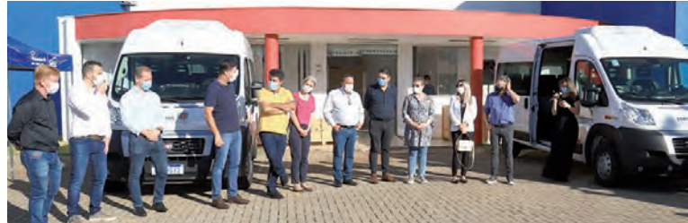
Entrega realizada na tarde de quarta-feira