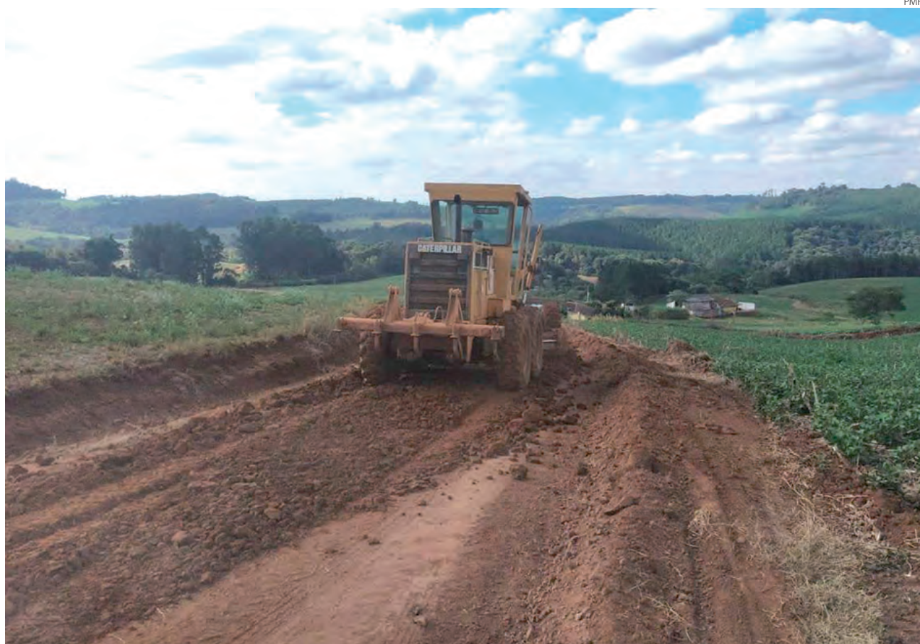
Equipes da Prefeitura de Francisco Beltrão recuperando as estradas nas regiões de Volta Alegre e do Rio Pedreiro. Trabalhos de alargamento, recuperação e cascalhamento das estradas seguem em várias comunidades do interior do município.