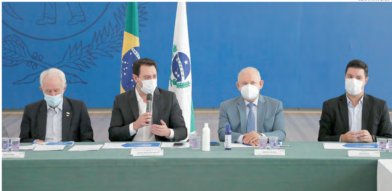
O programa foi apresentado pelo governador Ratinho Junior aos deputados estaduais

Serão aceitas propostas para o atendimento especializado de crianças vítimas de violência; portadores de algum tipo de deficiência; crianças acolhidas em casas lares, famílias acolhedoras e/ou aguardando adoção; além de programas de aprendizagem e serviços de convivência e fortalecimento de vínculos. A avaliação dos projetos será feita pelo Conselho Estadual dos Di-