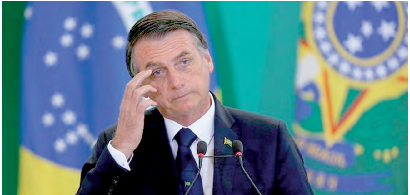
Bolsonaro usou o fato de os Estados aplicarem recursos federais para pagar salários para pressionar a inclusão de governadores e prefeitos na CPI

No Rio, os R$ 2 bilhões livres recebidos serviram principalmente para pagamento de policiais. Em Roraima, o governo repassou os R$ 147 milhões que não eram vinculados à covid para pagamento de salários de profissionais da saúde. "Tendo em vista a necessi-