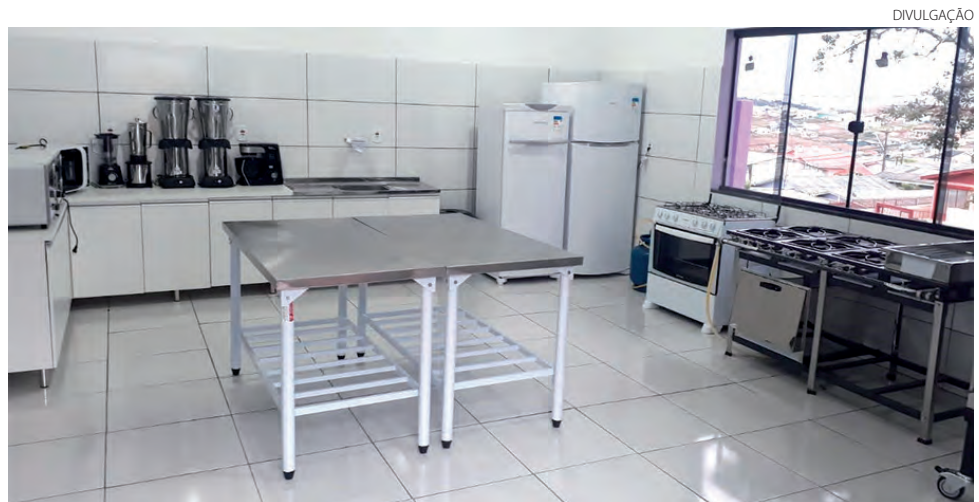
A cozinha tem capacidade para atender 20 alunas ao mesmo tempo