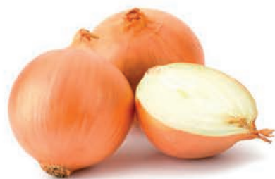
Cebola Importada Kg