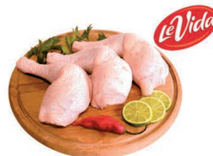
Coxa S/Coxa Frango Congelada Inteira Levida Kg