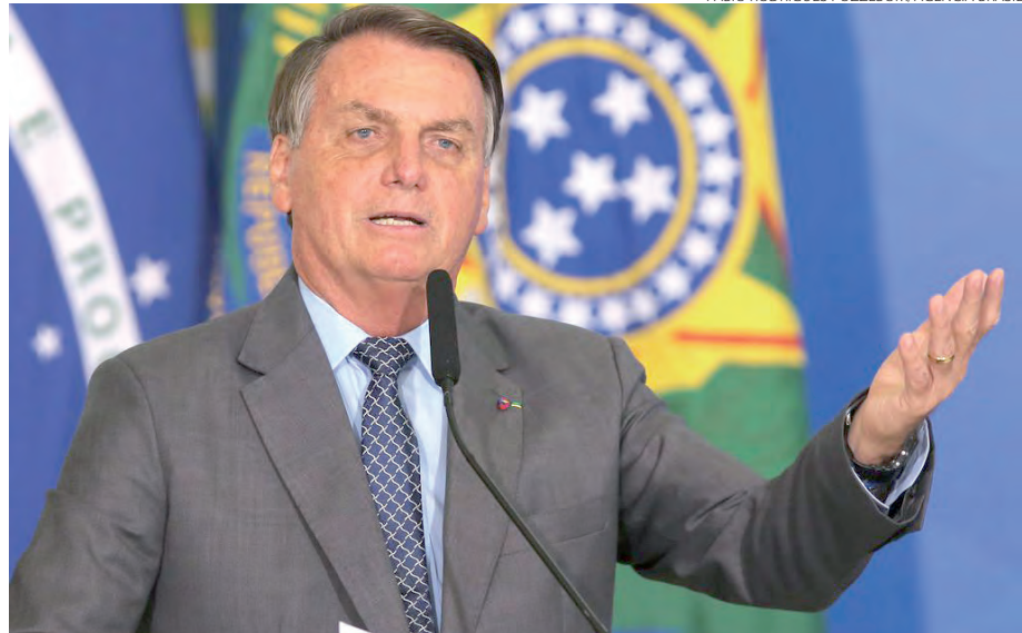
Bolsonaro fez diversas críticas a Aziz