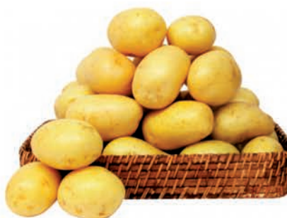
Batata Monalisa Especial Kg