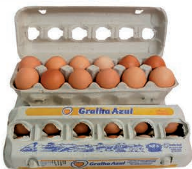
Ovos Vermelho Galinha Azul Dúzia