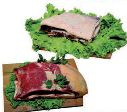
Costela Minga e Ponta de Peito Bovina Kg