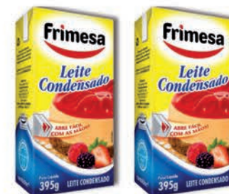
Leite Condensado Frimesa Tradicional 395g