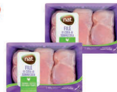
Filé Coxa Sobrecoxa Nat Atm 800g