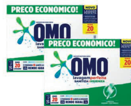
Sanitiza Roupas Omo Lavagem Perfeita 1,6kg