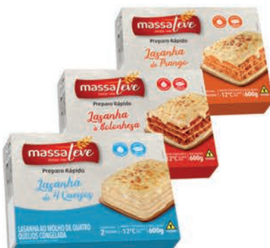
Lasanha Massaleve 600g