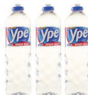
Detergente Líquido Ypê 500ml