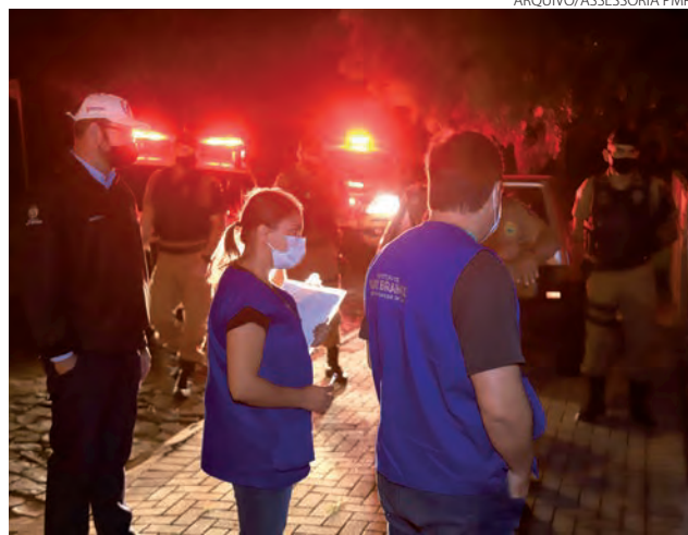
Decreto estadual e municipal estabelecem toque de recolher das 20h às 5h

De acordo com a Vigilância Sanitária de Pato Branco, a medida leva em consideração os dados epidemiológicos do município e está em consonância com as medidas de segurança já estabelecidas de combate à pandemia.