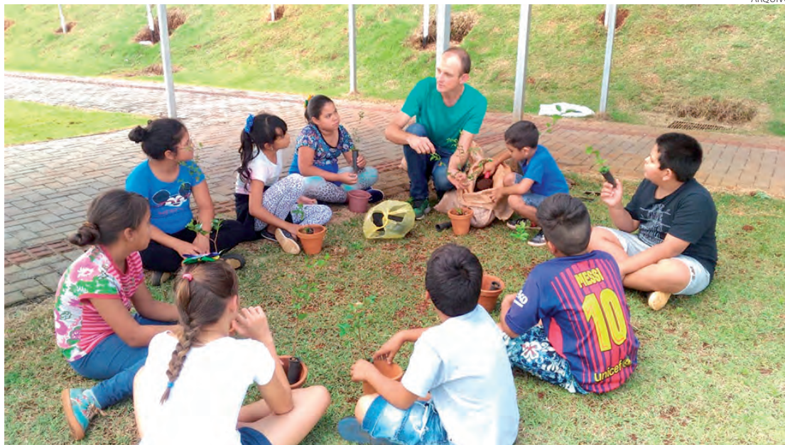
Projeto de meditação realizado antes da pandemia com crianças do Remanso da Pedreira