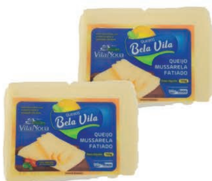
Queijo Mussarela Bela Vila Fatiado 150g