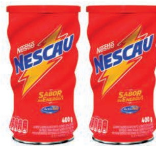
Açocolatado Pó Nescau Tradicional Lata 400g