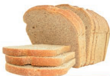
Pão Integral Super Polo Tradicional 360g