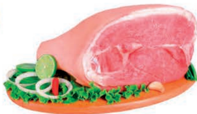
Pernil Suíno C/Pele Kg