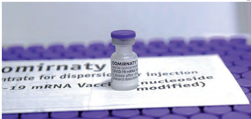
Imunizantes da Pfizer/BioNTech são acondicionadas em refrigeração diferenciada

Com durabilidade diferente das outras vacinas já disponibilizadas no município, o imunizante da Pfizer teve sua distribuição levando em consideração a capacidade dos municípios para o armazenamento. A vacina possui validade de seis meses se mantida entre -80°C