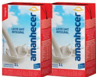
Leite Amanhecer Tradicional Integral 1l