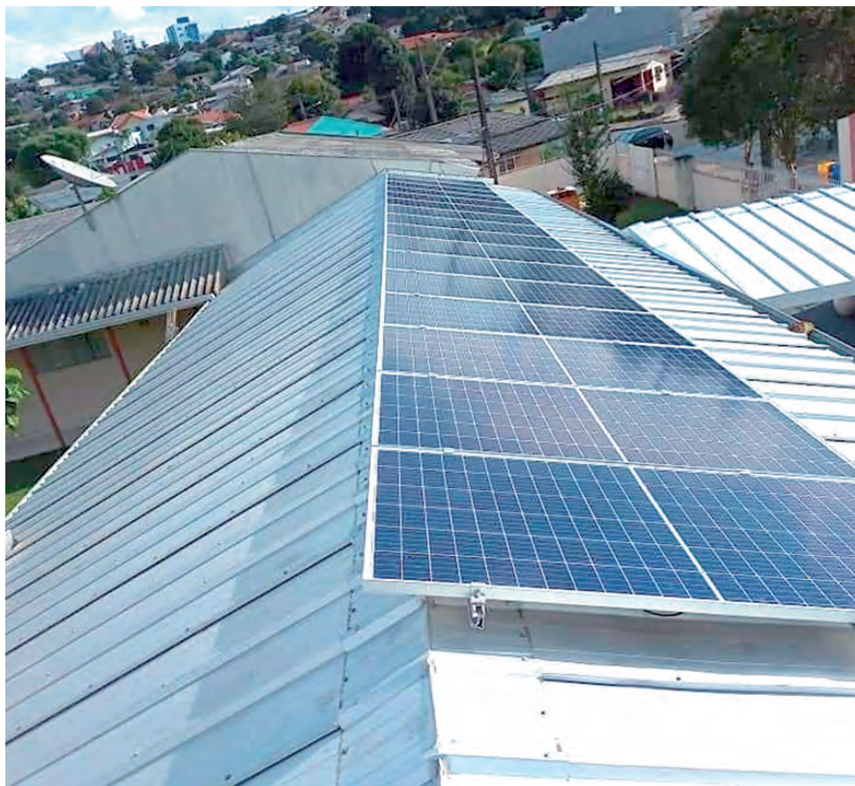
Painéis fotovoltaicos instalados na Apae de Pato Branco

nicos, que possui fábrica em Pato Branco, financiou a instalação do restante do equipamento, para garantir que a escola tenha uma unidade para atender a sua necessidade completa de geração.