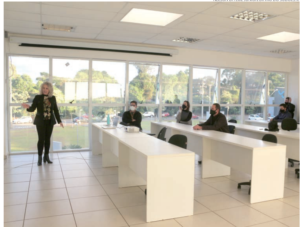
Em 2021 será verificada a viabilidade das propostas do projeto

Outra iniciativa que deve fazer parte do projeto Cidade Inteligente 5.0 é a Motivatec, um evento tecnológico itinerante que deve ser realizado nos bairros da cidade. Por conta da pande-