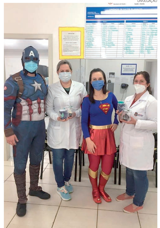
Profissionais foram homenageados ontem