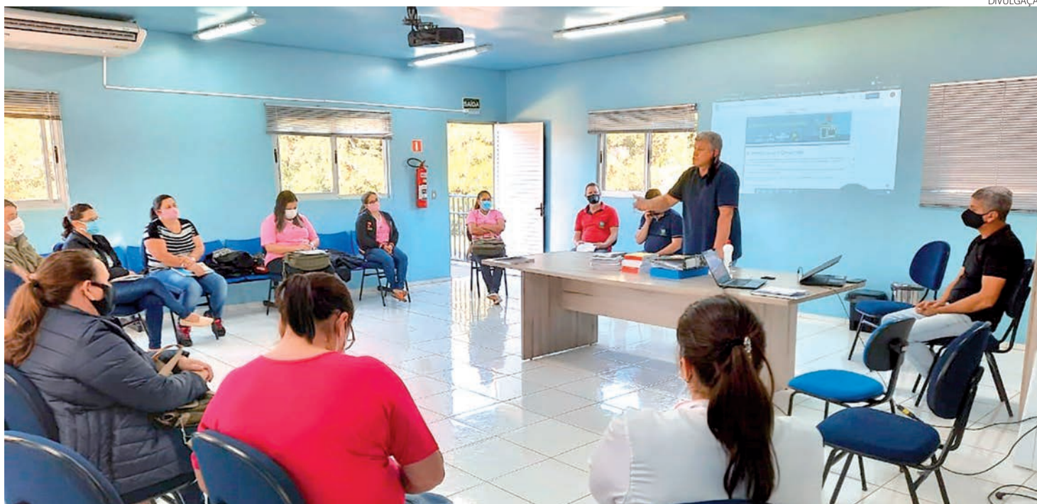
Reunião que deu início à coleta de dados aconteceu no dia 3 de maio

Levantamento pretende encontrar alternativas para o fortalecimento da economia no município da Fronteira com a Argentina