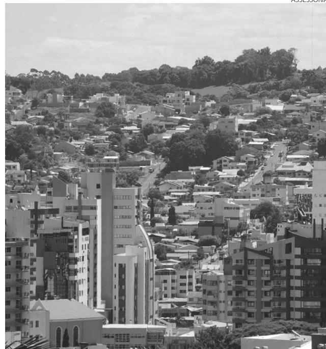
Para o próximo ano, o Município de Pato Branco contará com R$ 7.490.331,36 em Emendas Impositivas