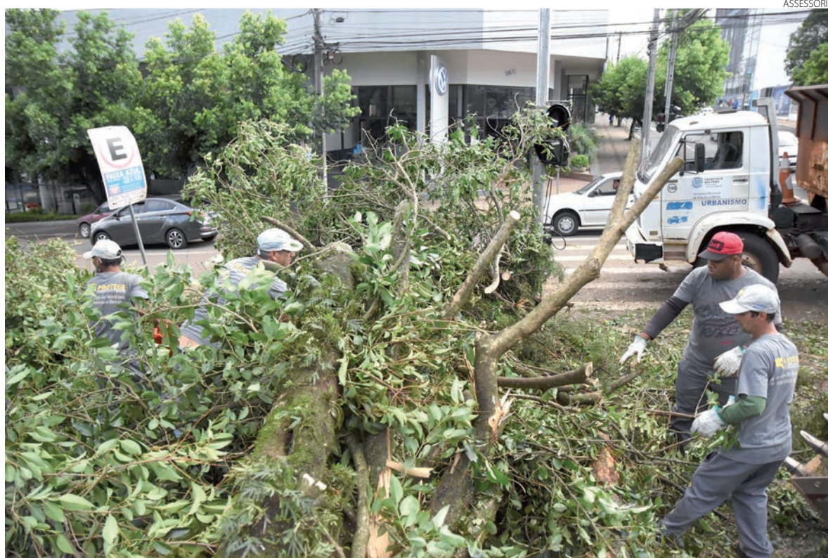
Equipes da Prefeitura, da Defesa Civil e do Corpo de Bombeiros trabalham de forma ininterrupta desde a tarde de domingo (28) até a segunda-feira (29), quando Francisco Beltrão foi atingido por um forte vendaval.