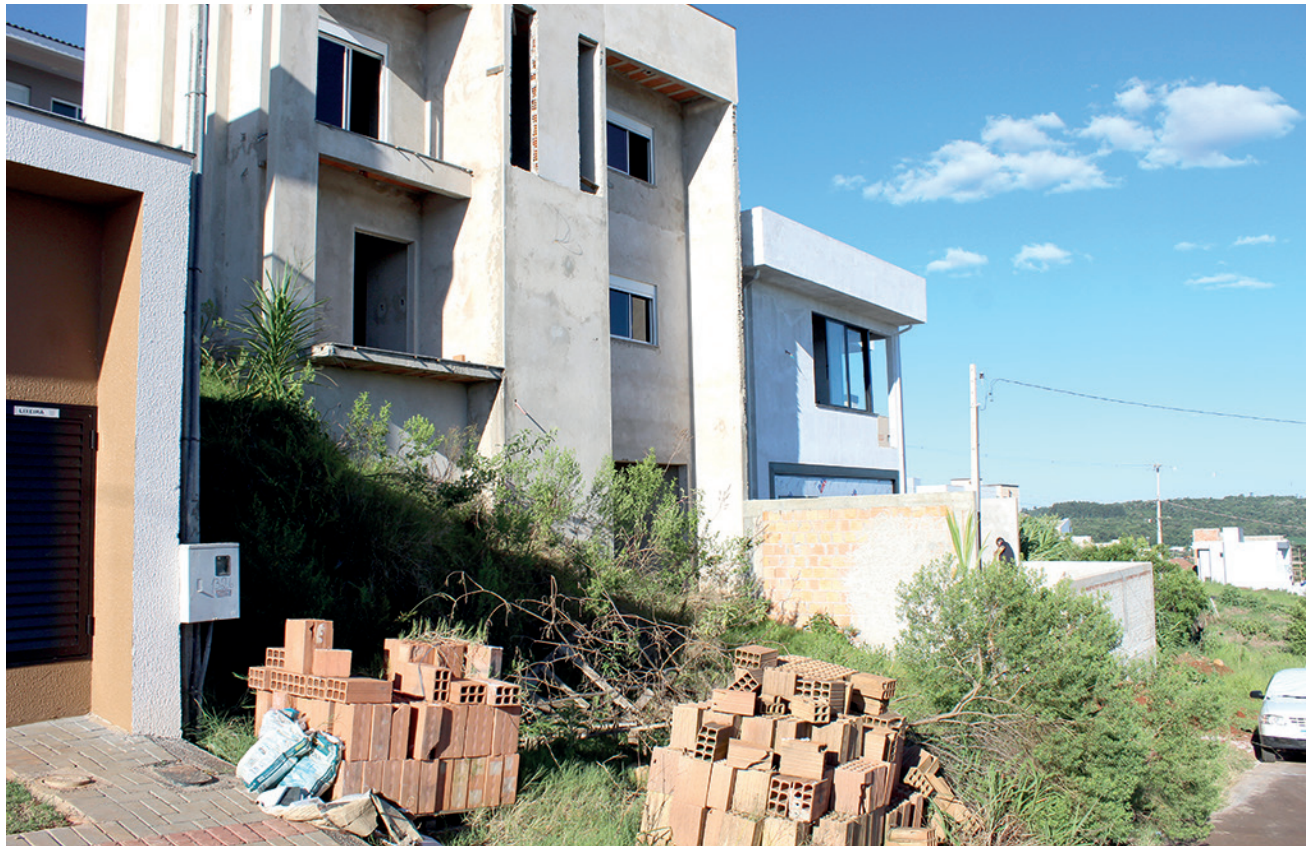
A construção civil foi o setor que teve o maior índice negativo no mês

pios do Sudoeste apresentaram saldo positivo de 854 posto de trabalho no mês de outubro, reflexo de 7.172 admissões e 6.318 desligamentos.