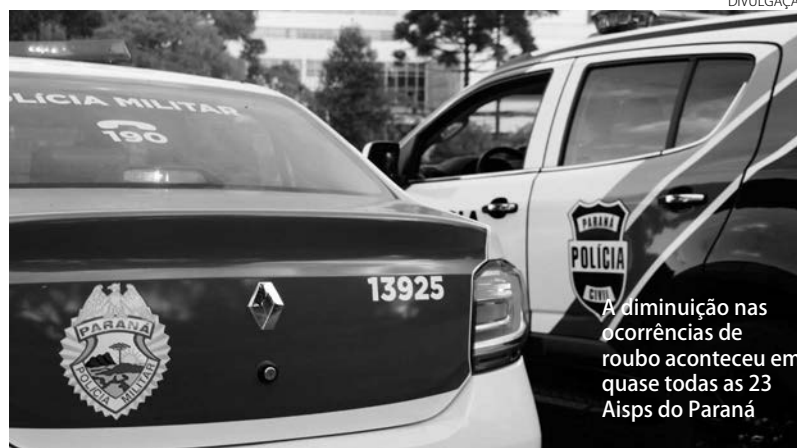
A diminuição nas ocorrências de roubo aconteceu em quase todas as 23 Aisps do Paraná

Ainda sobre os casos de roubo (geral), 18 Aisps tiveram redução de janeiro a setembro de 2021. A 20ª Aisp (Londrina), que também abrange outros quatro municípios da região Norte do Estado, teve a maior redução (33,58%), em relação ao mesmo período do ano passado, isto é, caiu de 2.189 para 1.454 registros. Em segundo lugar na redução de roubos está a 1ª Aisp (Curitiba), que diminuiu de 10.189 ocorrên-