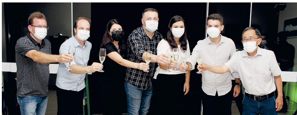
Empresários lourencianos, gerentes e diretores da Unimed Pato Branco que prestigiaram a inauguração da nova unidade do CAS/APS

Contudo, a Unimed Pato Branco sempre almejou disponibilizar uma estrutura que atendesse de forma completa as famílias, com plano de saúde com a Cooperativa. Eis que chegou o momento dos beneficiários de São Lourenço do Oeste e dos municípios vizinhos, desfrutarem dos serviços do