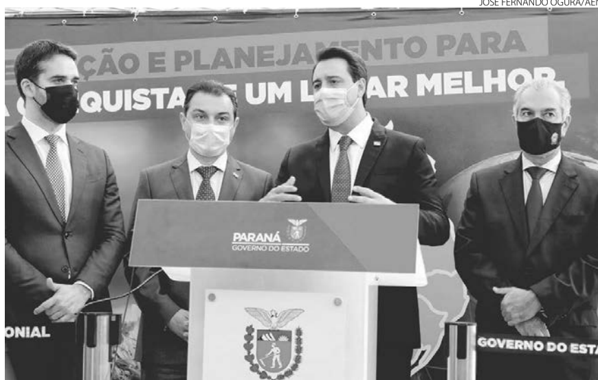
Também teve troca da presidência rotativa do Codesul, que em 2021 estava sendo liderado pelo Paraná

A elaboração de um plano de desenvolvimento integrado, nomeado Codesul/BRDE – Visão Regional 2040, foi anunciada em junho deste ano, em uma reunião do Codesul realizada em Porto Alegre. O objetivo é criar um diagnóstico regional que identifique as agendas que cada governo deve promover para melhorar a qualidade de vida e poten-