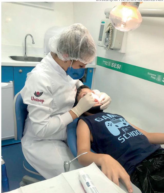
Os alunos da Escola Municipal Dalva Ana Bortolini são os primeiros a participar do circuito de saúde

tura de Clevelândia com o Serviço Social da Indústria (Sesi), serão atendidos cerca de 700 estudantes.