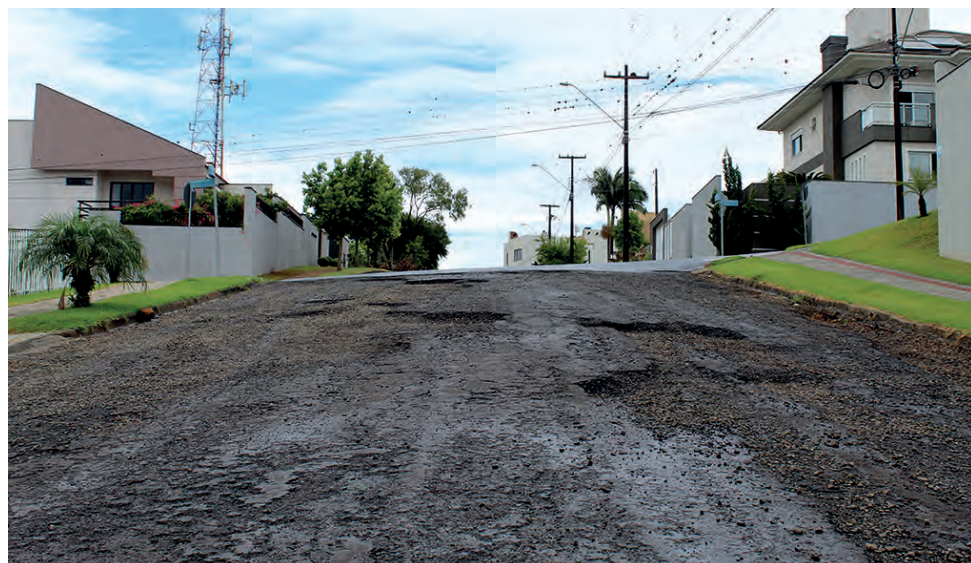
Trecho da rua Aimoré requer bastante atenção dos condutores

todas essas vias até meados de dezembro, para darmos inícios nessas obras já primeira quinzena de janeiro. Ainda no início do ano faremos uma quinta etapa, contemplando diversas ruas que atendem, especialmente, a lista de espera", afirmou o secretário de obras.