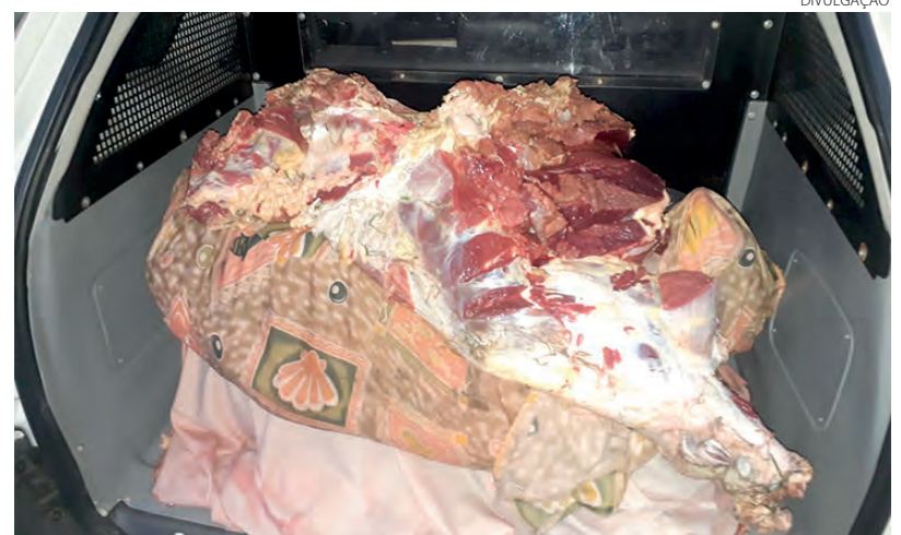
A Polícia Militar apreendeu a carne do animal abatido pelos ladrões

lícia Militar, o bovino foi furtado em uma propriedade rural na linha Busquerolli, em Mangueirinha. O proprietário do animal foi localizado e acompanhou a ocorrência. Os acusados do furto, a vítima e a carne apreendida foram encaminhados à Delegacia da Polícia Civil de Pato Branco para as devidas providências. (AB)