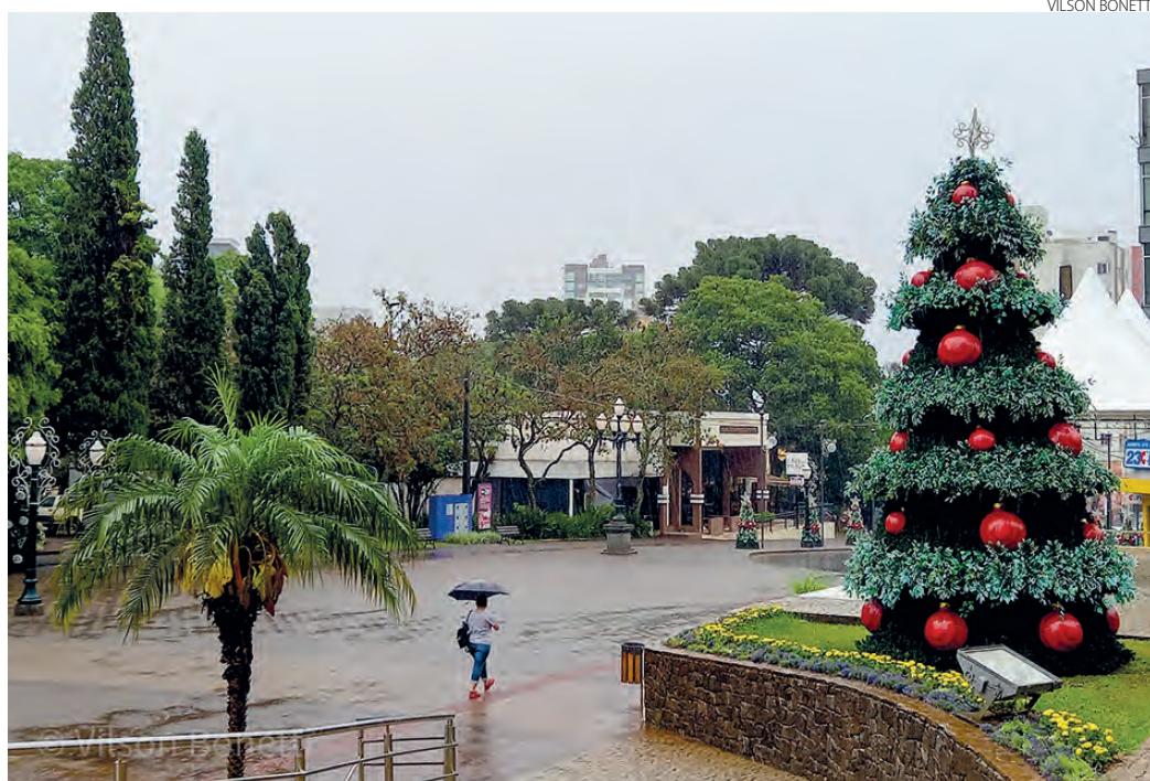
Manhã de quinta-feira (18) chuvosa, na praça Presidente Vargas, em Pato Branco, já com a decoração para a abertura do Natal, que acontece nesta sexta-feira (19).