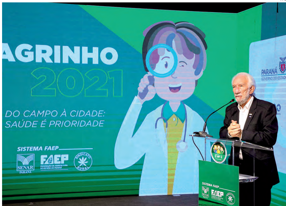
Desenvolvido pelo Sistema Faep em parceria com o Governo do Estado, programa envolve alunos e professores de escolas da rede pública