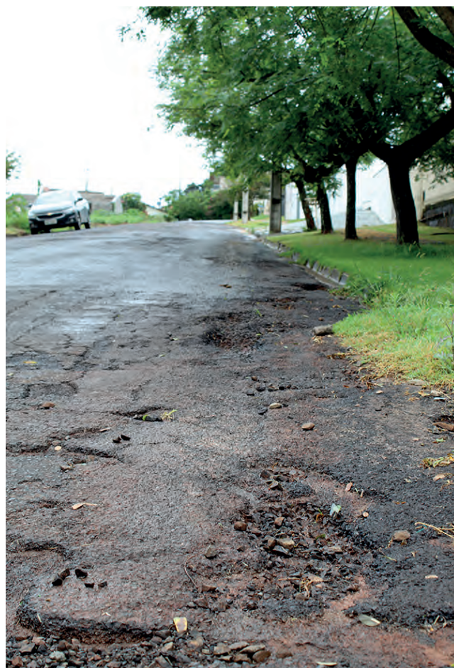
No cruzamento das ruas Itapuã e Pedro Soares, o asfalto também está deteriorado

"Nosso projeto de manutenção e revitalização das vias urbanas de Pato Branco contempla diversos bairros. São ruas importantes para a trefegabilidade de todo o município, além de demandas antigas da população. Temos como meta já licitar