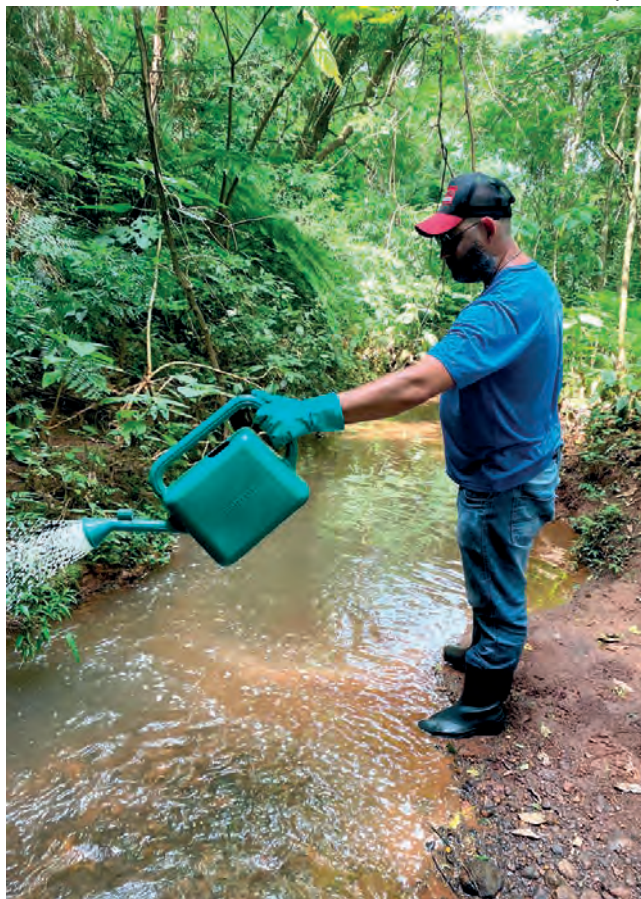
A aplicação foi destinada ao perímetro urbano nesta etapa