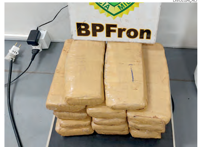
A maconha que estava na bagagem da passageira do ônibus

carro e o produto foram entregues na Delegacia da Receita Federal de Santo Antônio do Sudoeste.