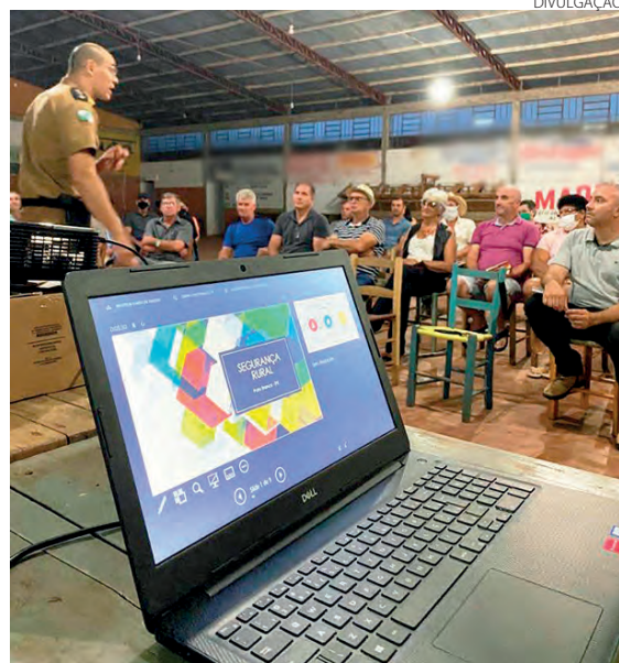
Os agricultores foram orientados sobre como devem agir para evitar furtos e roubos