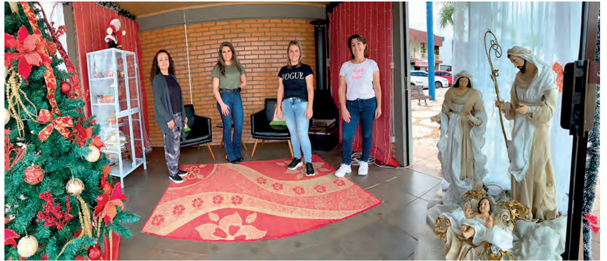
Município já está montando a decoração natalina