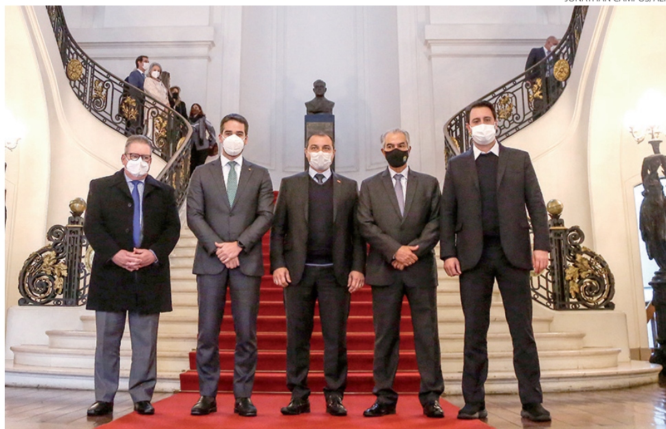
Encontro do Codesul foi no Palácio Piratini, em Porto Alegre

"Esses quatro estados compartilham entre si a vocação do planejamento. Se