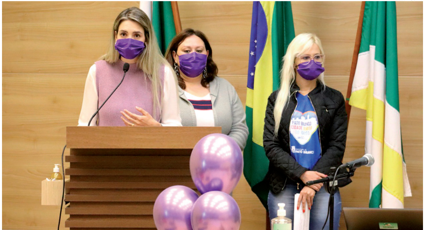
A equipe da Secretaria Municipal de Assistência Social de Pato Branco esteve na Câmara na sessão de segunda-feira (14)

"Nessa campanha de conscientização o que nós mais gostaríamos de dizer é que o respeito pelo idoso deve vigorar, porque nós todos gostaríamos de chegar um dia na idade que eles têm hoje, e é importante men-