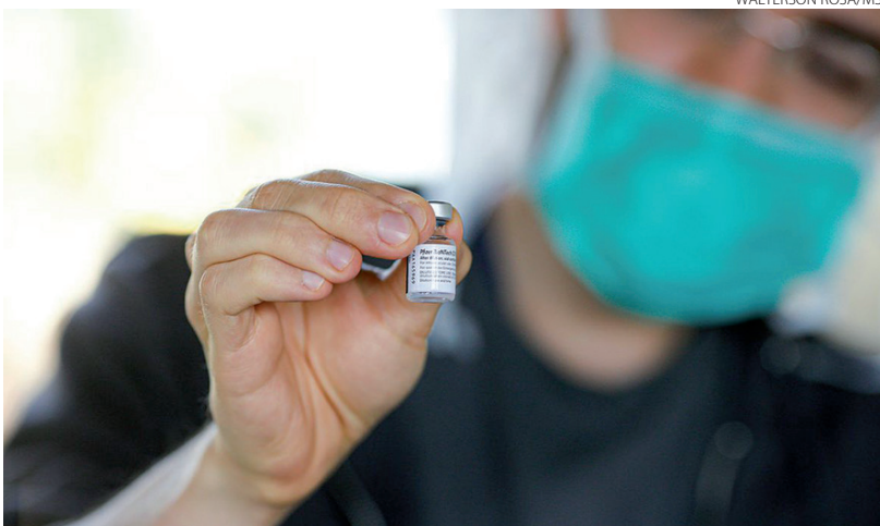
Pfizer fechou acordo com o governo brasileiro em março deste ano que envolve a aquisição de 100 milhões de doses