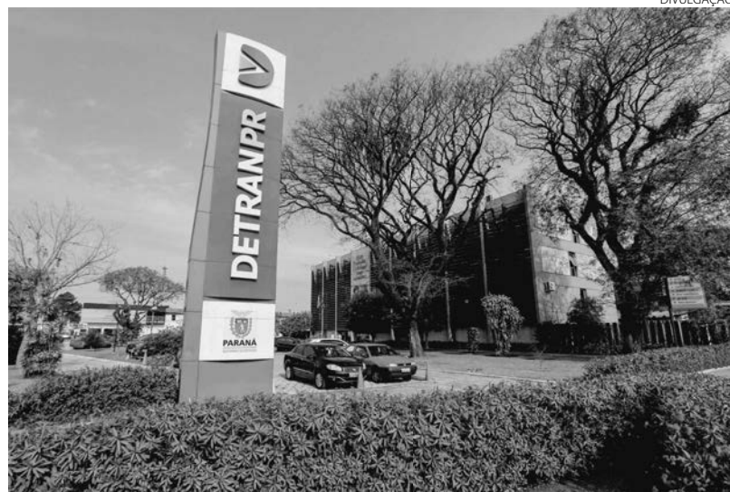
Os veículos poderão ser examinados nos locais onde se encontram

Os veículos poderão ser examinados nos locais onde se encontram, de segunda à sexta-feira, das 8h às 14h, nos 10 dias que antecedem ao leilão, sendo que as autorizações para acesso aos locais de depósitos (exige que se apresente documento de identidade, reconhecido por lei federal) deverão ser obtidas em um dos endereços relacionados, obedecendo os critérios de segurança e assepsia estabelecidos pela Organização Mundial da Saúde (OMS) e decretos locais vigentes em função da Covid-19. (AEN)