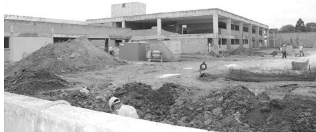
Esquema fraudava atestados de medições feitas nas obras das escolas públicas

tre eles um imóvel rural em Atalaia do Norte (AM) e outro veículo, ainda serão leiloados e os valores posteriormente destinados ao erário. Ao final da venda de todos os bens, pretende-se alcançar cifra superior a R$ 5 milhões, valor fixado no acordo de colaboração – homologado pela Justiça – a título de reparação do dano causado e multa penal.