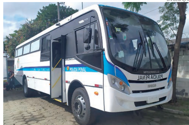
Os ônibus adaptados têm capacidade para 28 pessoas sentadas, com dois compartimentos de celas