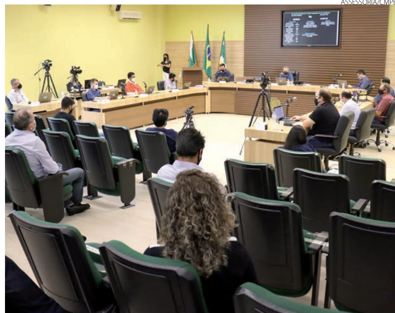
Segundo o Legislativo, a reforma seguirá regras de previdência social adotadas pela União e também referendadas pelo Governo do Paraná

Segundo a Comissão, a reforma é necessária para seguir as mesmas