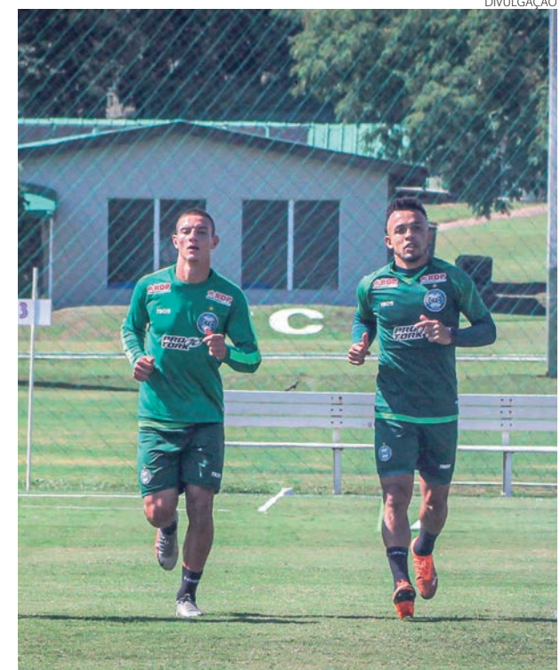
O Coritiba fez o último treino antes de encarar o Furacão

Já o Athletico está disputando o Campeonato Paranaense com o time de aspirantes. Na última rodada, o Furacão perdeu para o Azuriz, por 1 a 0, em jogo disputado em Pato Branco. Agora a equipe treinada por Bruno Lazaroni quer a reabilitação no clássico para encaminhar a classificação à próxima fase do Estadual. O Furacão é o sétimo colocado, com nove pontos. Já o Coritiba está em segundo lugar, com 13 pontos.