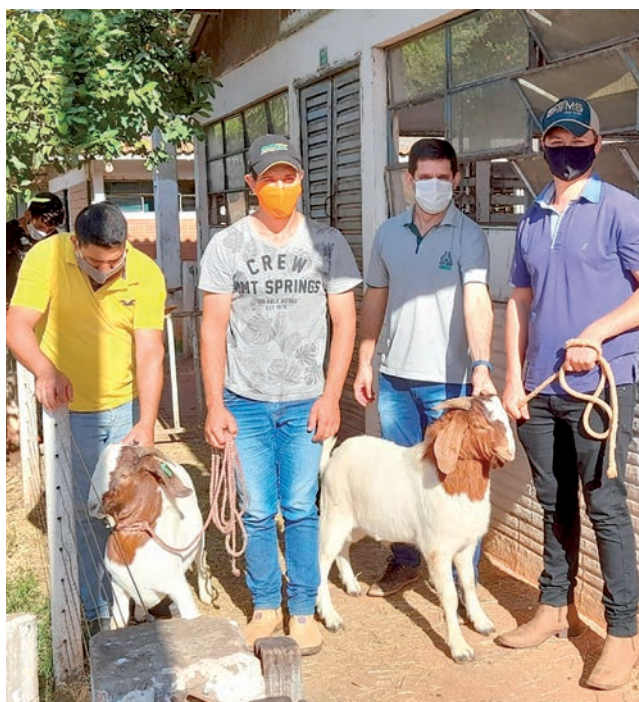
Animais estão sendo entregues na unidade do IDR em Pato Branco

O projeto é destinado para pequenos produtores com os devidos registros legais, que já possuem cabras em seu rebanho, pois a iniciativa realiza a entrega apenas de espécimes machos. A contrapartida dos beneficiados é de R$ 100 por animal, valor simbólico, segundo Silveira.