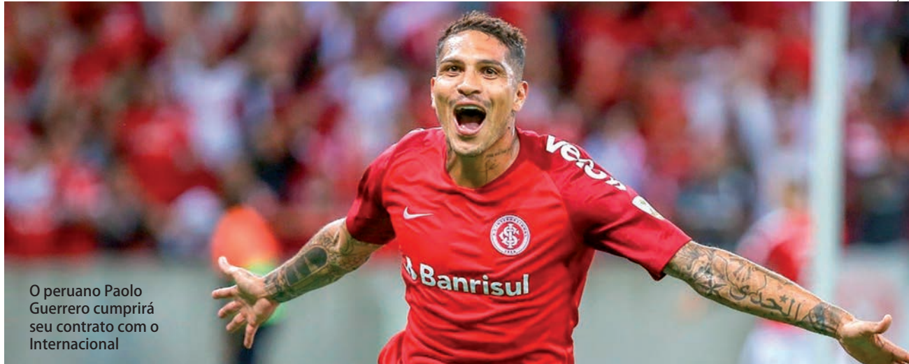
O peruano Paolo Guerrero cumprirá seu contrato com o Internacional