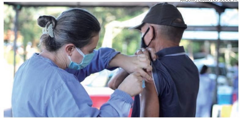
ARQUIVO DIÁRIO DO SUDOESTE

No caso da microrregião e Pato Branco, as novas doses che-