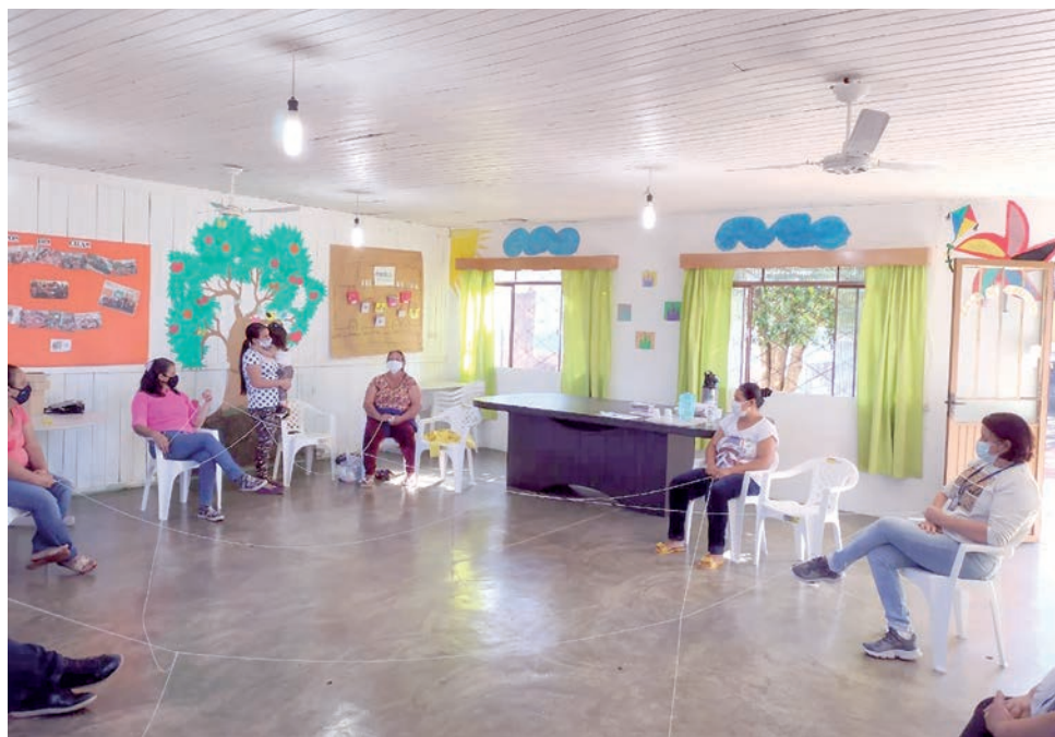
Primeiro encontro presencial seguiu todas as medidas de prevenção a covid-19

Com encontros mensais, o Centro de Referência de Assistência Social (Cras) do município segue a metodologia dos “Contos