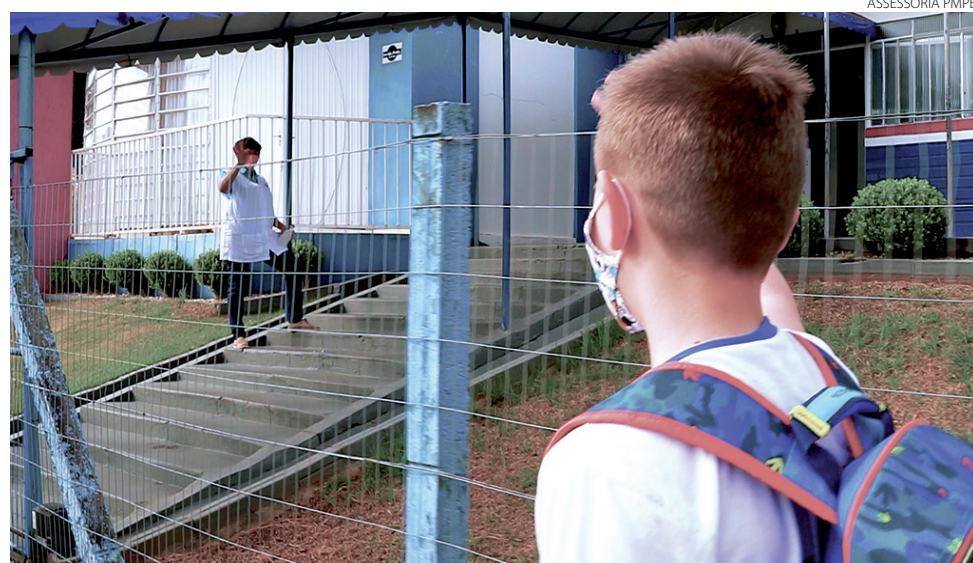
Para o retorno das atividades nos ambientes educacionais, foram criados protocolos sanitários

Além dos livros didáticos integrados, o Sistema de Ensino Aprende Brasil contempla um ambiente virtual de aprendizagem com