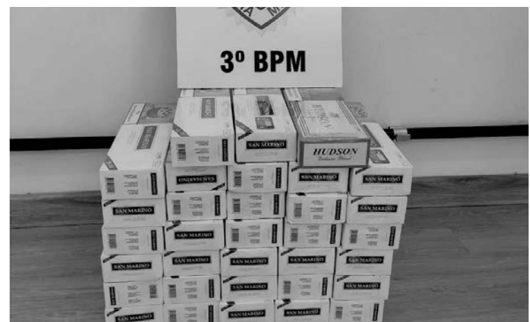
Cigarros contrabandeados estavam com mulher de 44 anos de idade

Diante do fato, a abordada foi devidamente qualificada e os cigarros foram apreendidos e encaminhados para os procedimentos legais. O crime de Contrabando e Descaminho é previsto no Art. 334 do Código Penal, cuja pena pode chegar a 4 anos de reclusão. (Redação)