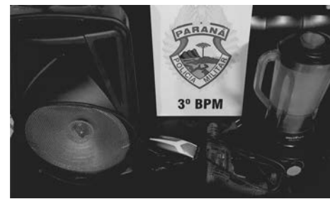
Objetos recuperados pela Polícia Militar

Questionado, o abordado entrou em contradição relatando ter adquirido os equipamentos pelo valor de R$ 180,00 de um rapaz. Desta forma, ele recebeu voz de prisão pelo crime de receptação e foi encaminhado, juntamente com os objetos apreendidos, para as providências legais cabíveis.