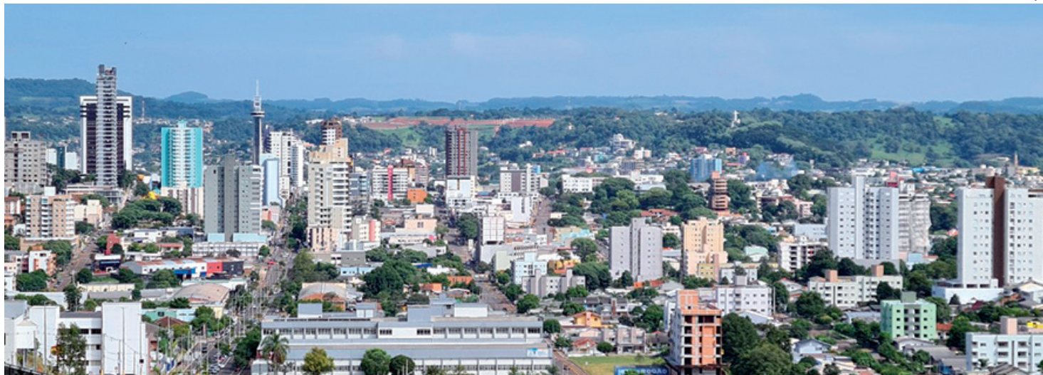
Flexibilização dos eventos foi anunciada ontem

Ainda de acordo com Fontana, se a situação continuar favorável, a partir de setembro a meta é liberar eventos com até 500 pessoas. O objetivo é beneficiar um dos setores que mais sentiu os efeitos da pandemia. “É claro que va-