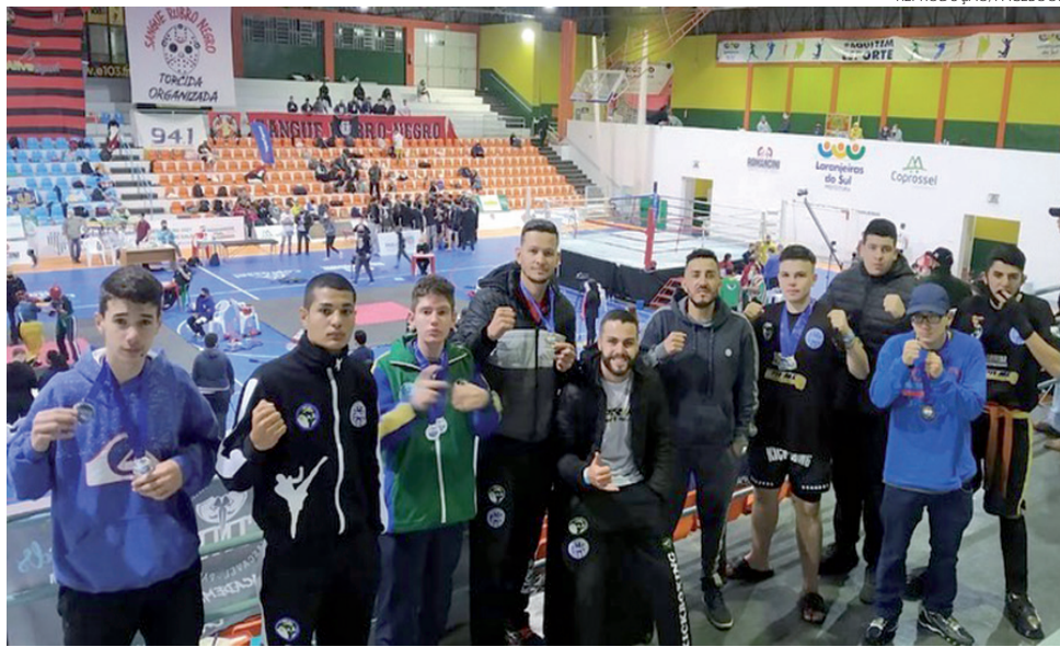
Equipe de Palmas, que recebeu medalhas na competição

Promovido pela Delegacia Estadual de Kickboxing, a Confederação Brasileira (CBKB) e a Associação Mundial (Wako), além da parceria com o Governo do Estado e da prefeitura de Laranjeiras do Sul, a com-