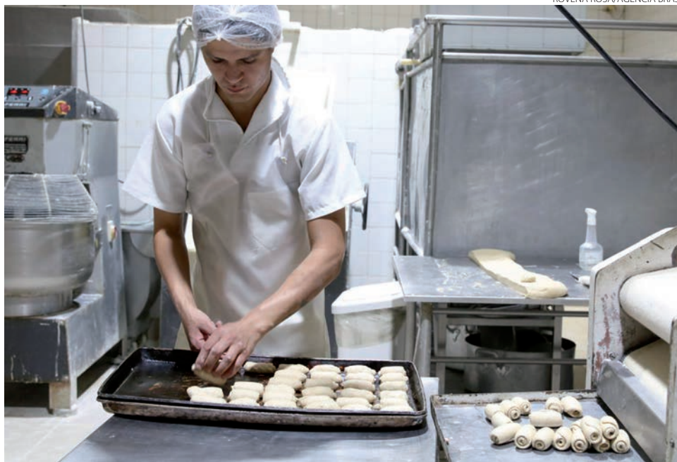
A primeira vez que o segmento voltou ao patamar antes da pandemia foi em fevereiro de 2021

A maior alta dentre todas as atividades ocorreu nos serviços prestados às famílias. Avanço de 17,9%. Foram também destaque no mês, embora tenham menor