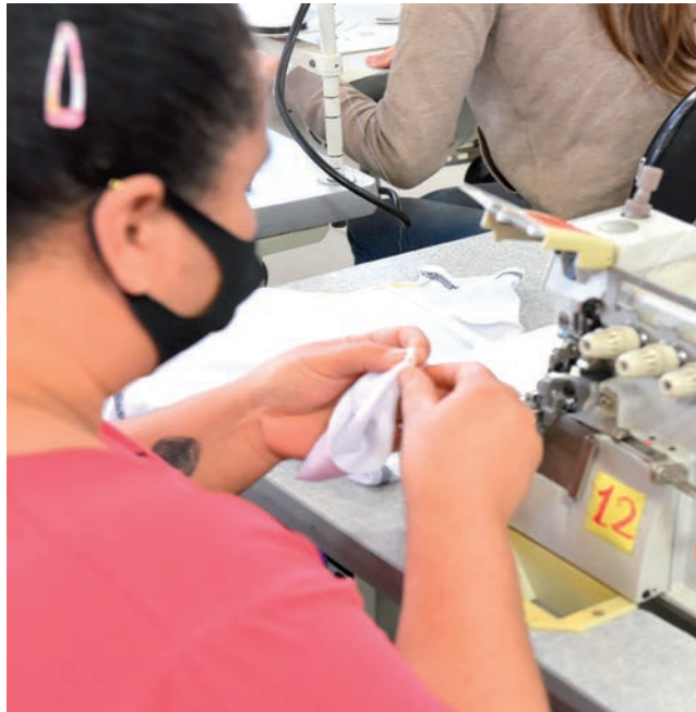
Curso para iniciantes em corte e costura terá sequência com aperfeiçoamento de pilotista

Terezinha comenta que, após o término dessa quali-