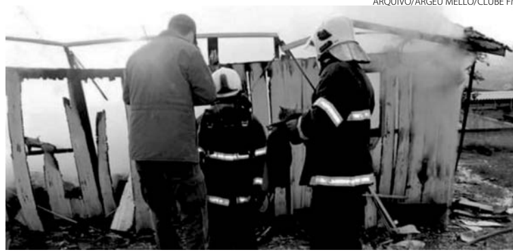
Suspeito alegou que cometeu o crime sob efeito de drogas

Além do homicídio foi constatado que posteriormente foi ateado fogo na residência com o intuito de apagar qualquer indício que pudesse levar à desco-