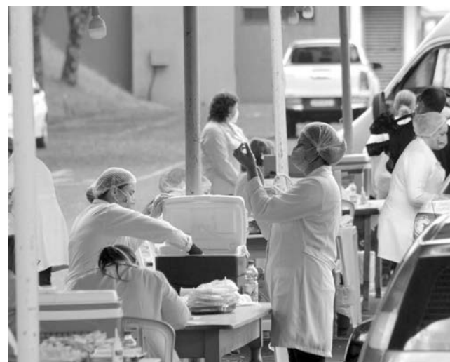
A Moção de Aplauso foi aprovada na segunda-feira (12)