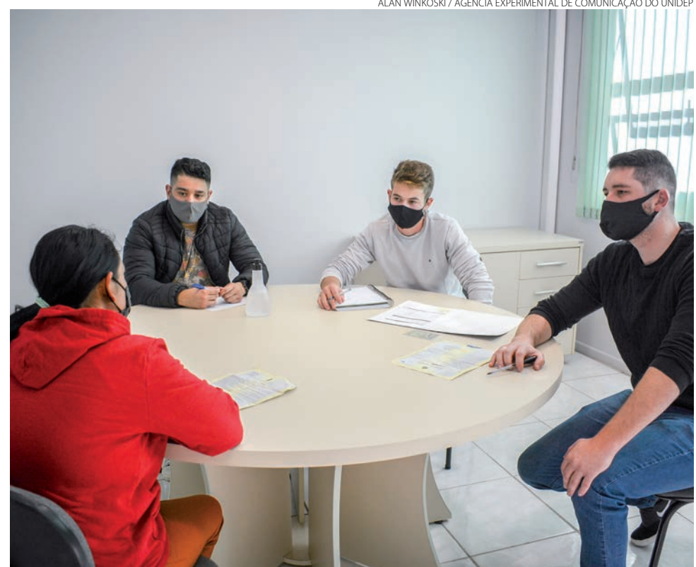
Acadêmicos estão atendendo moradores de Pato Branco, Vitorino e Bom Sucesso do Sul