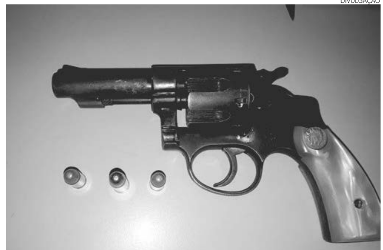
O revólver calibre 32 que foi utilizado no assalto

Durante as buscas, a equipe policial localizou o acusado, que