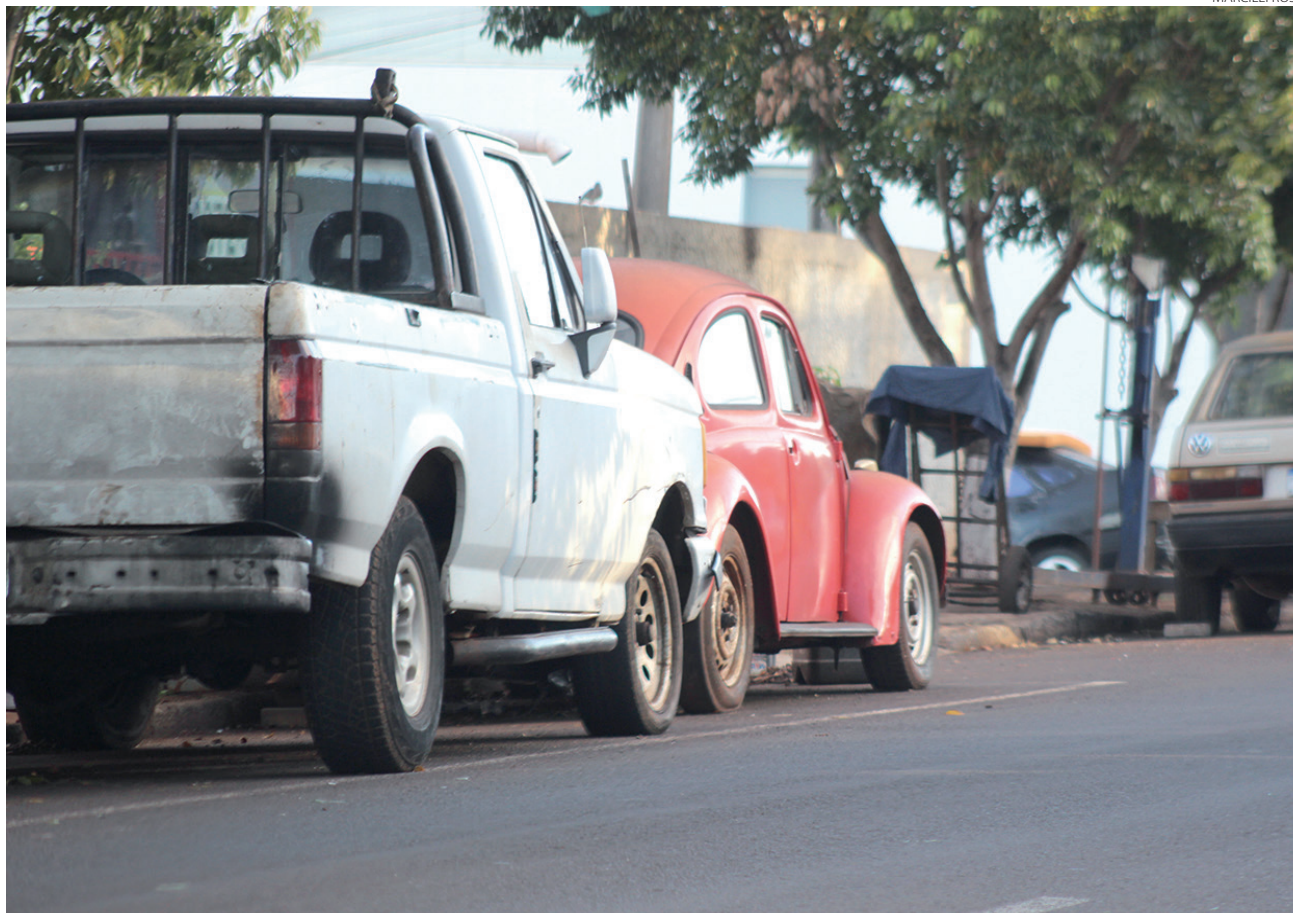
Os veículos sucateados estão ocupando várias vagas de estacionamento nas ruas de Pato Branco

A lei estabelece que a responsabilidade pela guarda, remoção depósito e informações para leilão dos