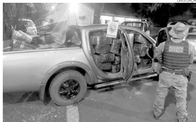
A droga era transportada em uma camionete com registro de furto em São Paulo

Durante patrulhamento, em Santa Helena, os policiais desconfiaram do condutor da camionete e tentaram fazer a abordagem. O motorista não obedeceu à ordem de parada e houve acompanhamento tático, quando ele abandonou o veículo e fugiu a pé em meio