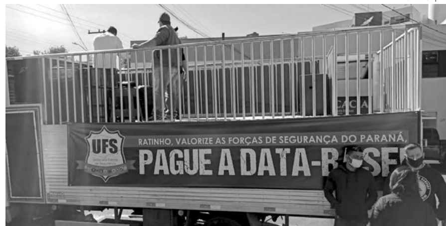
Em Pato Branco, a carreta reuniu mais de cem veículos

Em Pato Branco, além de policiais civis e militares da ativa e da reserva, policiais científicos e penais da cidade e região, participaram da carreta seus familiares, amigos e apoiadores, em percurso que saiu da 5ª Subdivisão Policial (5ª SDP) da avenida Brasil, passando pela rua Itabira, avenida Tupi, Praça Presidente Vargas e retornaram à Delegacia da Polícia Civil. A carreta reuniu cerca de cem veículos e 30 motocicletas. A maior rei-