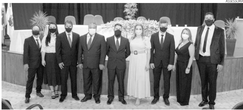
O Legislativo de Renascença não está em recesso parlamentar

Já as ações envolvidas no programa Comida Boa atuam em diferentes frentes: no combate à fome, ao desperdício de alimentos e no incentivo à produção de agricultores familiares paranaenses. Os investimentos do Governo do Estado viabilizam a compra de produtos da agricultura familiar, a distribuição de alimentos não comercializados nas Centrais de Abastecimento para famílias em situação de vulnerabilidade, amplia a oferta de refeições diárias para milhares de pessoas, além de promover a geração de renda e trabalho por meio de hortas comunitárias urbanas.