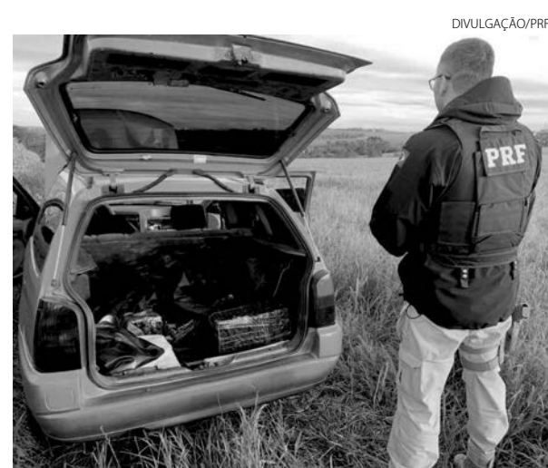
Droga estava em um carro. Motorista tentou fugir da polícia

Os policiais localizaram no porta malas do automóvel fardos com maconha prensada em tabletes. O veículo foi encaminhado junto com a droga para a Polícia Civil de Realeza, onde a droga foi pesada, totalizando 66 kg do entorpecente. O crime de tráfico de drogas tem pena prevista de 5 a 15 anos de reclusão.