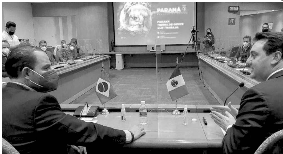
Foi a primeira agenda oficial do governador no país, onde ele está para uma missão internacional

Foram justamente esses temas abordados por Ratinho Junior na conversa com os prefeitos mexicanos. Um exemplo é o programa Paraná Energia Sustentável, lançado no início do mês para