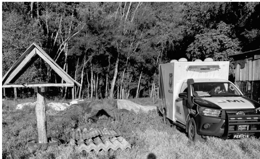
Corpo foi encontrado pela polícia na tarde desta quarta-feira (20)

Na última terça-feira (20) a Polícia Civil de