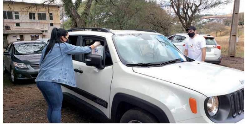
Recursos foram destinados para o enfrentamento da pandemia