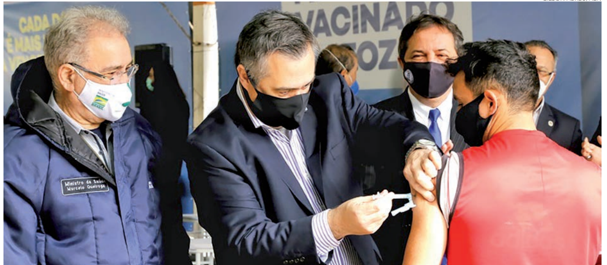
Uma articulação do Estado com a União permitiu o envio de um lote extra para quatro municípios paranaenses