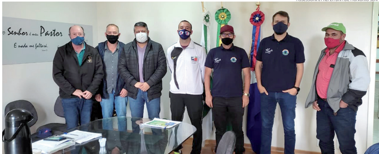
Prefeito e vice, juntamente com os responsáveis pelo projeto na região