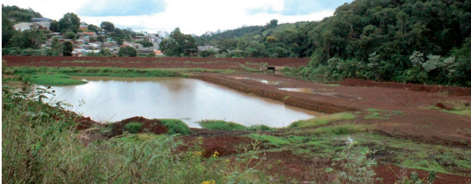
O novo prazo para conclusão da obra só será divulgado após a revisão do projeto

Na Câmara, naquela ocasião, o secretário havia afirmado que as obras seriam retomadas ainda em abril e que o atraso na execução da obra devia-se ao fato de que algumas pessoas que faziam parte do planejamento já não estavam mais na prefeitura. "Já recomparamos toda a equipe para dar continuidade a essa obra. Todo aquele material escuro que há na bacia precisa ser retirado. Precisamos colocar rachão de pedra na bar-