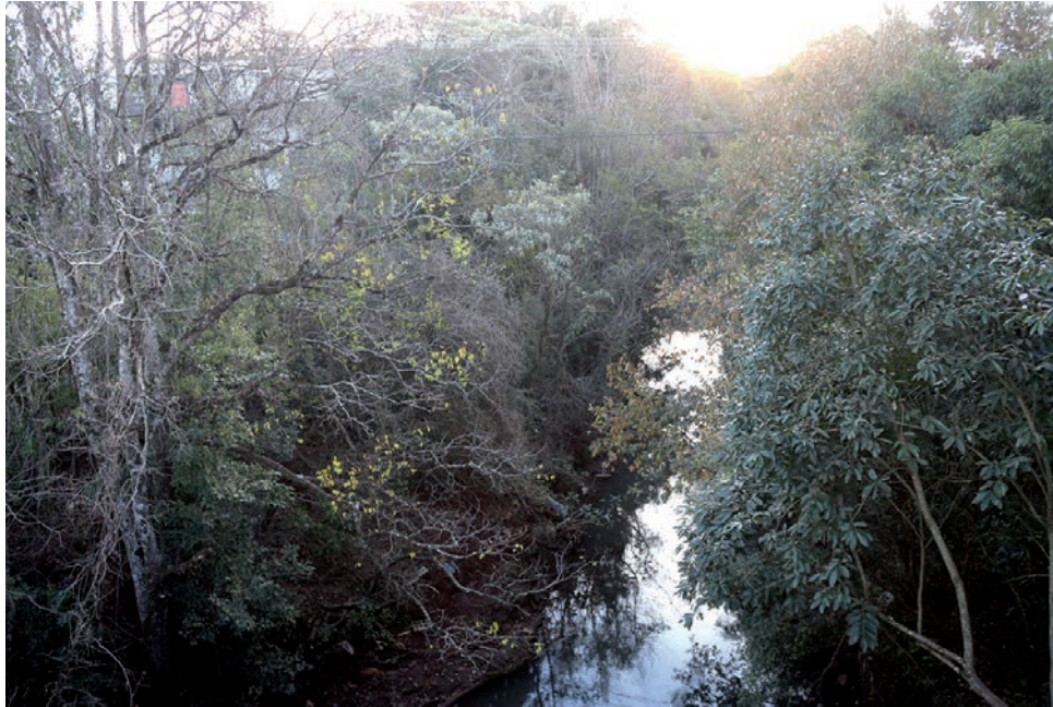
Intenção do MP é que não sejam mais expedidos alvarás autorizando construções nas áreas de APP

De acordo com a responsável pela Promotoria do Meio Ambiente da Comarca de Pato Branco, a in-