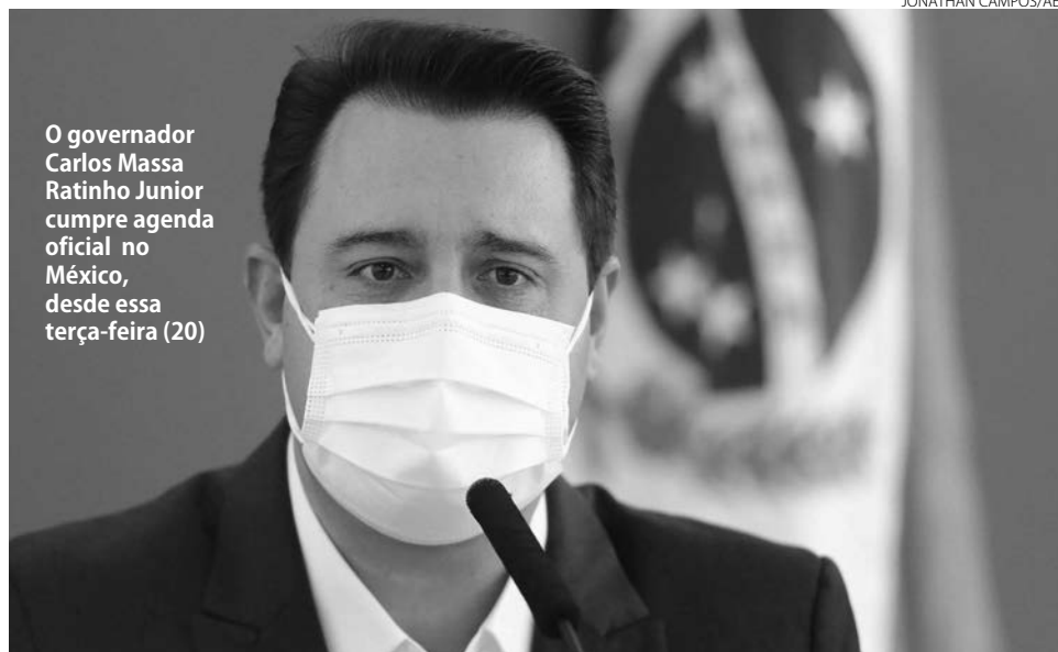
O governador Carlos Massa Ratinho Junior cumpre agenda oficial no México, desde essa terça-feira (20)

Na quarta-feira (21), Ratinho Junior visita as instalações do Cablebus, sistema de transporte por teleféricos da Cidade do México que tem quase 20 quilômetros, e o Instituto de Políticas de Transporte e Desenvolvimento, entidade sem fins lucrativos que promove o transporte sustentável e equitativo no mundo. Na