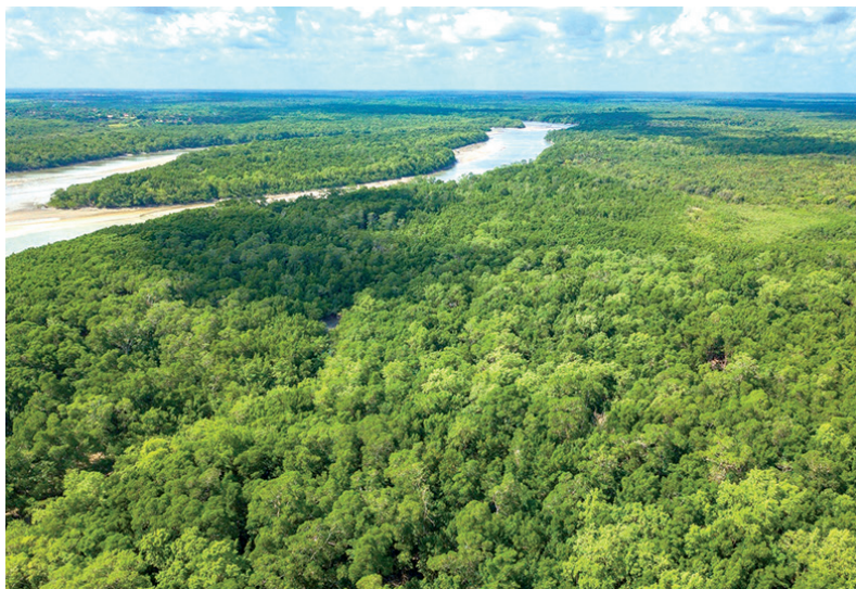
Operação Sesmarias, desvenda grilagem na Terra Indígena Ituna-Itatá