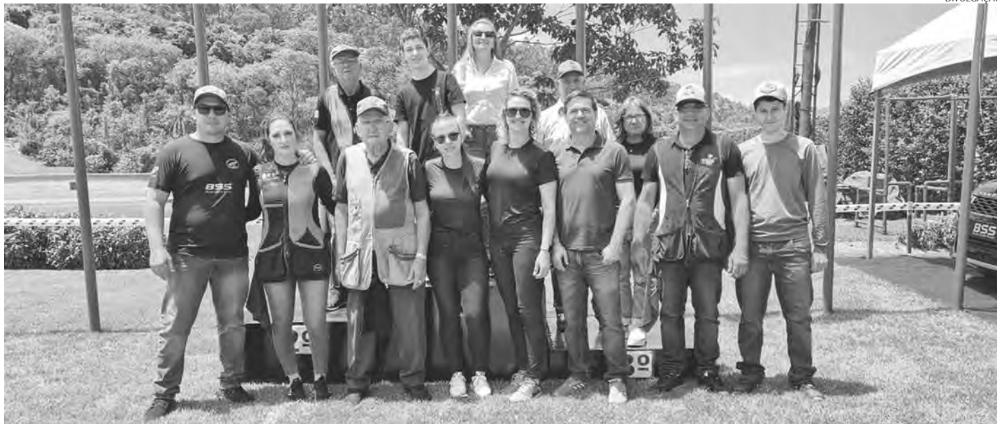
Os atiradores que representaram Pato Branco nas competições de tiro em São Paulo

O Clube Patobranquense de Caça e Tiro foi representado por 12 atiradores na final da V edição da Copa do Brasil Fan 32, em Santana de Parnaíba (SP). Além da Copa do Brasil, teve outras competições no Clube de Caça e Tiro de São Paulo, com destaque para alguns atiradores de Pato Branco, que conquistaram vários troféus.