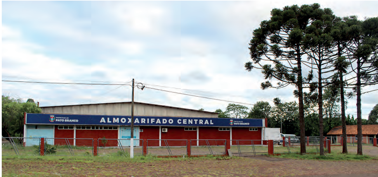
Com estudo, Município confirma área da antiga Contrasa como local para arena multiuso

Lavarda, que algumas modalidades a exemplo do basquete, não conseguem ser executadas, devido ao piso. E na arena, todas as modalidades, farão o planejamento, poderão utilizar", afirma o secretário falando ainda em espaço para novas disputas.