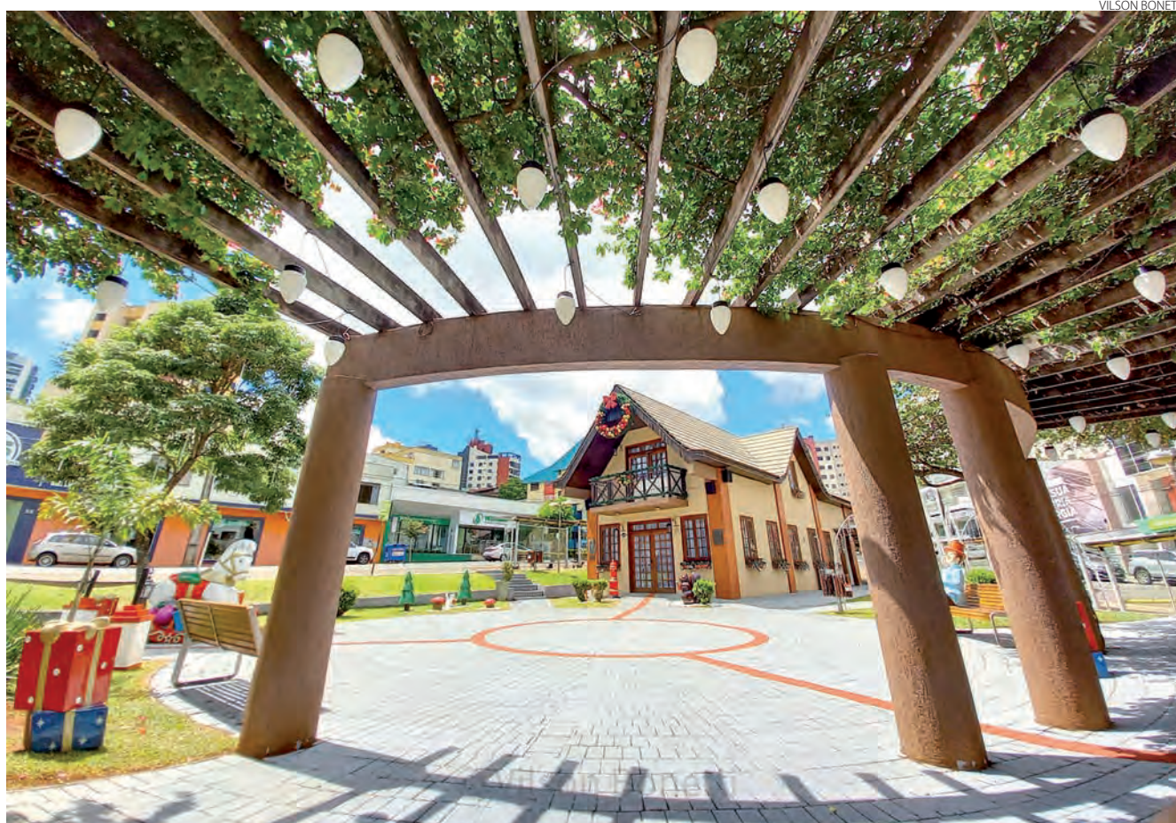
A praça Santos Dumont, em Pato Branco, e a Casa do Noel decoradas para o Natal