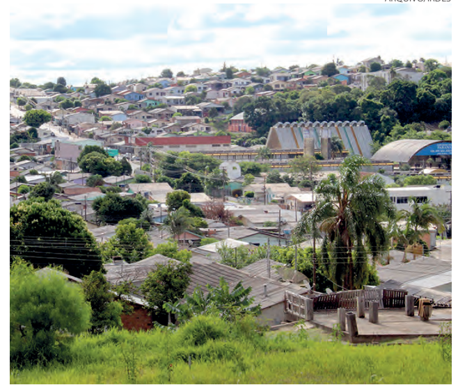
Projeto foi desenvolvido com a comunidade do Planalto

Obras também foram realizadas em espaços como o bosque e a pista de skate, através dos poderes públicos locais.