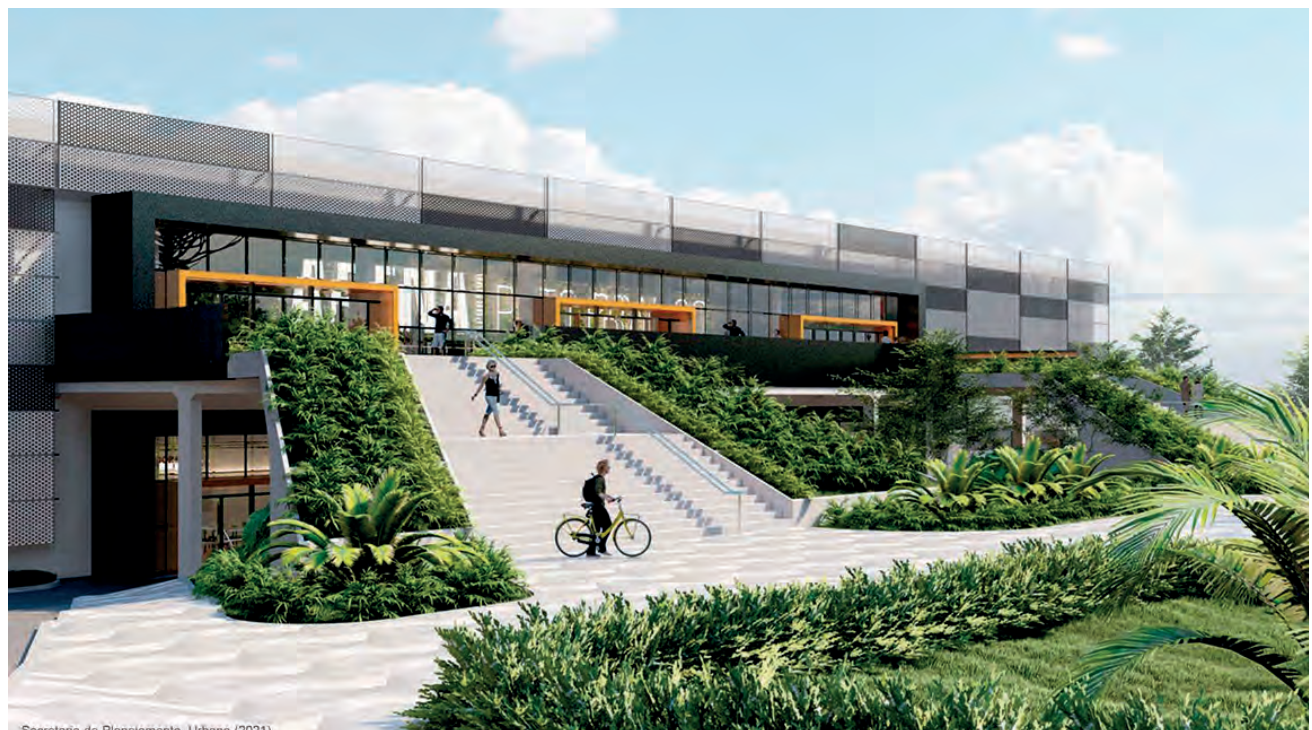
Secretaria de Planejamento Urbano (2021).

"Nenhum critério técnico foi deixado para traz. Observamos tudo no momento da solicitação das licenças, na solicitação ambiental e supressão florestal para poder fazer o corte das árvores que são de pequeno e médio porte", disse afirmando que todas as árvores que serão removidas, foram plantadas.