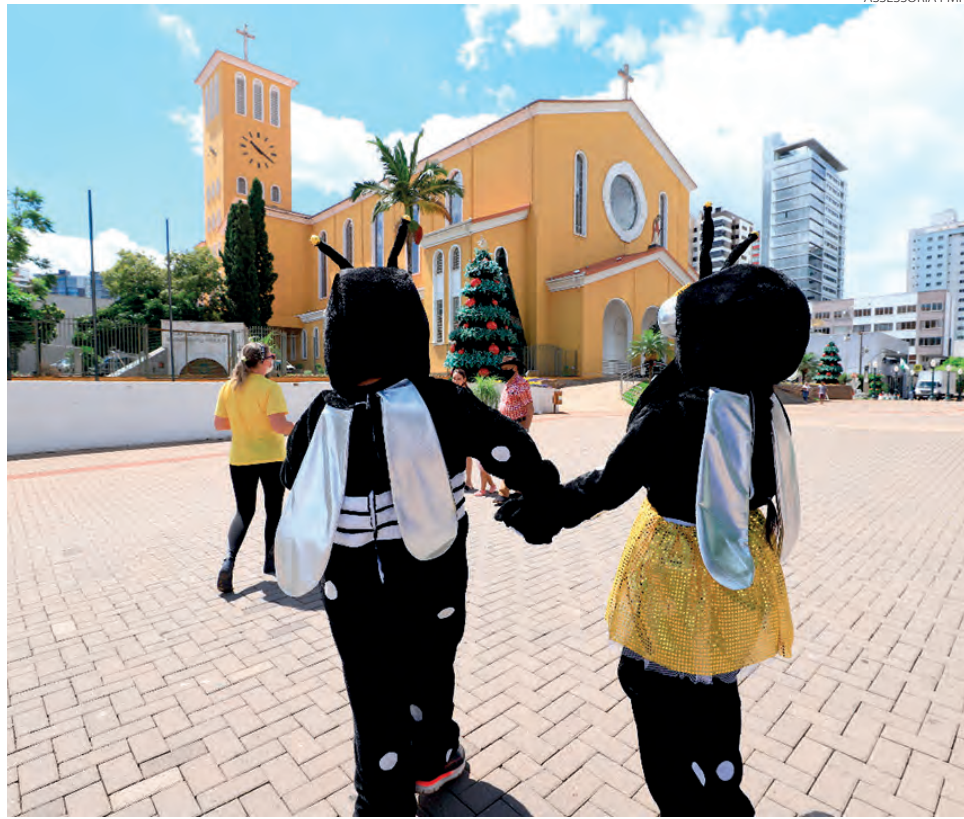
Ação de conscientização foi realizada na praça Presidente Vargas

“A denominação alerta serve para destacar que estamos tendo mosquito e larva no território do município. Não é um número significativo ainda para um risco, mas já