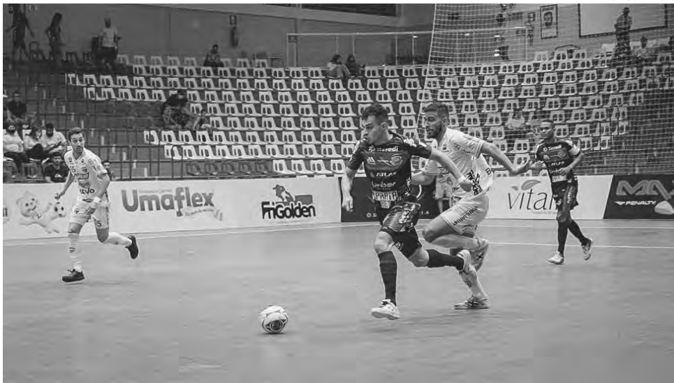
O Pato Futsal venceu no tempo normal, mas foi eliminado na prorrogação