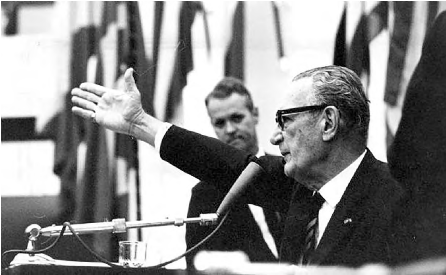
Filinto Muller foi chefe de polícia política do governo Getúlio Vargas

fizeram com que fosse deflagrado, meses depois da eleição, o Golpe Militar de 1930, que as pessoas insistem em chamar de Revolução de 1930.