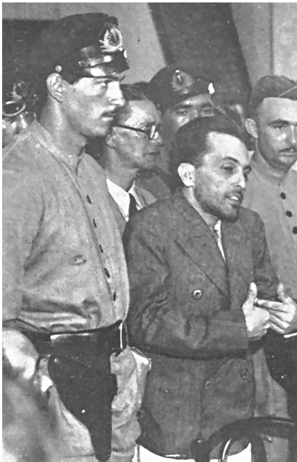
Luís Carlos Prestes no Tribunal de Segurança, em 1937