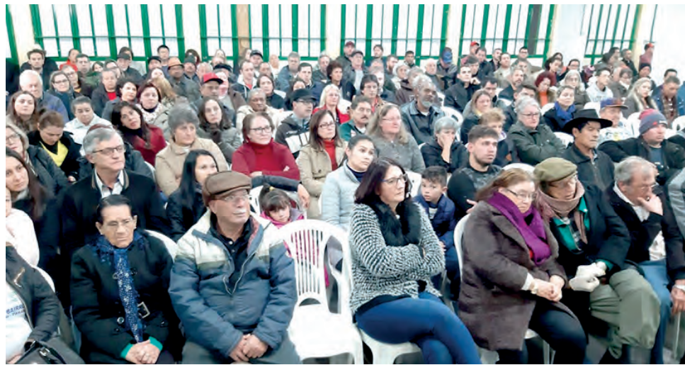
Reuniões com a comunidade apuraram demandas locais

De acordo com informações do Irdes, também foram feitas adequações de janelas no posto de saúde, a construção de uma quadra sintética para a prática de esportes; a pavimentação asfáltica de algumas ruas mais antigas do bairro, a instalação de pontos de ônibus; locação do clube de idosos, feira orgânica no centro comunitário e revitalização da entrada do bairro.