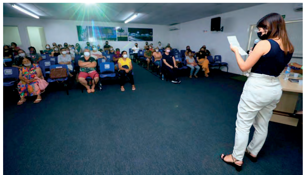
Simpósio serviu para levar as mulheres informações sobre a rede de enfrentamento da violência