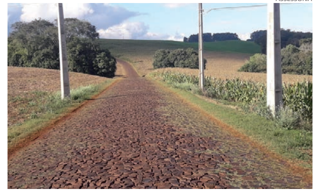
Vários trechos recebem pavimentação poliédrica

Além disso, há a obra de pavimentação asfáltica, que liga Bom Sucesso do Sul até Itapejara D'Oeste.