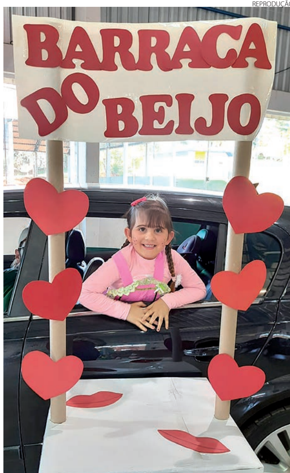
O Centro Municipal de Educação Infantil, Cantinho Feliz de Mariópolis realizou o drive-thru junino, no Parque de Exposições. A festa teve direito até a barraca do beijo