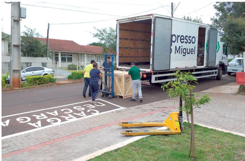
Equipamentos recebidos nos últimos dias

Ainda, por meio do instituto, são realizadas cirur-