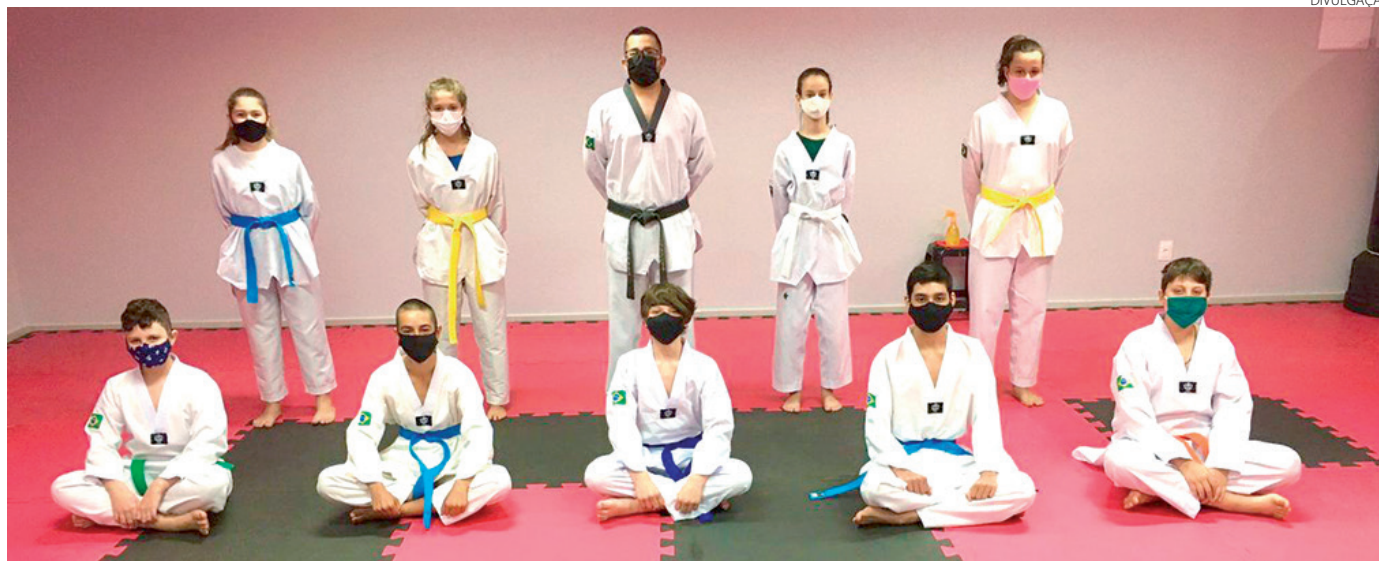
A equipe Sales Taekwondo Team de Vitorino foi representada por nove alunos

O Torneio Virtual Escolar 2021 Etapa Taekwondo (Poomsae) é uma competição desportiva organizada pela Federação do Desporto Escolar do Paraná (FDE-PR), através de recursos do PAF da Confederação Brasileira do Desporto Escolar e com o apoio do Governo do Estado, através da Paraná Esporte, que tem por objetivo minimizar os efeitos negativos da inatividade física de praticantes de taekwondo e a estimular a prática desportiva em um momento de isolamento social decorrente da pandemia.