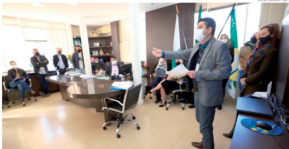
Plano possui um fundo garantidor de R$ 2,5 milhões

Estimativa é gerar R$ 25 milhões de créditos para Microempreendedores individuais e pequenos empresários