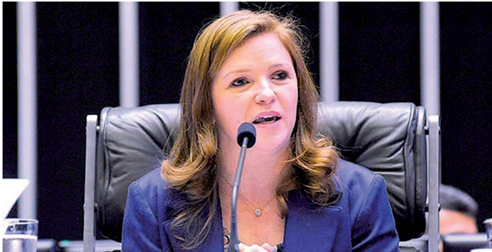
O mandato da deputada Leandre realizou um encontro virtual de contabilistas sobre o assunto

Ela lembra que, no ano passado, o descontingenciamento de parte dos valores disponíveis no Fundo Nacional do Idoso foi fundamental para o pagamento de um auxílio emergencial, no valor de R$ 160 milhões, para as instituições de longa permanência de idosos durante a pandemia. O auxílio é resul-