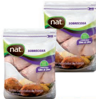
Sobrecoxa Frango Nat 1kg