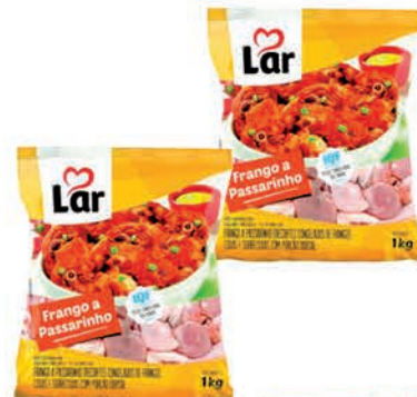
Frango a Passarinho Lar 1kg