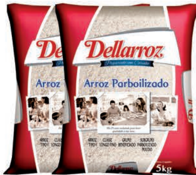
Arroz Parboilizado Dellarroz 5kg