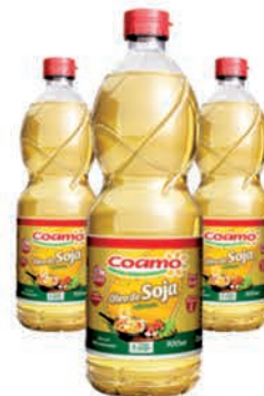
Óleo Soja Coamo 900ml