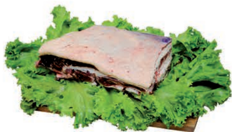
Costela Minga Bovina Kg