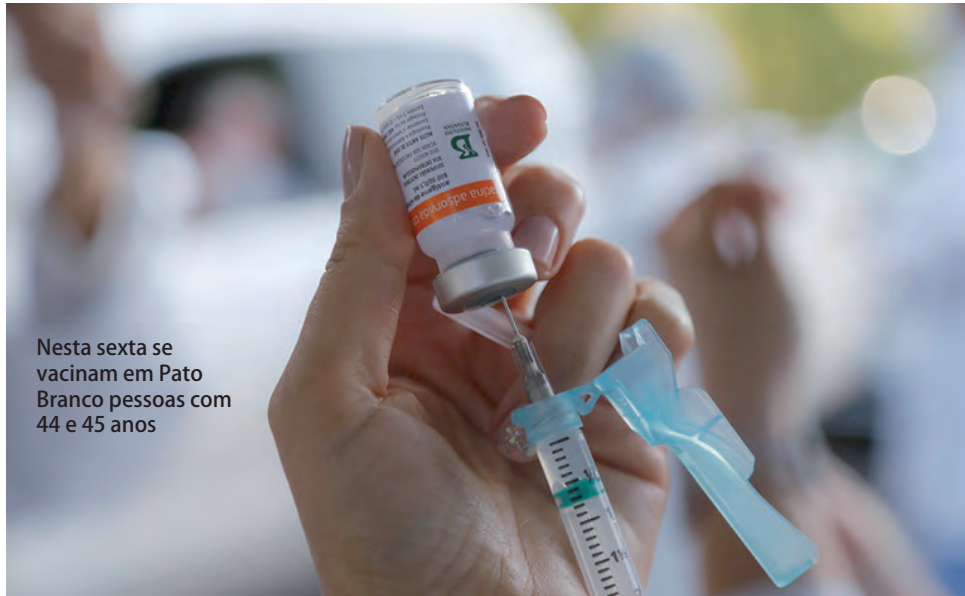
Nesta sexta se vacinam em Pato Branco pessoas com 44 e 45 anos

Por sua vez, a população com 44 anos será imunizada das 12 às 17h30.