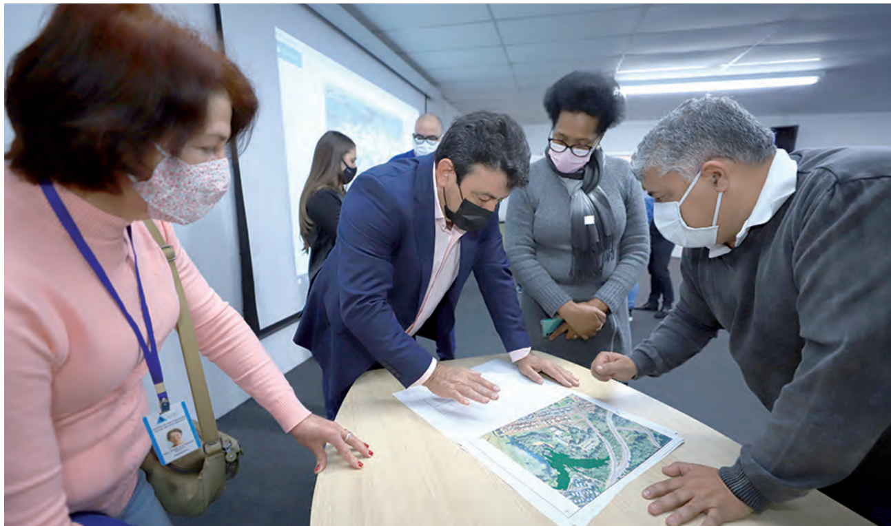
A reunião foi realizada na tarde da última terça-feira (6)

A Apac é uma organização da sociedade civil, sem fins lucrativos, com a finalidade de recuperar o preso, proteger a sociedade, socorrer as vítimas e promover a justiça restaurativa. Em Pato Branco a unidade atual, localizada no bairro Jardim Floresta, próximo ao Horto, foi construída com a ajuda da comunidade, que se mobilizou para erguer toda a estrutura