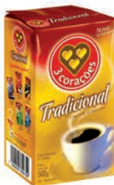
Café Pó 3 Corações Tradicional Vácuo 500g