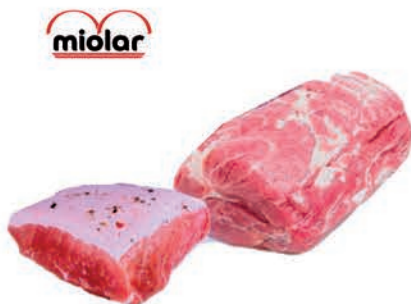
Picanha e Copa Suína Temperada Miolar Kg