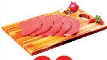
Carne Bovina Churrascão Americano c/osso Kg