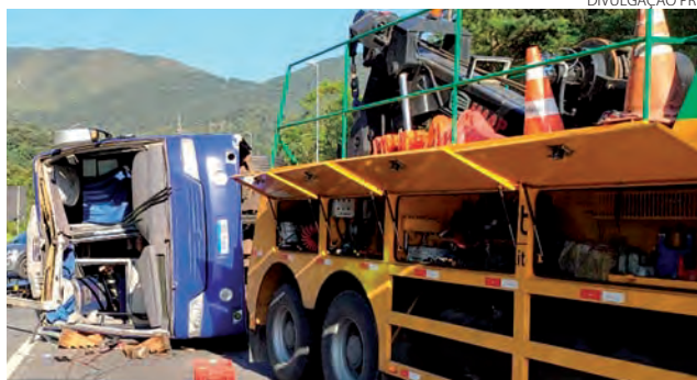
Ônibus levava a delegação para Jaraguá do Sul

pe que enfrentaria o Umuarama nesta sexta, pela Copa do Brasil publicou "o Jaraguá Fakini Futsal fica a inteira disposição e solidariedade a equipe do Umuarama e suas famílias."