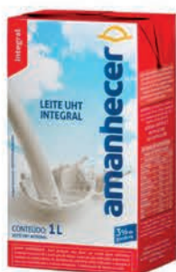
Leite Amanhecer Tradicional Integral 1l