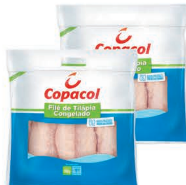
Filé Tilápia Copacol 800g