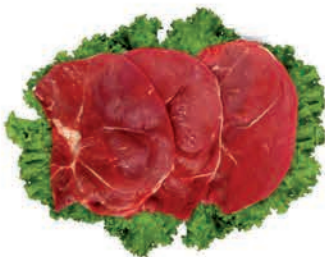
Bife Patinho Bovino Kg