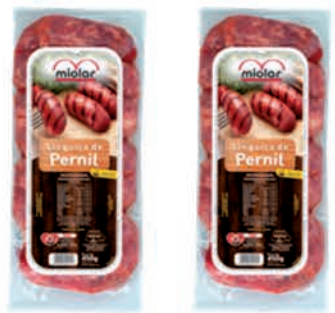
Linguíça Pernil Miolar 450g