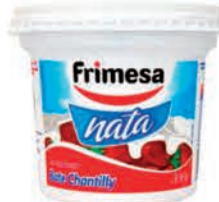
Nata Frimesa Tradicional 300g