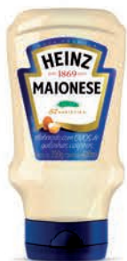
Maionese Heinz Flip Top 390g