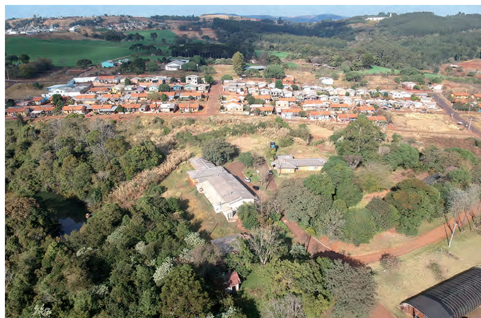
A Lei nº 5.434/2019 autoriza doação de parte do imóvel do Horto para a construção do Cense