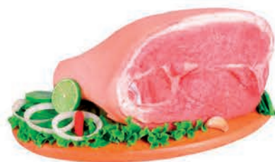
Pernil C/ Pele Suíno Kg