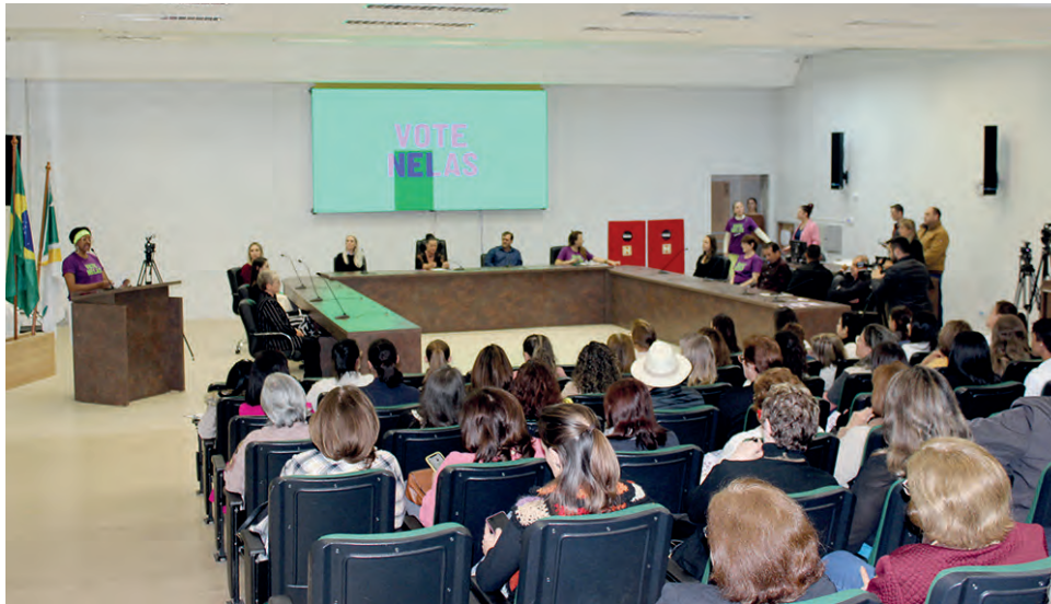
Encontro de Pato Branco foi realizado na Câmara de Vereadores

macro, médios e micros pontuais frente os relatos de dificuldades enfrentados, para estabelecer os planos de ação e assim captar recursos para que mulheres se tornem candidatas.