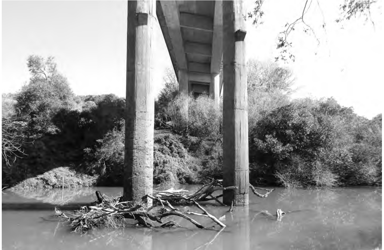
Ponte sobre o rio Capanema na PR-281

A Secretaria de Infraestrutura e Logística (SEIL), por meio do Departamento de Estradas de Rodagem do Paraná (DER/PR), assinou contrato para a reforma de quatro pontes em rodovias estaduais na região Sudoeste, nos municípios de Planalto, Realeza, Salto do Lontra, Nova Esperança do Sudoeste e Marmeleiro. O investimento nas obras será de R$ 2,58 milhões.