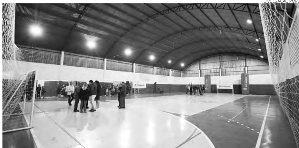
Reinauguração ocorreu na segunda-feira

Rítmica passou a ser disponibilizado no espaço às segundas e quartas-feiras e na próxima quinta-feira (18) inicia-se a escolinha de futsal oferecida em parceria com o Pato Futsal. Ainda, as aulas de tênis de mesa iniciam no sábado (20) pela manhã.