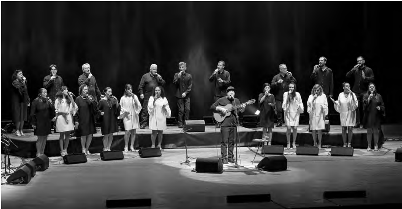
Pato Branco será o único município do Sudoeste a receber o cantor e compositor

Redação com assessoria redacao@diariodosudoeste.com.br