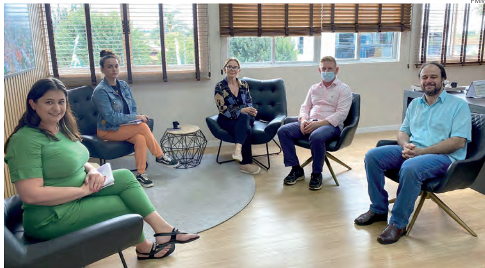
Emancipação político-administrativa de Mariópolis é celebrada em 25 de julho

"Estamos convidando pessoas que fizeram parte do evento ao longo dos anos, desde 1991, quando esses dois eventos passaram a marcar a tradição do município", conclui.