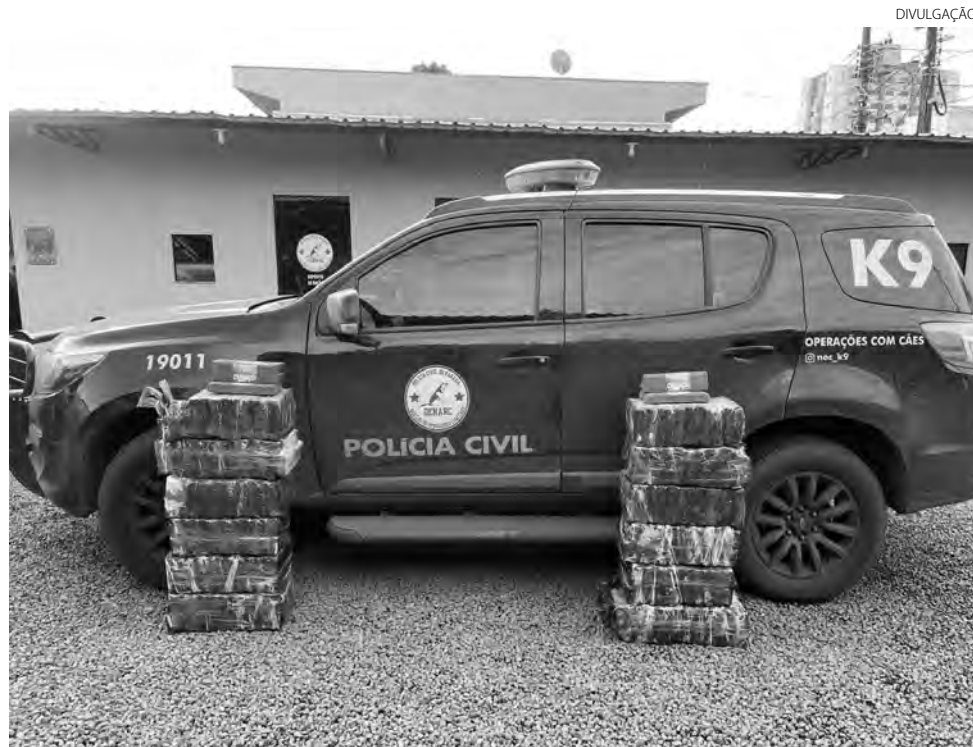
O rapaz disse que estava transportando a droga para Campo Largo