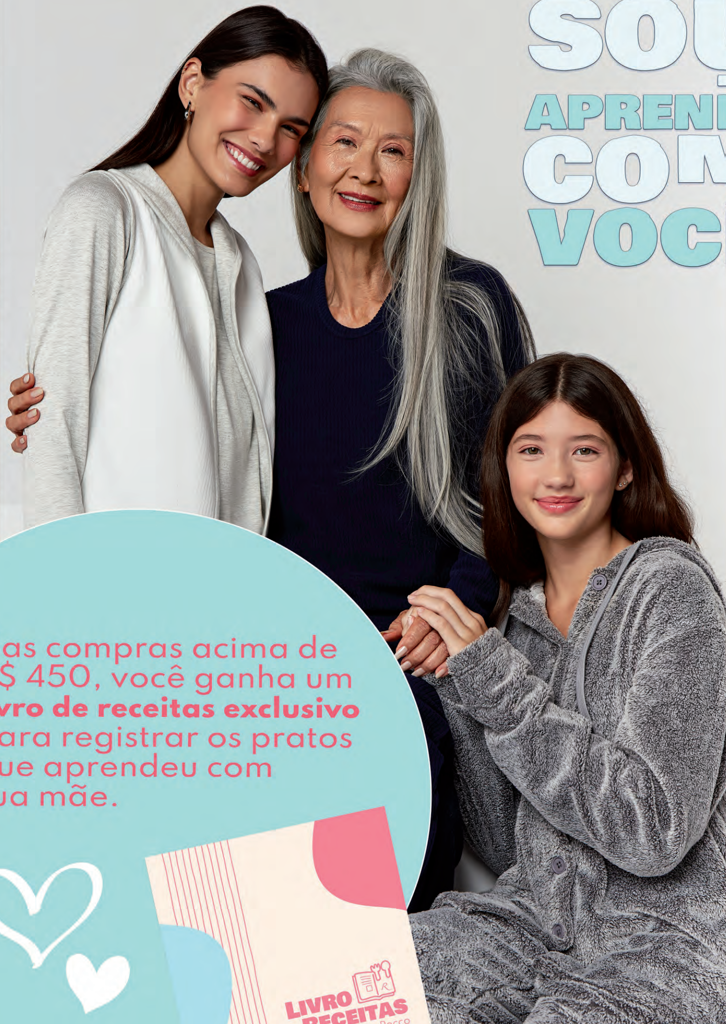
imagem meramente ilustrativa *Valido até 14 de maio

Nas compras acima de R$ 450, você ganha um livro de receitas exclusivo para registrar os pratos que aprendeu com sua mãe.