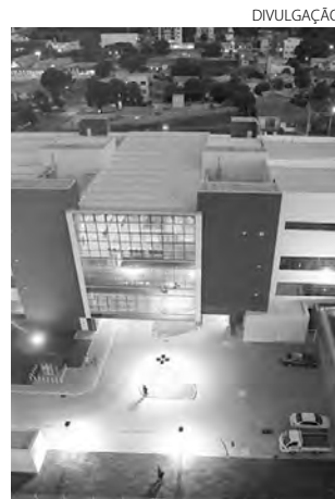
Júri que começou nas primeiras horas manhã da quinta, somente teve seu veredito no início da madrugada de sexta-feira