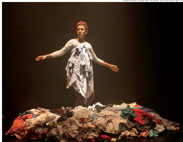
O drama dos refugiados de guerra ou de exílio são representados no espetáculo