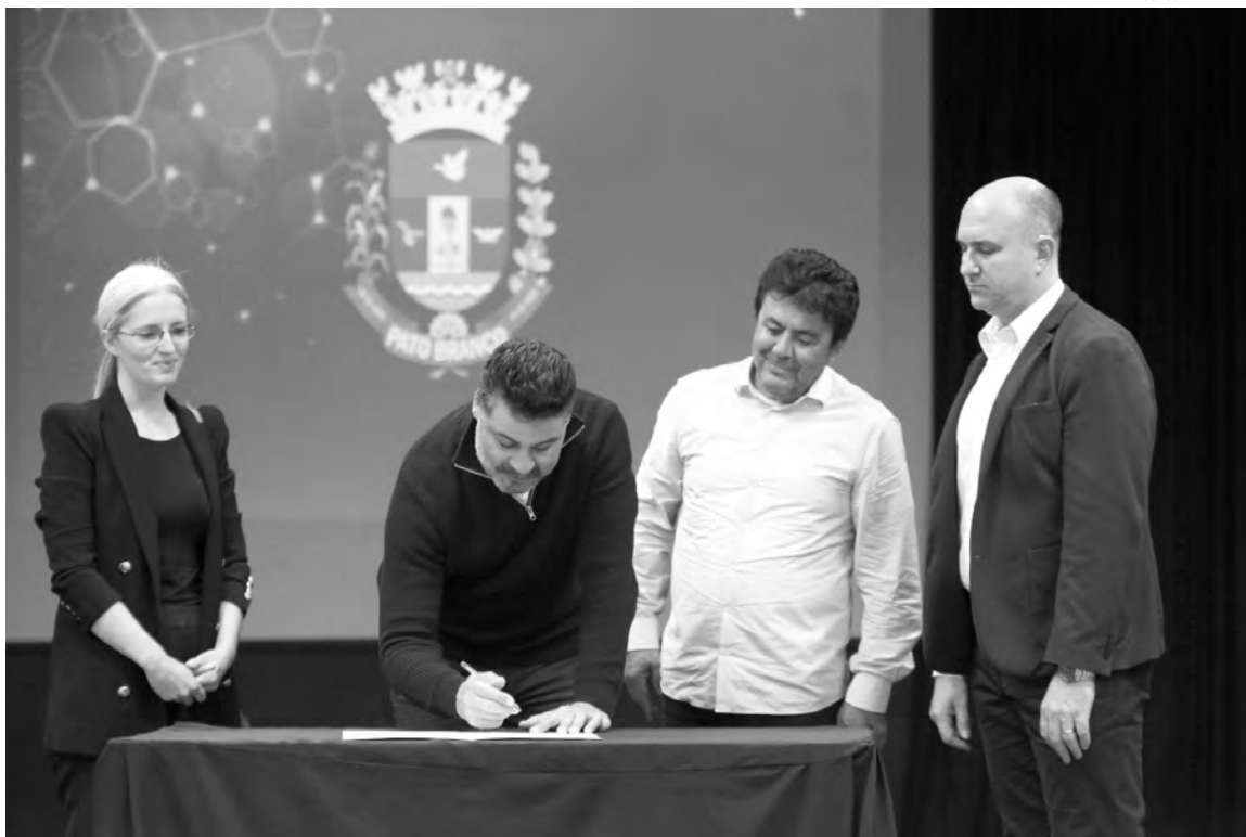
Município será responsável pela estrutura e Estado vai equipar o local

Redação com assessoria redacao@diariodosudoeste.com.br