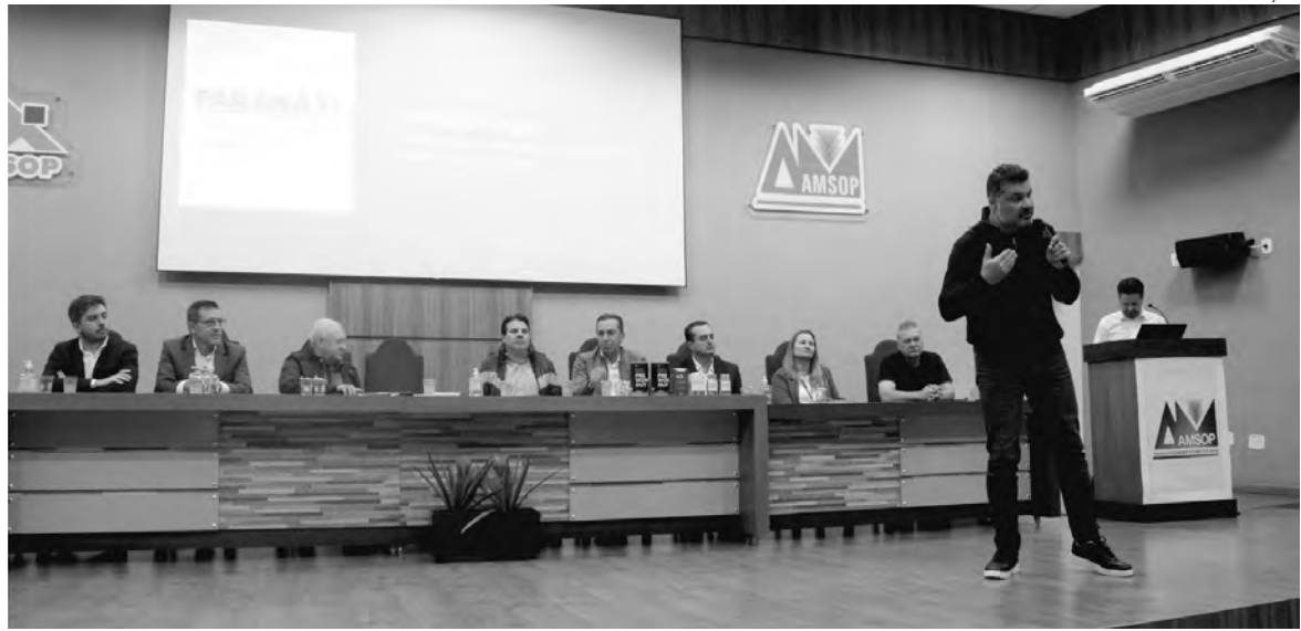
Passagem do secretário pelo Sudoeste teve como finalidade a integração entre o setor público e iniciativa privada

Aproveitando a estada do secretário no Sudoeste, o presidente da Agência de Desenvolvimento