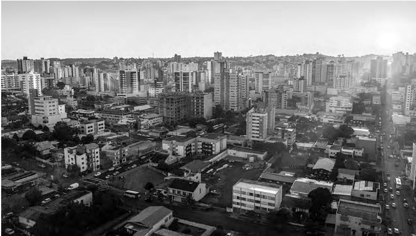
Os primeiros raios de sol no mês de junho em Pato Branco foram registrados por Rodinei Santos