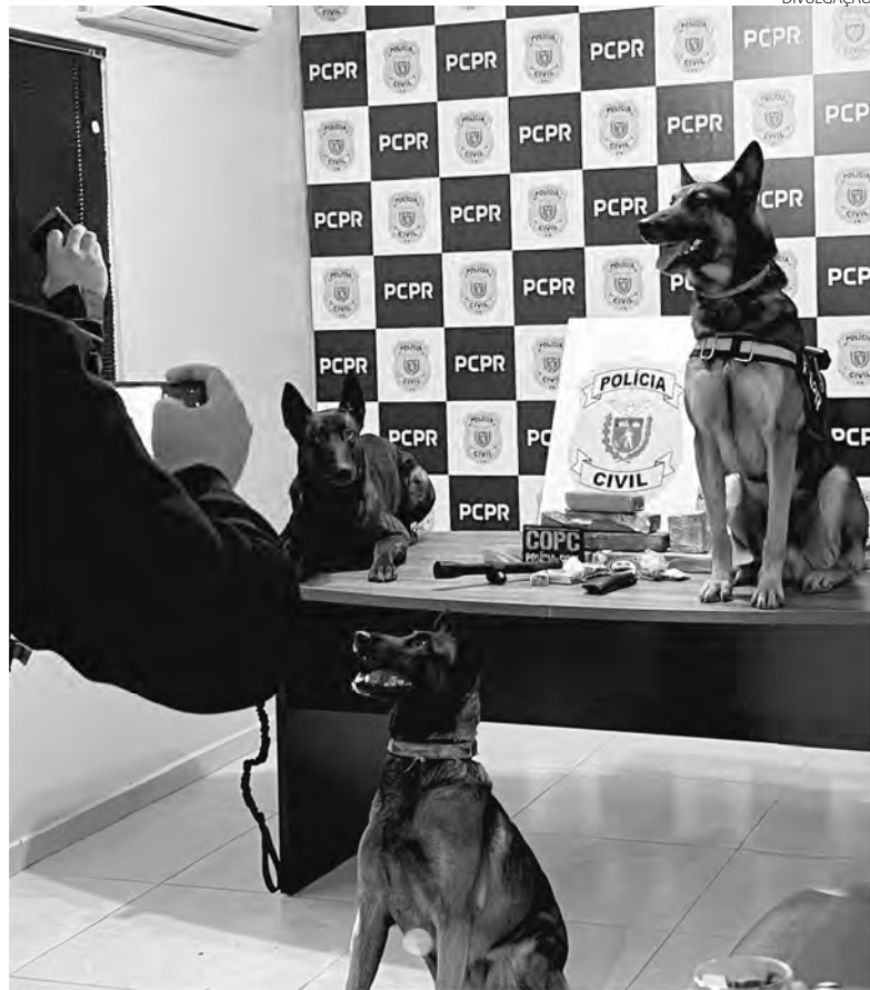
Os cães farejadores contribuíram para a localização das drogas

foi investigado pela Polícia Civil, em 2017. Naquela época, a condenada foi indiciada por explorar