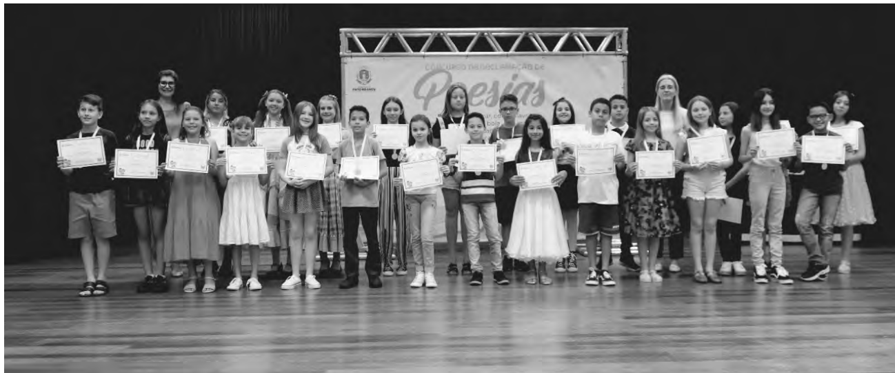
Final do 2º Concurso de Declamação de Poesias foi no sábado (19)