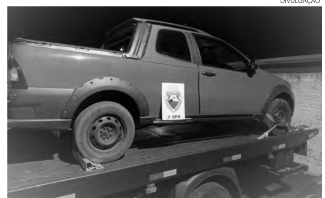
O Fiat/Strada foi guinchado até o pátio da 3ª Companhia da Polícia Militar

O Fiat/Strada foi guinchado até o pátio da 3ª Companhia da Polícia Militar. A Polícia Civil foi comunicada e deverá fazer uma perícia no veículo na tentativa de encontrar impressões digitais do assaltante. (AB)