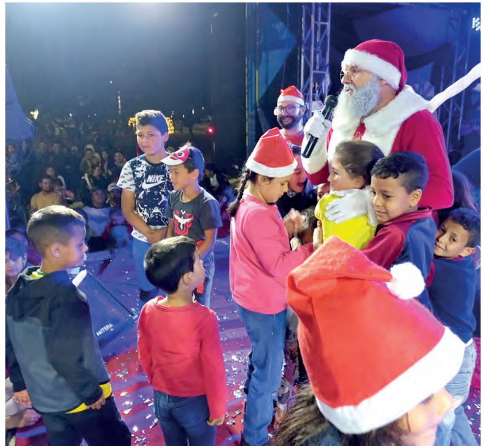
Crianças puderam ver o Papai Noel de perto durante o evento de Coronel Domingos Soares

A programação da noite de abertura do Natal também envolveu o lançamento do Concurso de Decoração Natalina comercial e residencial de Coronel Domingos Soares.