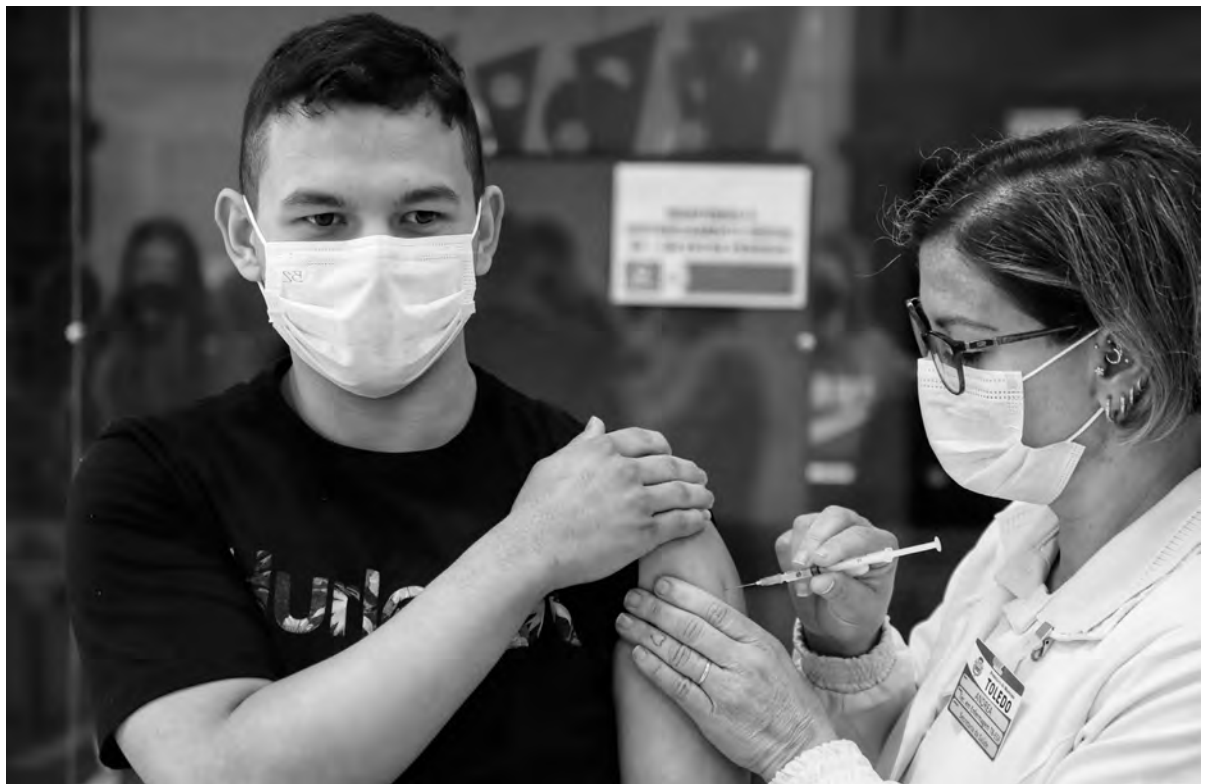
Aumentar a vacinação pode frear novo aumento de casos da covid-19

em adolescentes de 12 anos completos a 17 anos completos, população acima de 18 anos e gestantes e puérperas. Para receber a vacina, é necessário ter completado o esquema vacinal há 4 meses.