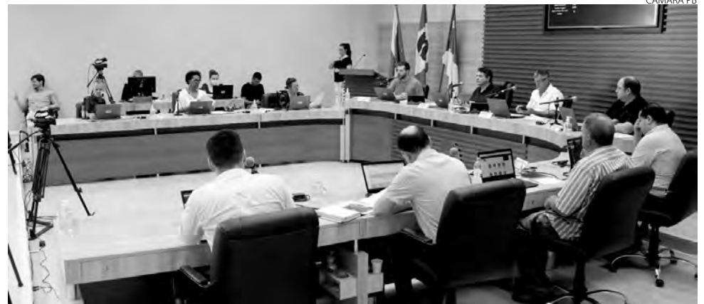
Os projetos devem voltar ao plenário ainda esta semana