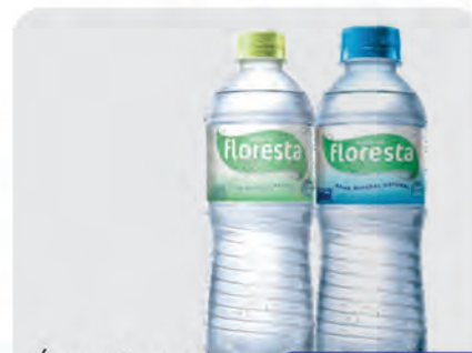
Água Mineral Floresta 500ml c/ e s/ Gás