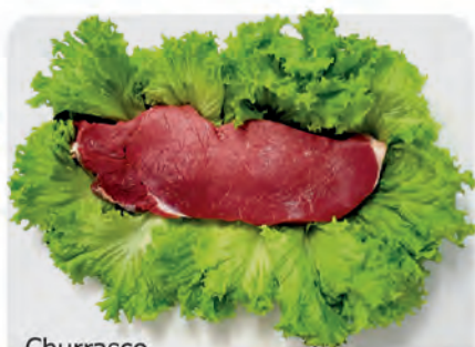
Churrasco Americano Bovino p/ Grelha Kg