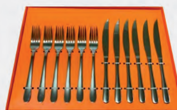
Faqueiro inox para churrasco 12 peças