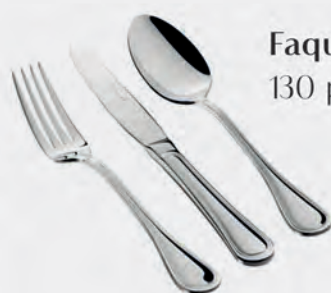
Faqueiro inox St James 130 peças