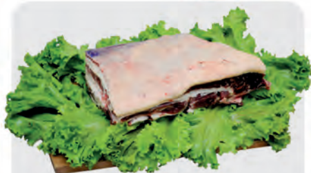
Costela Minga Bovina Kg