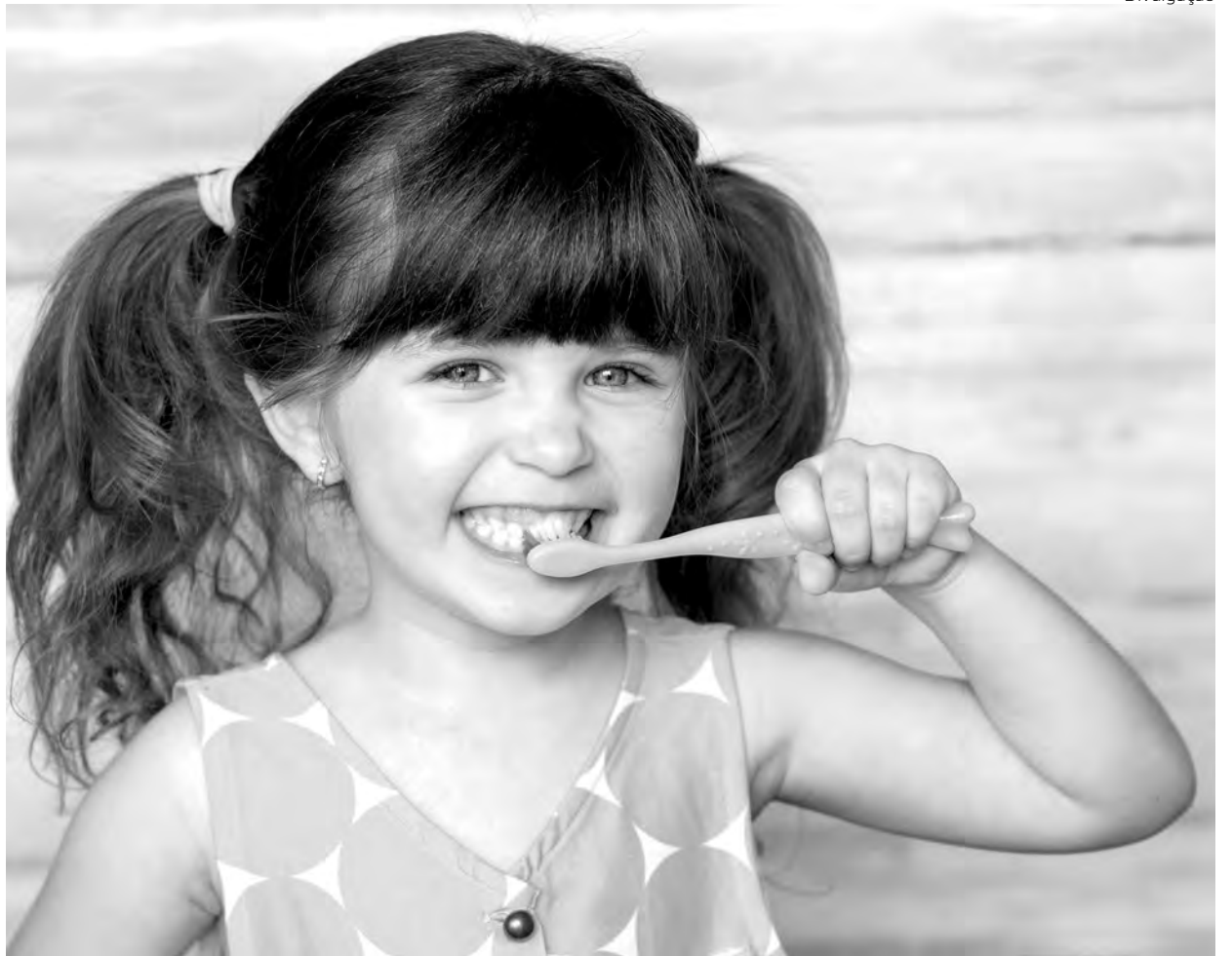
Má higiene bucal é uma das principais causas da proliferação de bactérias e do surgimento da cáries

Criar rotina lúdica de escovação dental, especialmente à noite, é fundamental para reduzir os 600 milhões de casos do problema