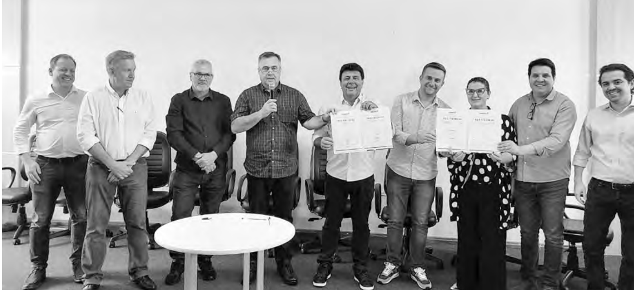
Nova estrutura PAM será construída no bairro Fraron

Nova estrutura de saúde será construída no bairro Fraron, ao lado das futuras instalações do Centro de Especialidades em Reabilitação