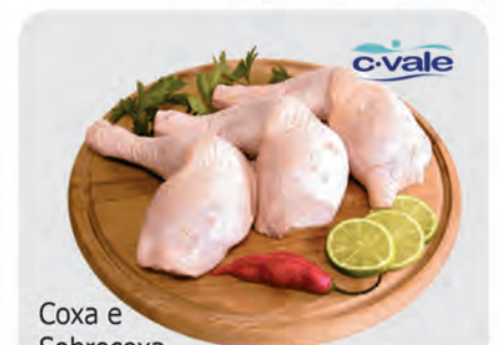
Coxa e Sobrecoxa Frango Trad. Congelada C-Vale Kg