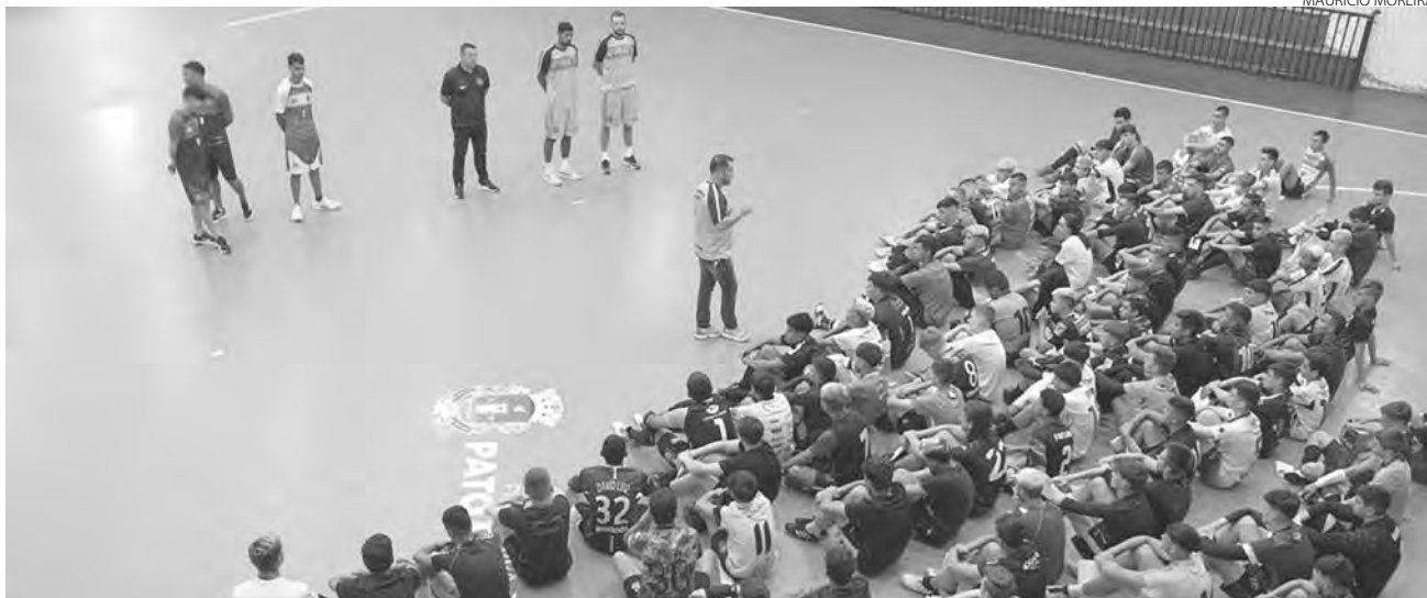
O Pato Futsal trabalha na formação e lapidação de jovens talentos

O Pato Futsal divulgou na quinta-feira (19) a lista oficial dos atletas que irão compor as categorias de base do elenco na temporada 2023. Os atletas das categorias sSub-15, Sub-17 e Sub-20 foram aprovados na seletiva realizada durante os dias 13, 14 e 15 de janeiro, no Ginásio Dolivar Lavarda. A equipe pato-branquense é referência na formação e lapidação de jovens talentos.