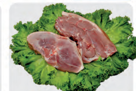
Paleta Suína c/ Pele Kg