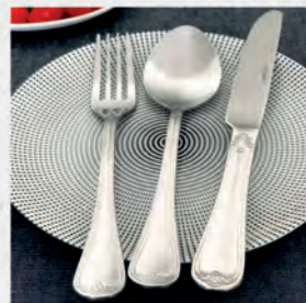
Faqueiro inox St James 48 peças