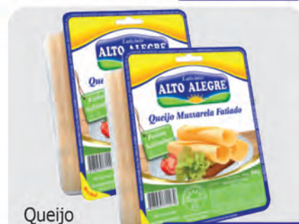
Queijo Mussarela Alto Alegre Fatiado 400g