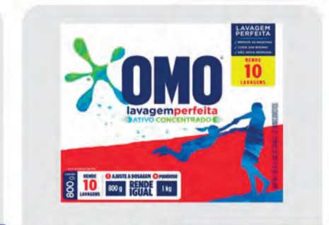
Sabão em pó Omo Lavagem Perfeita 800g