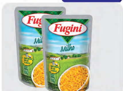
Milho Verde Fugini 170g