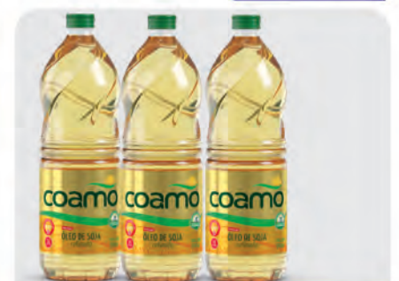
Óleo Soja Coamo 900ml