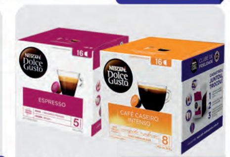
Café Dolce Gusto Nescafé c/ 16 Cápsulas