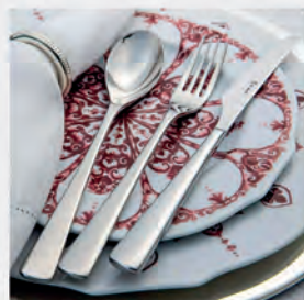
Faqueiro inox St James 77 peças