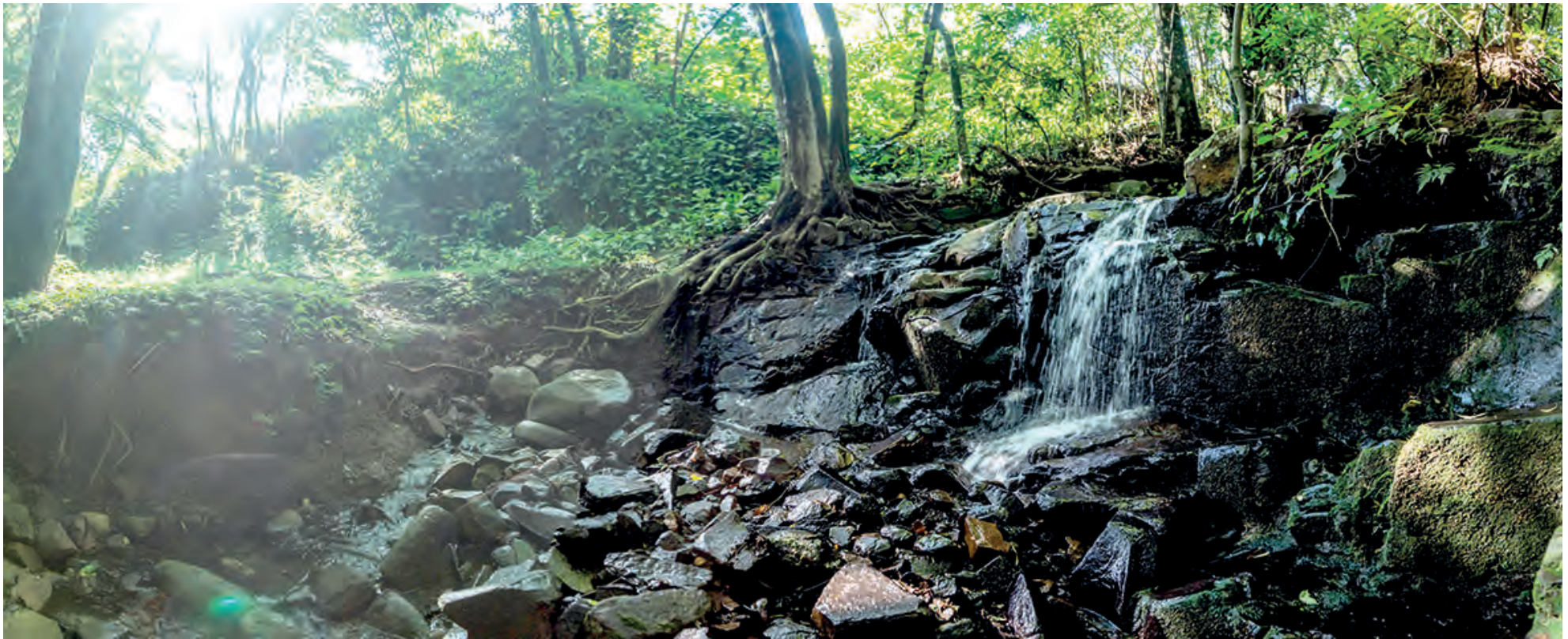
A pequena queda de água, do Parque Córrego das Pedras no bairro Jardim Primavera, em Pato Branco