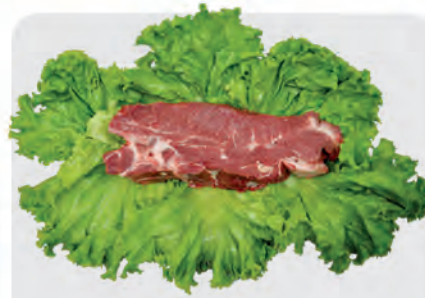
Filé Agulha Bovino Kg