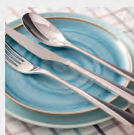
Faqueiro inox St James 101 peças