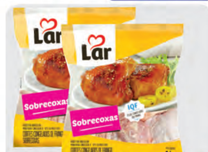
Sobrecoxa Frango Lar 1Kg