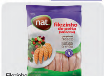
Filezinho Peito Frango Sassami Nat 1Kg