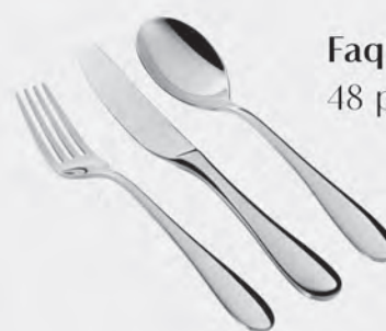
Faqueiro inox St James 48 peças