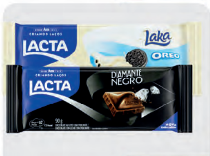
Chocolate Barra Lacta 90g