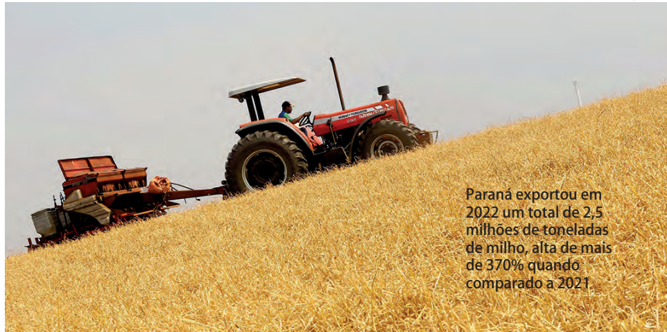
Paraná exportou em 2022 um total de 2,5 milhões de toneladas de milho, alta de mais de 370% quando comparado a 2021.

O boletim semanal também analisa a cultura do trigo. Apesar de ser um grande produtor, o Paraná importa uma quantidade significativa do grão. Em 2022 a importação do cereal totalizou 452 mil toneladas, sendo 250 mil toneladas vindas do Paraguai e o restante da Argentina (202 mil). O volume é 9% inferior ao importado em 2021, redução motivada pelos altos preços internacionais, especialmente após a eclosão da guerra na Ucrânia, e também pela safra re-