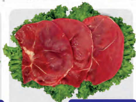
Bife Patinho Bovino Kg