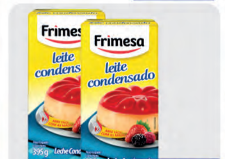
Leite Condensado Frimesa 395g