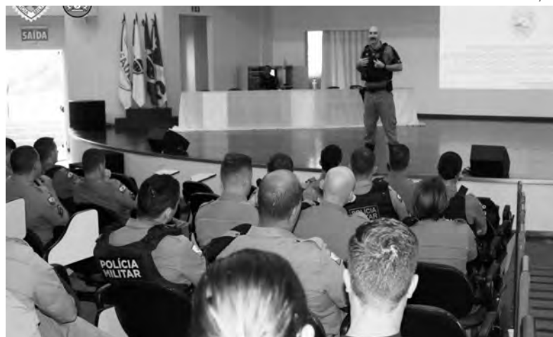
A instrução aos policiais foi realizada no Auditório da Unidep

De acordo com o 3º BPM, as instruções são realizadas periodicamente para atualizar o efetivo policial militar acerca das medidas a serem adotadas em situações de atendimento realizado na atividade policial, buscando continuamente a capacitação e qualificação profissional. (Assessoria)