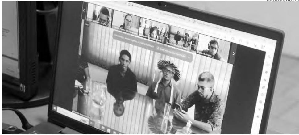
Reunião ocorreu de forma remota

Porém, para os indígenas, há necessidade ainda de uma reunião in loco, com os técnicos da Prefeitura. Sendo assim, o Município definiu que na quarta-feira (15), às 10h, técnicos da Prefeitura, na presença de representantes da Funai, vão avaliar o local que foi disponibilizado para os indígenas.