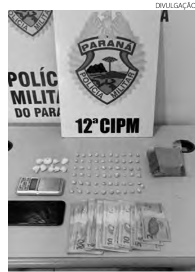
As drogas, dinheiro e demais objetos apreendidos em Mangueirinha

Essa foi a terceira apreensão de drogas realizadas nesta semana pela Polícia Militar, em Mangueirinha. Na terça-feira à noite, no bairro Vila Esperança, os policiais encontraram em uma residência 40 pedras de crack, 11 gramas de cocaína e uma bucha de maconha. Na tarde de quarta-feira, na rua Projetada, foram apreendidas 26 pedras de crack e 17 buchas de maconha prontas para serem comercializadas.