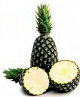
Abacaxi Pérola Unidade