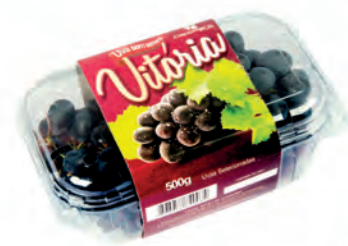
Uva Vitória Bandeja 500g