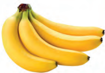
Banana Caturra Kg