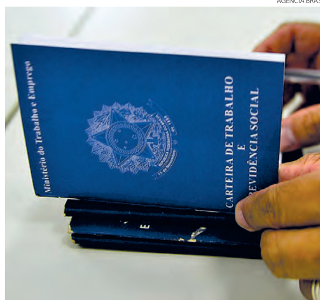
Foram reduzidos 297 postos de trabalhos no Sudoeste em novembro

Os dados divulgados ontem, foram os piores do ano, em se tratando de em-