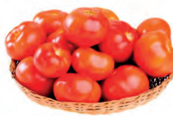
Tomate Longa Vida kg