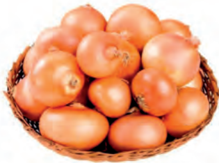
Cebola Nacional Kg