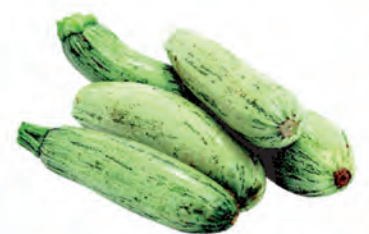
Abobrinha Verde Kg