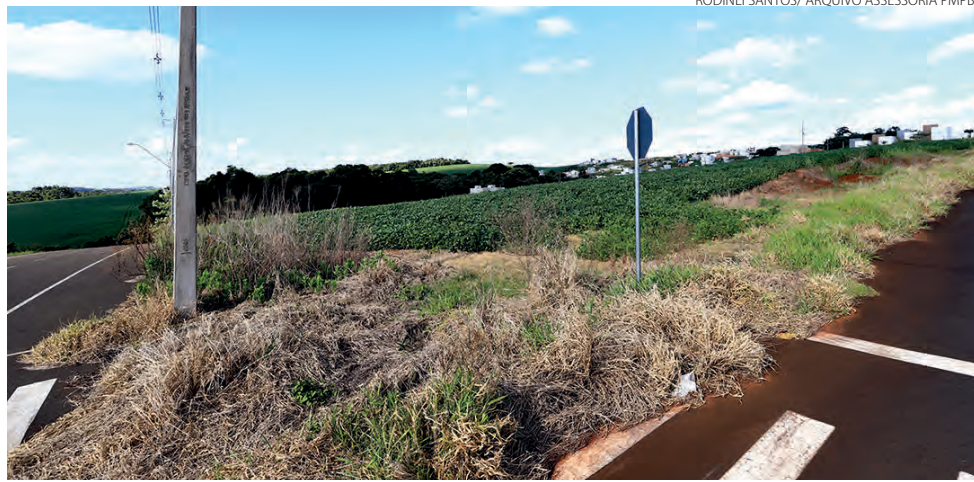
CER deve ser construído no bairro Fraron

Naquela mesma região, o Município vem pleiteando com o Governo do Estado recursos para a construção de um Pronto Atendimento para urgências e emergên-