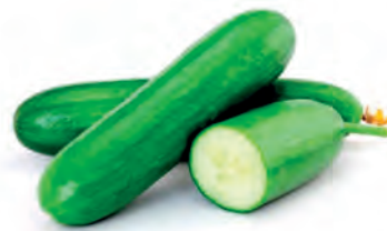
Pepino Salada Kg