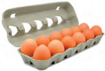
Ovos Vermelho Mantiqueira Dúzia