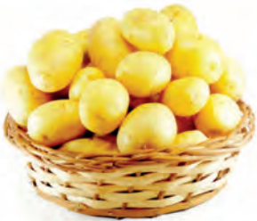
Batata Monalisa Kg