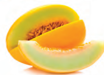
Melão Amarelo Tradicional kg