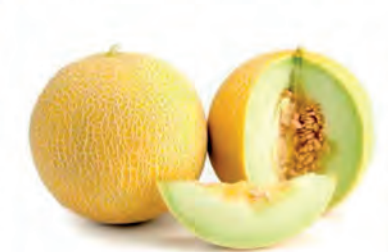
Melão Gália Rendado Kg