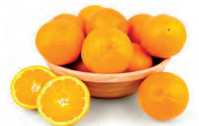
Laranja Bahia Importada Kg