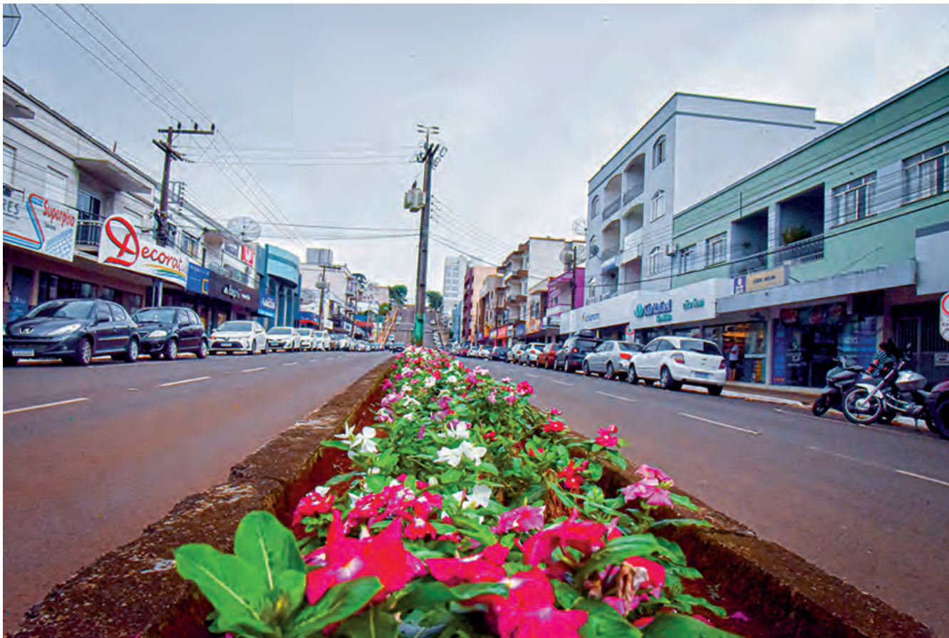
São Lourenço do Oeste em ritmo de fim de ano