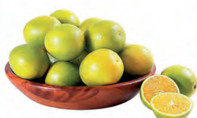
Laranja Pera Kg