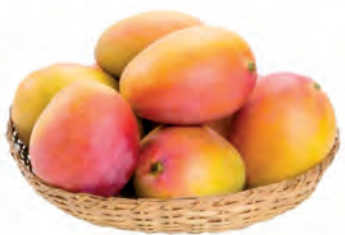
Manga Tommy Kg