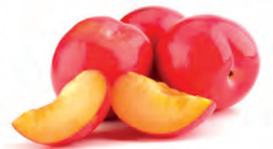
Ameixa Nacional Kg