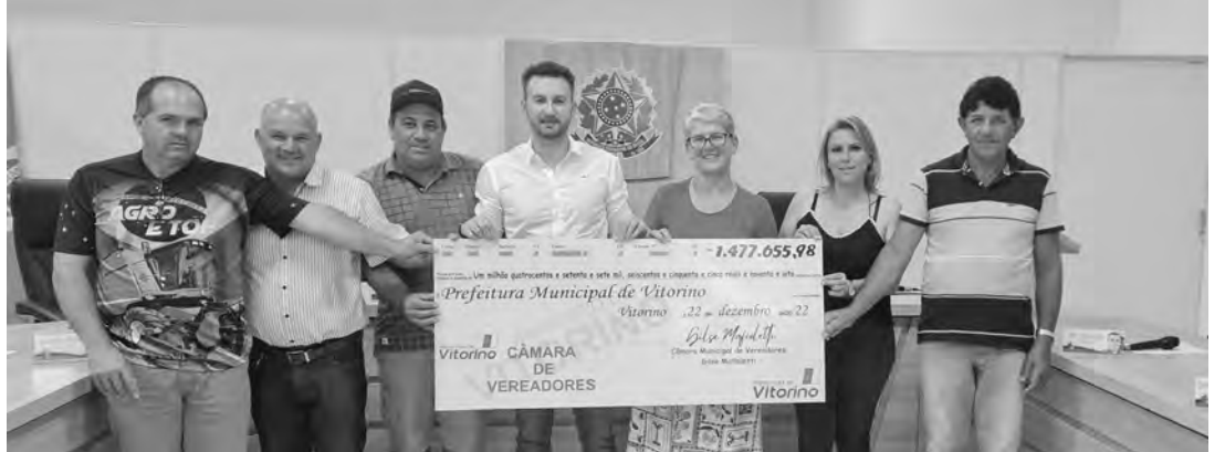
Embora seja um recurso livre, o Legislativo sugeriu o emprego de parte da sobra no projeto "Comida Boa Vitorino"