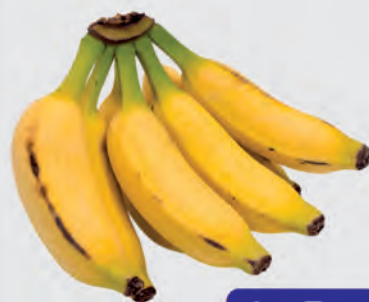
Banana Prata Kg