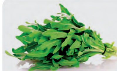
Rúcula Musseline Unid.