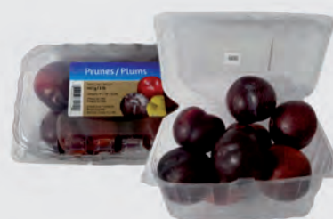
Ameixa Importada Bandeja 907g