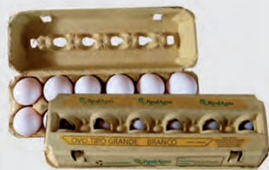
Ovos Brancos Real Agro Dúzia