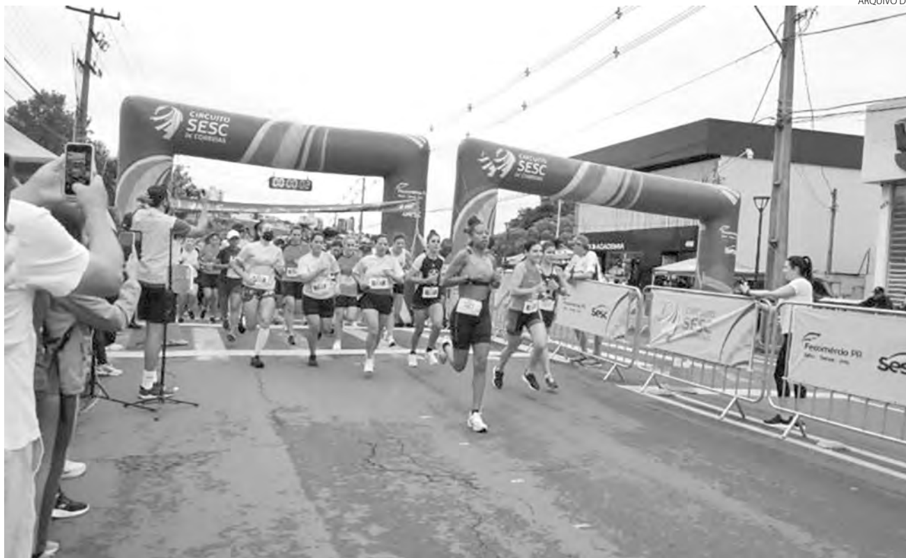
A largada da corrida será às 7h30 em frente ao Sesc