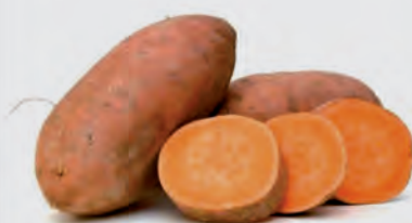
Batata Doce Amarela Kg