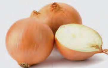
Cebola Nacional Kg