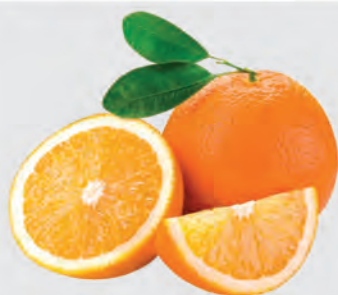
Laranja Bahia Importada Kg