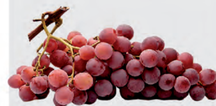
Uva Rosada Kg