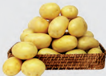
Batata Monalisa Kg