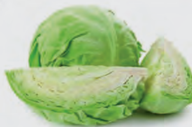
Repolho Verde Kg