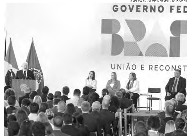
Programa foi relançado nessa quarta em cerimônia no Planalto

“O Pronasci constrói uma noção de que é fortalecendo os agentes e equipamentos de segurança, mas também garantindo que a população tenha acesso à educação e à cultura, que a gente vai garantir que os índices de violência e de criminalidade no país vão diminuir”, explicou a coor-