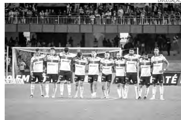
O Coritiba garantiu a classificação nos pênaltis