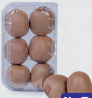
Kiwi Importado Bandeja 600g