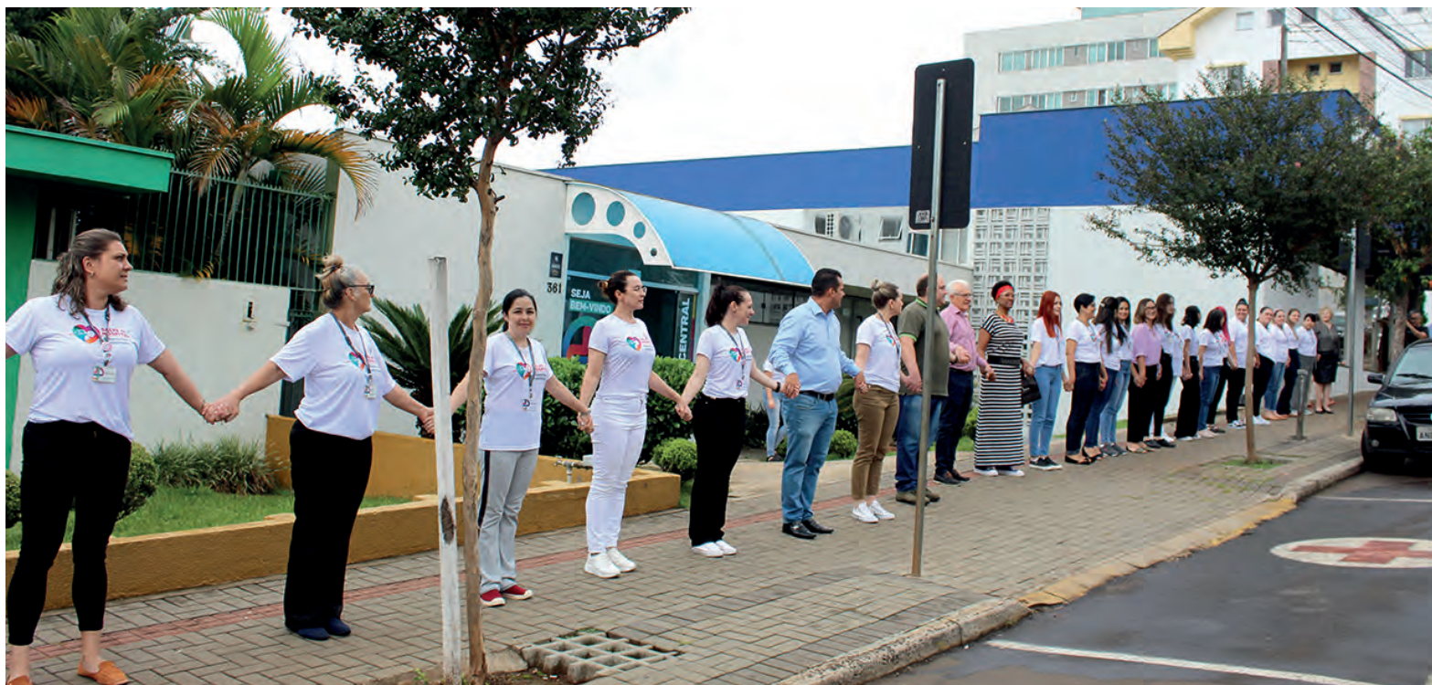
Em apoio, um abraço simbólico ao hospital, marcou o lançamento da campanha

Levantamento feito pelo setor de gestão do HFP, em 2022, a entidade registrou 11.711 internamentos, 8.255 cirurgias, 56.987 pessoas atendidas no Pronto Atendimento, 14.780 no Ambulatório Geral, 17.617 no Ambulatório On-