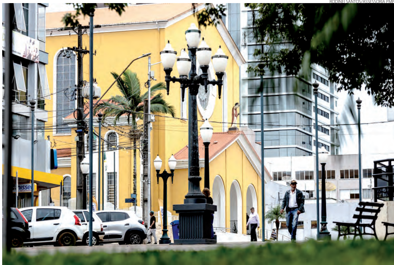
A terça-feira foi de variação climática em Pato Branco