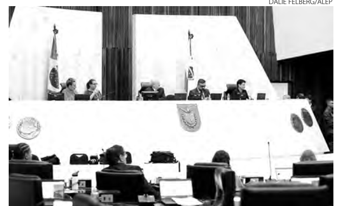
A preservação da vida é a prioridade na Campanha Visão Zero, apreciada em segunda votação