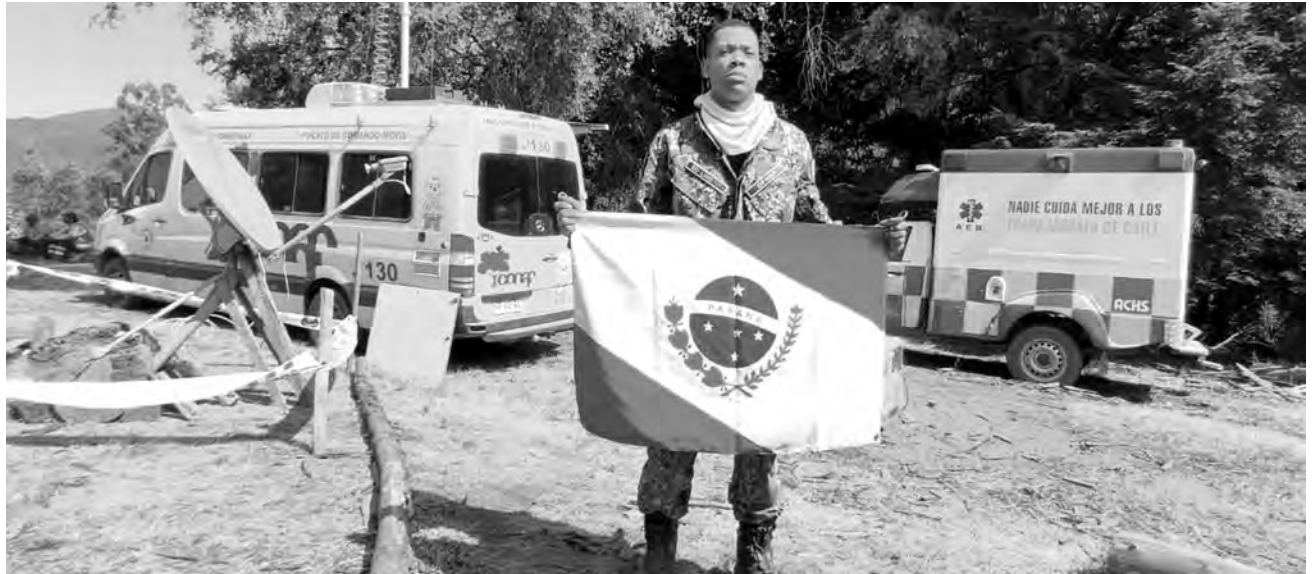
Equipe paranaense que integra a Força Nacional no combate aos incêndios no Chile