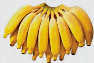
Banana Prata Kg