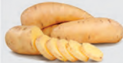
Batata Salsa Kg