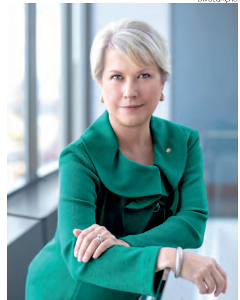
Jennifer Jones presidente o Rotary International

No sábado (4) estão programados encontros com autoridades, rotarianos e jovens, além de eventos gastronômicos e culturais e o atendimento à imprensa. Mais de mil pessoas, vindas de todo o Brasil, são esperadas para a programação que será realizada no Centro de Eventos Marabá.