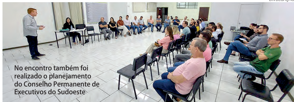
No encontro também foi realizado o planejamento do Conselho Permanente de Executivos do Sudoeste