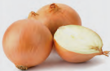
Cebola Nacional Kg