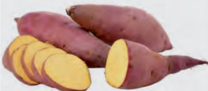
Batata Doce Roxa Kg