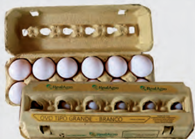
Ovos Brancos Real Agro Dúzia