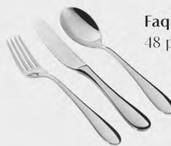
Faqueiro inox St James 48 peças