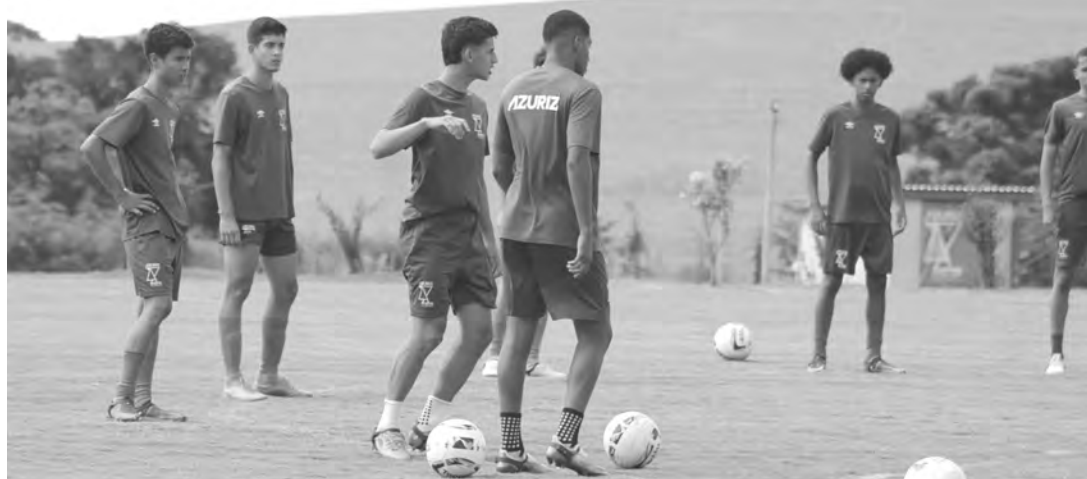
ASSESSORIA AZURIZ FC

As competições de base devem mesmo mobilizar o calendário 2023 do Azuriz. Este ano ainda o clube vai participar pela