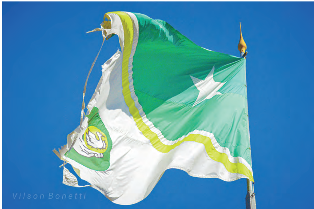
O fotógrafo Vilson Bonetti, registrou o estado de conservação da bandeira de Pato Branco