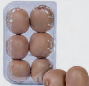
Kiwi Importado Bandeja Cantu 600g