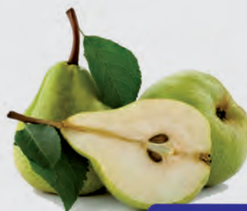
Pera Willians Importada Kg