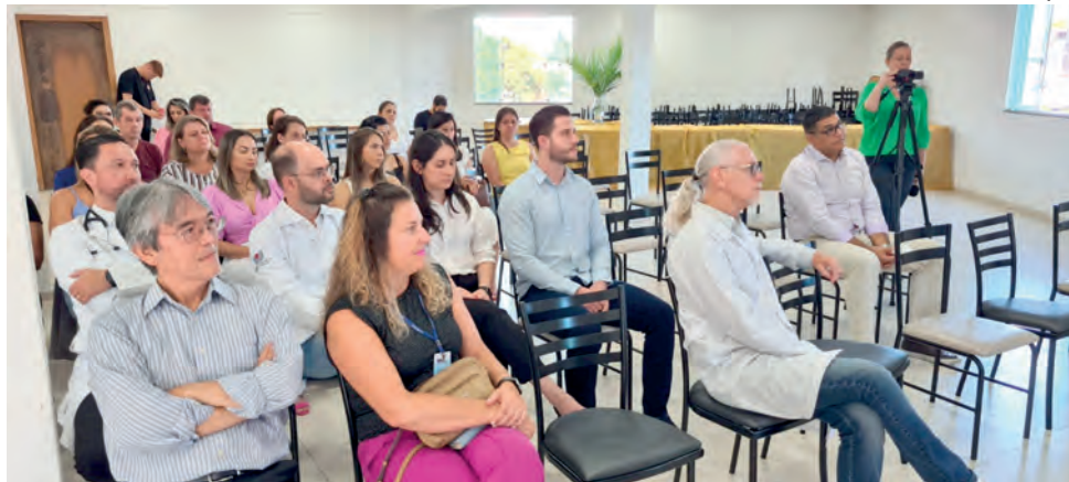
Este é o segundo programa de Residência Médica da Unioeste

Este é o segundo programa de Residência Médica da Unioeste. O primeiro foi lançado em 2019 em Cirurgia Geral e está na segunda turma. Para o diretor do campus da universidade, professor Adilson da Rocha, além de dar conti-