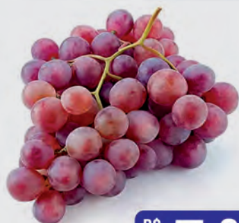
Uva Rosada Kg