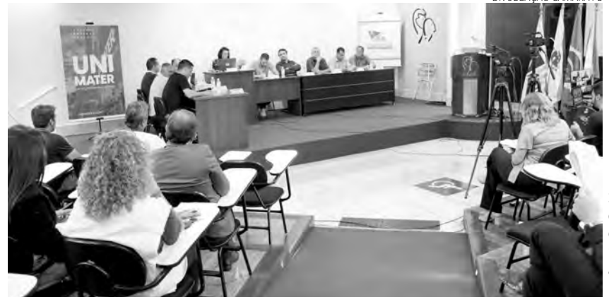
Sessão dessa quarta, foi realizada no auditório do Unimater

Na sessão também foram aprovados 11 projetos de lei, todos em segunda votação, entre eles, o Projeto de Lei nº 182, de 2022, de