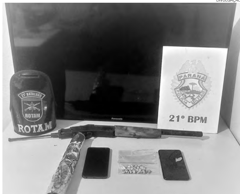
A droga e os demais objetos que foram apreendidos em Francisco Beltrão

Os dois homens foram presos por tráfico de drogas. Eles foram entregues, juntamente com as 30 pedras de crack e demais objetos apreendidos, na Delegacia da Polícia Civil para as providências cabíveis ao fato.