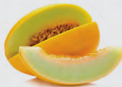
Melão Amarelo Tradicional Kg