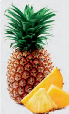
Abacaxi Hawaí Unidade