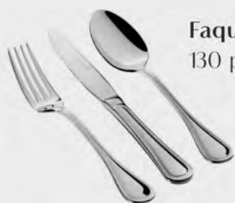
Faqueiro inox St James 130 peças