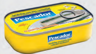
Sardinha Pescador Oleo e Tomate 125g