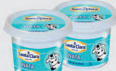
Nata Santa Clara 300g