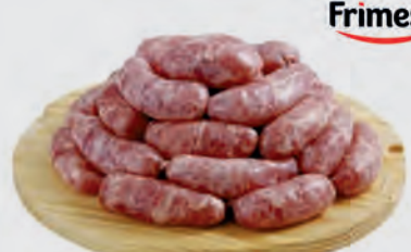
Linguica Toscana Frimesa Kg