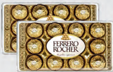
Bombom Ferrero Rocher tradicional T12Unid 150g