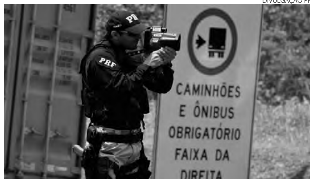
Os policiais vão combater principalmente o excesso de velocidade e as ultrapassagens indevidas

As BRs 376 e 277 - Sentido Litoral - contarão com proibição de veículos articulados durante a operação. Além do retorno da restrição de veículos superdimensionados, nos trechos de pista simples, em todo Estado. Restrições buscam melhorar a fluidez do trânsito nas rodovias que sofrem com interdições de faixas de rolamento. Nas duas rodovias, nos trechos afetados pelas obras de recuperação dos danos causados pelos deslizamentos, será proibido