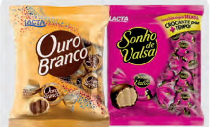
Bombom Ouro Branco e Sonho de Valsa 1Kg