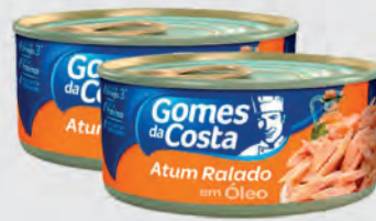
Atum Gomes Da Costa Ralado 170g