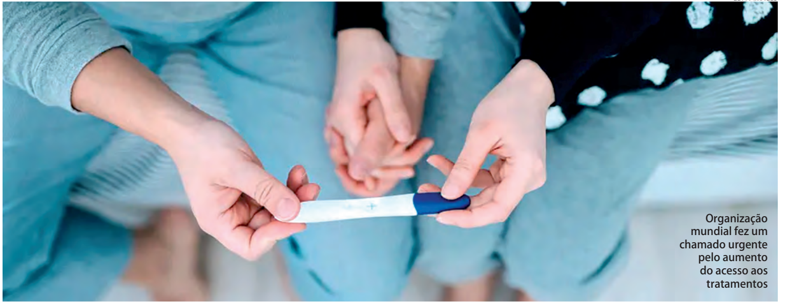
Organização mundial fez um chamado urgente pelo aumento do acesso aos tratamentos

Redação com assessoria redacao@diariodosudoeste.com.br