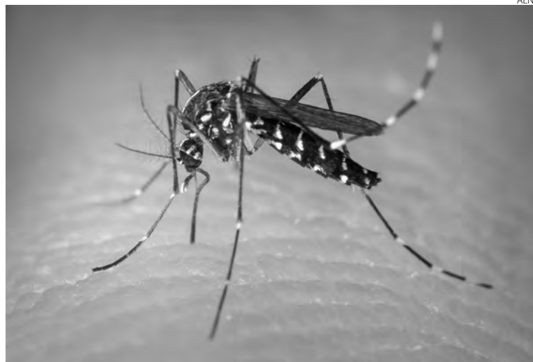
Oito casos de dengue foram confirmados em 2023

Aline Vezoli aline@diariodosudoeste.com.br