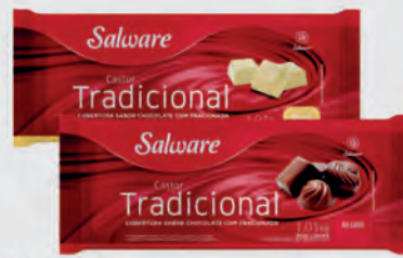
Chocolate Cobertura Castor ao Leite e Branca 1,01kg