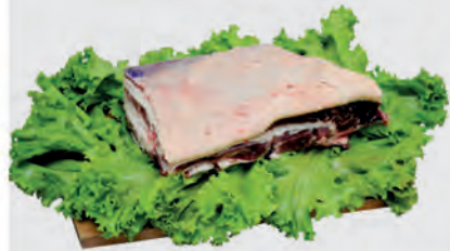
Costela Minga Bovina Kg