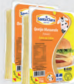
Queijo Mussarela Santa Clara Tradicional Fatiado 150g