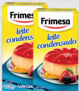
Leite Condensado Frimesa 395g