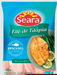
File Tilapia Seara 600g