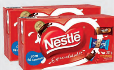
Bombom Nestlé Especialidades 251g