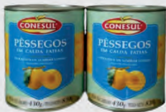
Pêssego em Calda Conesul Lata Fatias 430g