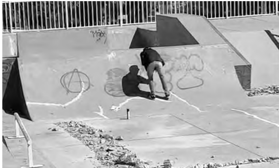
O rapaz revelou que outros jovens também teriam participado de pichações em prédios públicos

Após uma denúncia anônima, a Polícia Militar flagrou, na manhã de segunda-feira (3), um adolescente, de 17 anos, pichando a pista de skate, junto a ginásio Dolivir Lavarda, em Pato Branco. O menor foi detido.