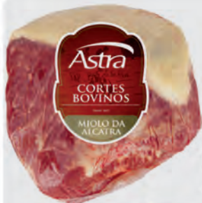
Miolo da Alcatra Bovina Astra Kg