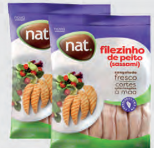
Filezinho Peito Frango Sassami Nat 1Kg