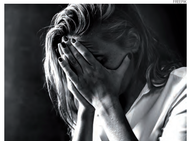
A depressão é a principal causa de incapacidade em todo o mundo

A Pesquisa Vigitel 2021, do Ministério da Saúde, um dos mais amplos levantamentos de saúde do país, mostra que a frequência do diagnóstico médico de depressão foi de 11,3%, sendo maior entre as mulheres (14,7%) do que entre os homens (7,3%). “Entre os homens, a frequência dessa condição tendeu a crescer com o aumento da escolaridade. Em ambos os sexos não foi observada re-