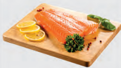
Filé de Salmão Fishoo Sul Kg