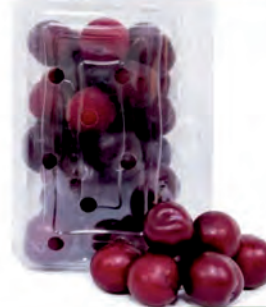
Ameixa Nacional Bandeja 600g