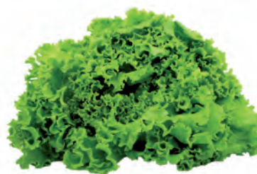
Alface Crespa do Preto Unidade