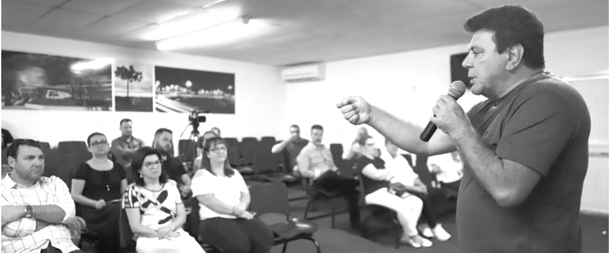
Anúncios foram feitos em três momentos distintos