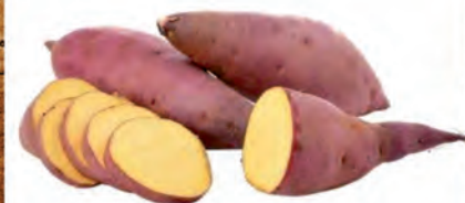
Batata Doce Roxa Kg