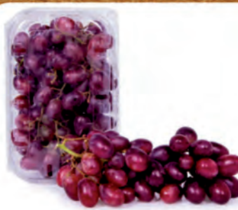
Uva Red Globe Bandeja 500g