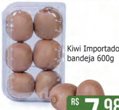
Kiwi Importado bandeja 600g