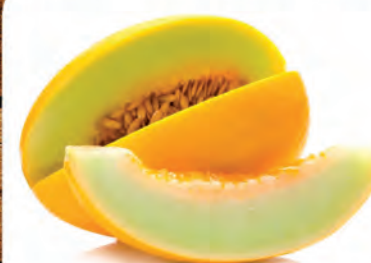
Melão Rei Kg