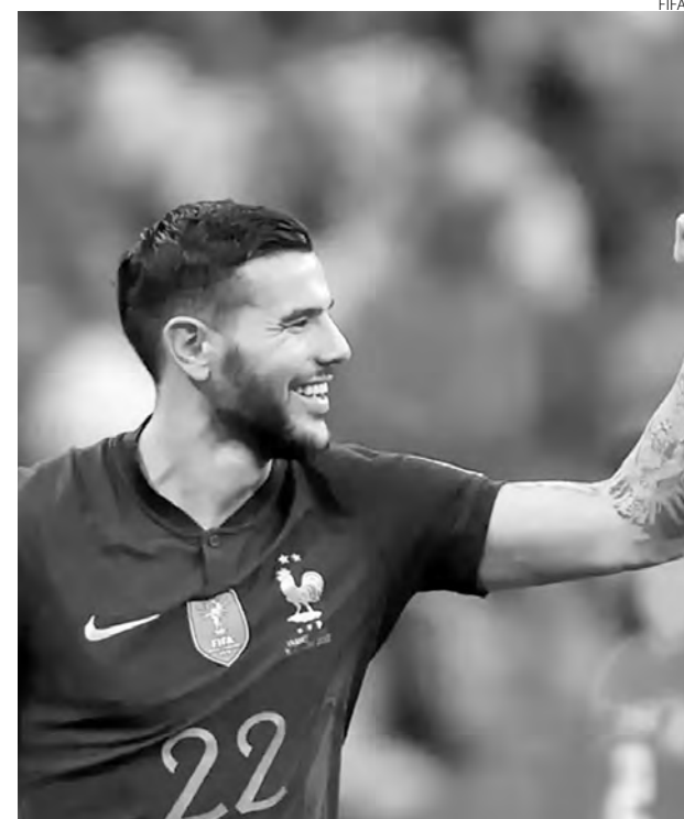
A França abriu o placar no início do jogo e ampliou a vantagem no segundo tempo

Marrocos, a primeira seleção africana da história a se posicionar entre as quatro melhores de um Mundial, ainda pode melhorar um pouquinho mais essa inesquecível campanha, já que enfrenta a Croácia, no sábado, na disputa pelo terceiro lugar.