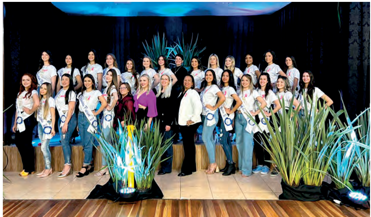
A escolha da Rainha dos Bairros voltou a ser feita após cinco anos