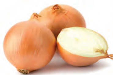
Cebola Nacional Kg