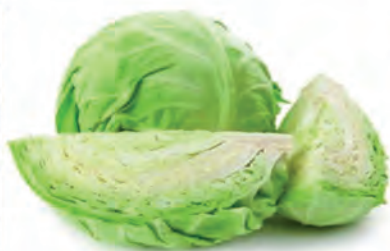
Repolho Verde Kg