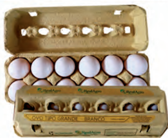
Ovos Brancos Real Agro Dúzia