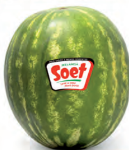
Melancia Soet s/ Sementes Kg