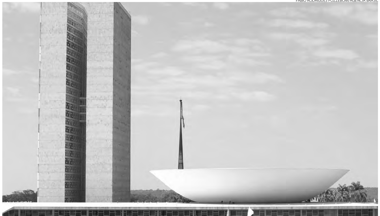
Negociação está sob comando do ministro da Fazenda

A importância da aprovação de uma reforma tributária e de um novo paradigma fiscal também foi destacada pelo presidente da Câmara Arthur Lira (PP-AL). "Não tenho dúvidas de que a simplificação do nosso sistema tributário terá efeitos positivos na arrecadação e na justiça social. O Brasil há muito clama por uma solução definitiva para esse desafio", destacou. Além da reforma tributária, o presidente do Congresso e do Senado, senador Rodrigo Pacheco (PSD-MG), acrescentou que a saúde pública,