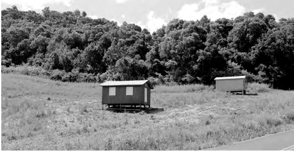
Algumas residências já foram alocadas na área do assentamento provisório

A mesma sentença estabeleceu que o Município de Vitorino deve garantir a "permanência dos indígenas na cidade, median-