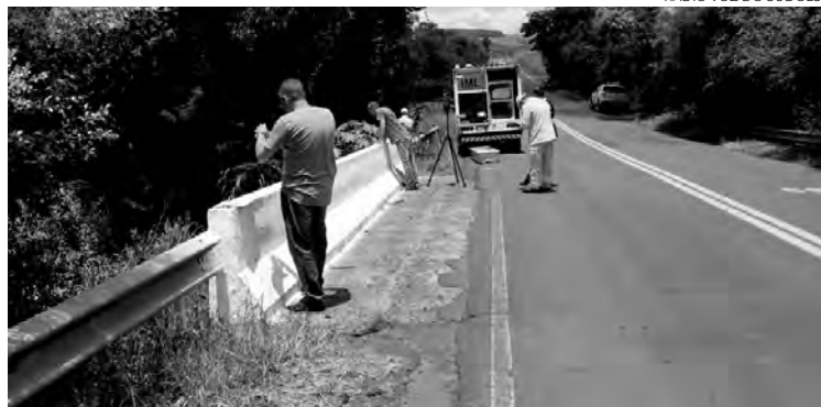
O rapaz foi encontrado morto no Rio Envolvido, em Coronel Vivida