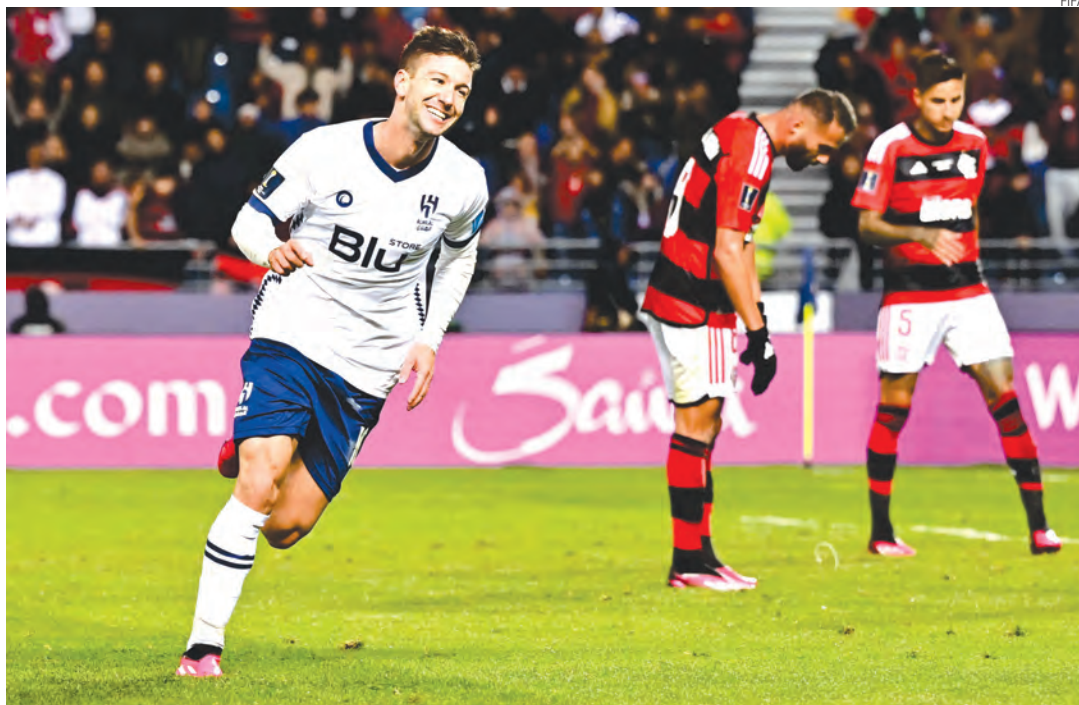
Os sauditas aproveitaram as falhas do Rubro-Negro e estão na final do Mundial de Clubes

O sonho do Flamengo de conquistar pela segunda vez na história o mundo chegou ao fim. Isto porque o Rubro-Negro foi derrotado por 3 a 2 pelo Al Hilal (Arábia Saudita), na tarde de terça-feira (7) no Estádio Ibn Batouta, em Tânger (Marrocos), pela semifinal do Mundial de Clubes da Fifa.