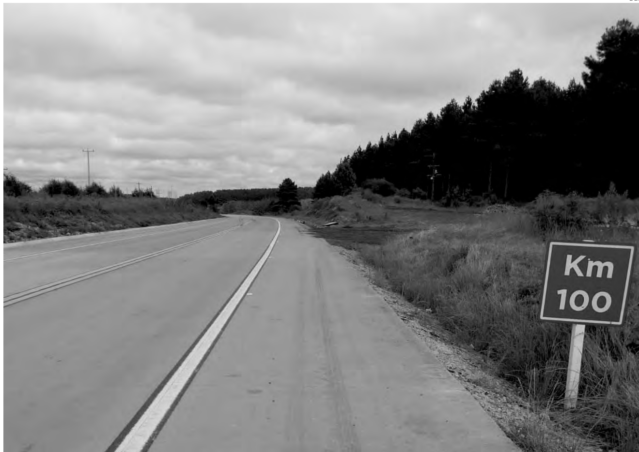
Segundo o governador Ratinho Junior, a meta é chegar com o asfalto de concreto até Pato Branco

Com investimentos de R$ 187 milhões, serão restaurados mais 40 quilômetros da PRC-280. Primeiro lote, que compreende o trecho de Palmas e Horizonte, está em fase de conclusão