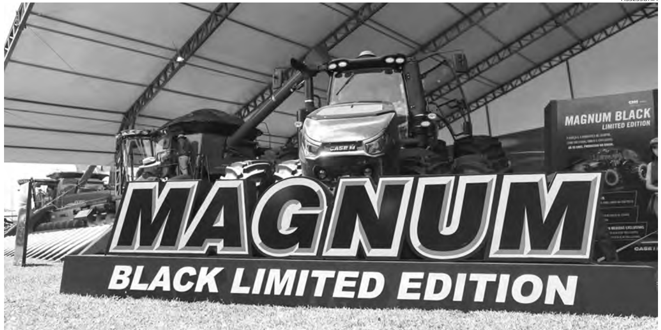
Em comemoração aos 20 anos de produção nacional da linha, nova série especial do trator recebe pintura diferenciada na cor preta, banco e volante revestidos em couro, além de outros diferenciais

"A cada ano surgem novas possibilidades atrativas de custos e benefícios dos produtos da CASE e da Case IH para o produtor rural. Esta feira, a primeira do ano para o agronegócio, é uma excelente oportunidade para os agricultores conhecerem a agilidade destes equipamentos, tirar dúvidas, conhecer a nova era digital, facilitar a sua vida e fechar os melhores negócios de forma rápida e segura, tudo