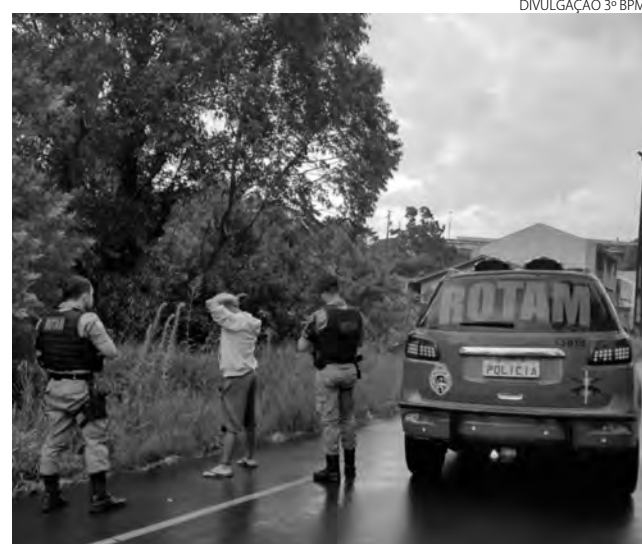
Operação será realizada de forma contínua todas as quartas e sextas-feiras