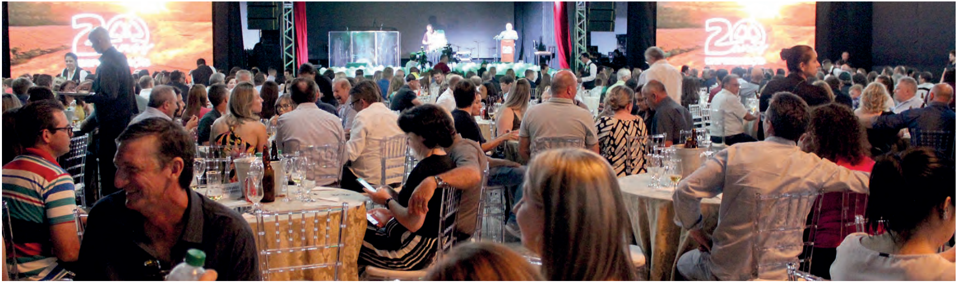
Comemoração dos 20 anos da Coopertradição reuniu parte dos cooperados, colaboradores e parceiros