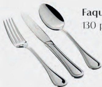
Faqueiro inox St James 130 peças