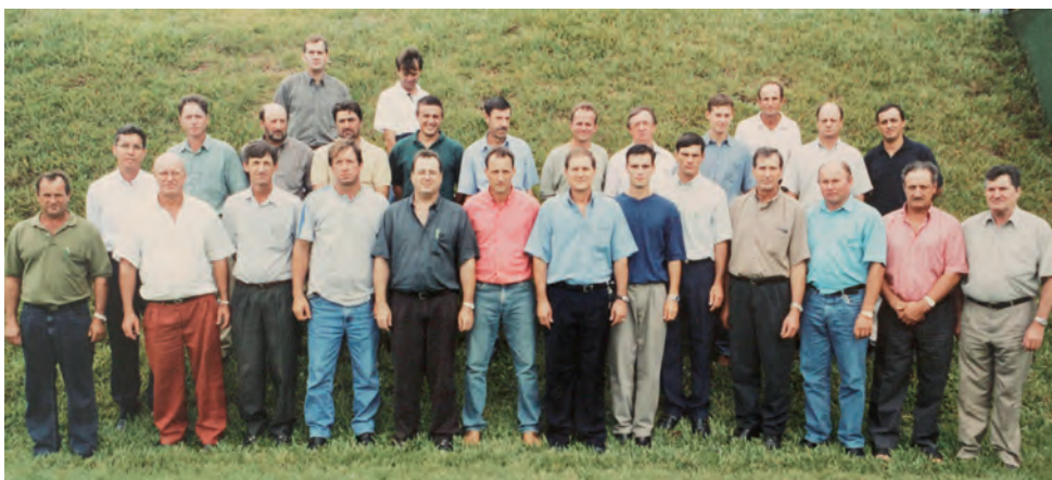
Fundadores da Coopertradição reunidos em janeiro de 2003