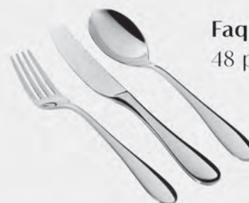
Faqueiro inox St James 48 peças