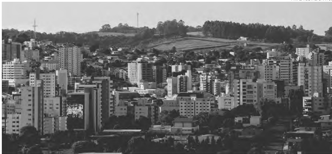
Município tem capacidade de arrecadar, somente através da dedução dos contribuintes, R$ 6,6 milhões aos fundos