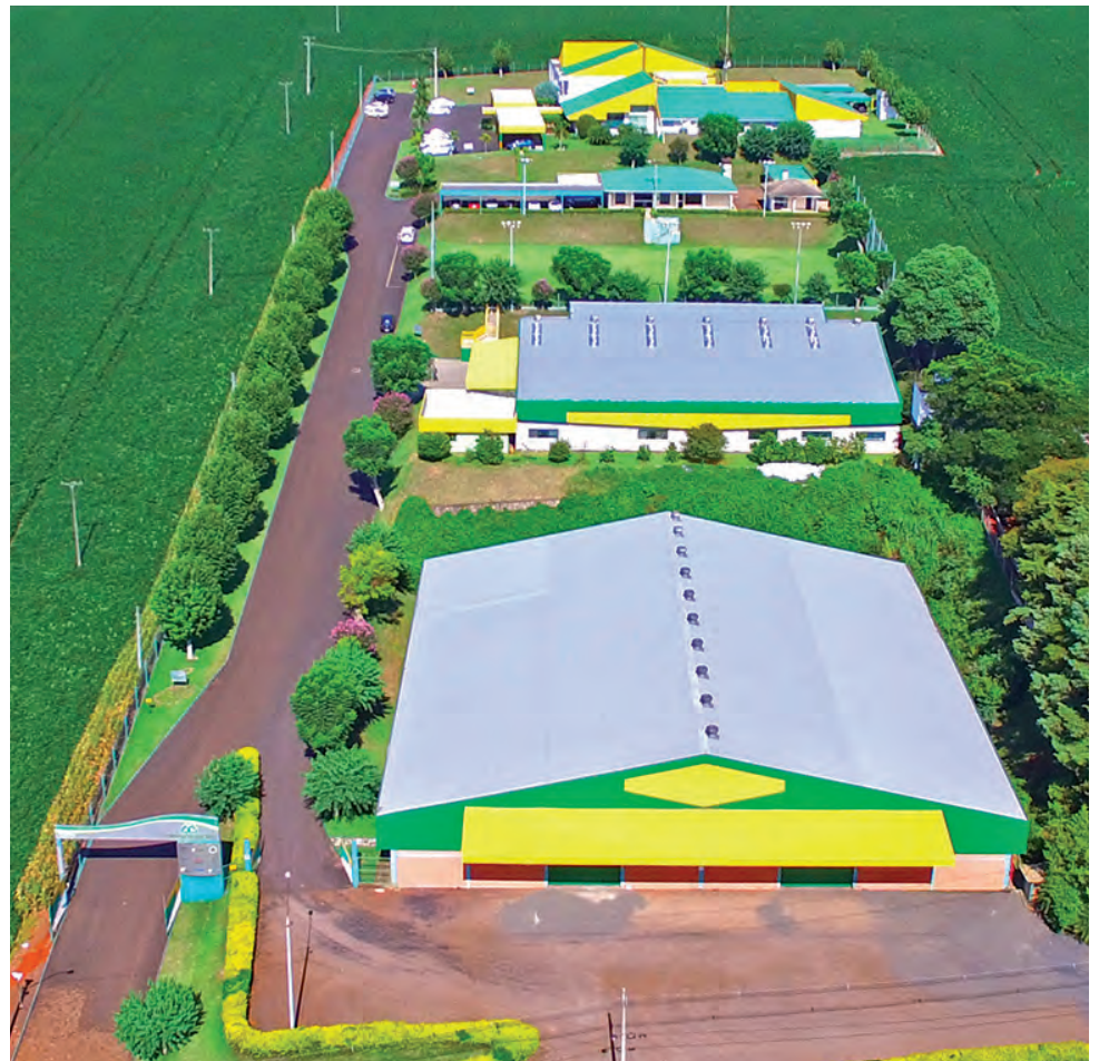
Matriz da Coopertradição em Pato Branco

Já a comemoração com colaboradores aconteceu em dezembro do ano passado, em uma festa de confraternização que reuniu todas as unidades da cooperativa.