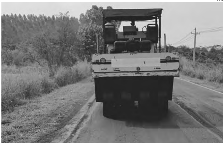
O prazo do contrato será de 365 dias após emissão de ordem de serviço

mento projetos que irão contemplar soluções mais modernas, embasadas por uma cuidadosa análise das condições do pavimento da malha estadual. Será uma nova modelagem para este tipo de contrato, com indicadores de desempenho e resultados mais eficazes e duradouros.