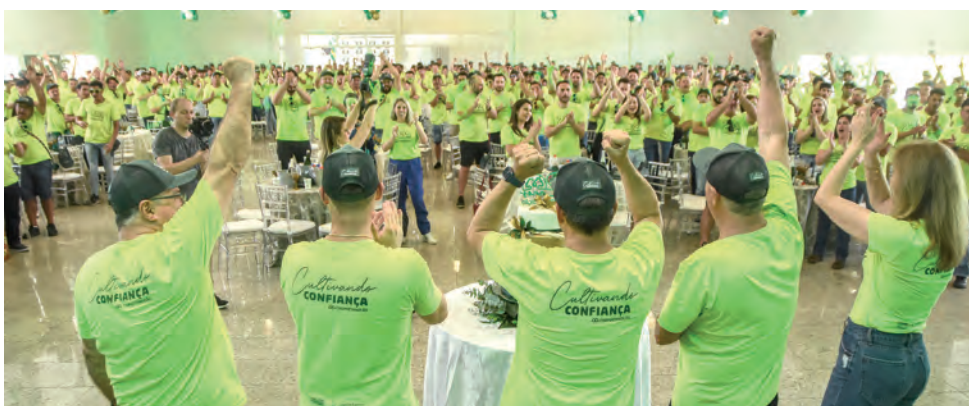
Festa de confraternização, alusiva aos 20 anos, com cerca de 700 colaboradores e parceiros da Coopertradição