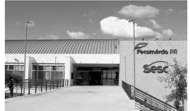
A unidade de Pato Branco do Sesc também estará com atividades especiais