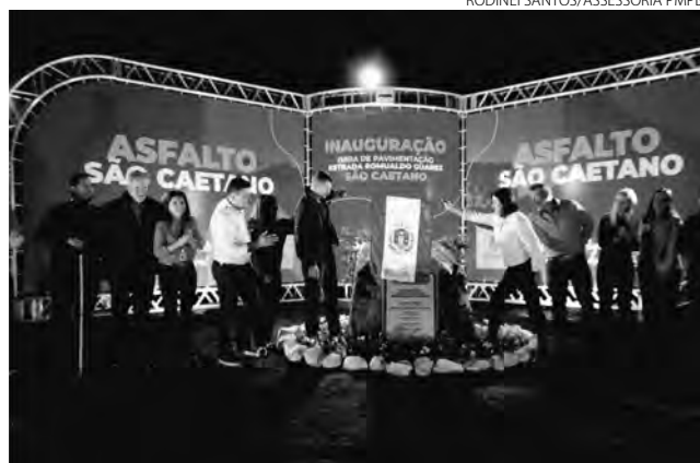
A obra de 5,7 quilômetros, teve investimento total de R$ 4.718.083,10