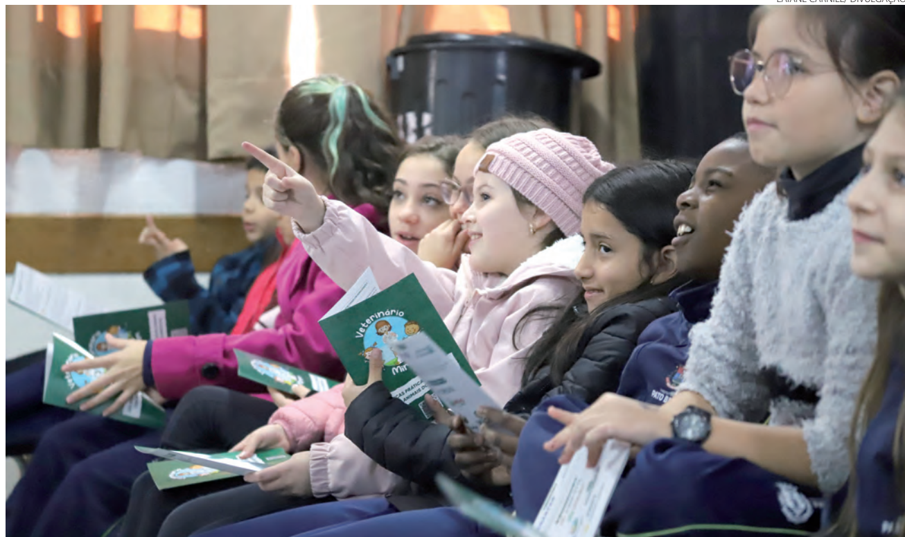
Em torno de 280 alunos participaram do evento