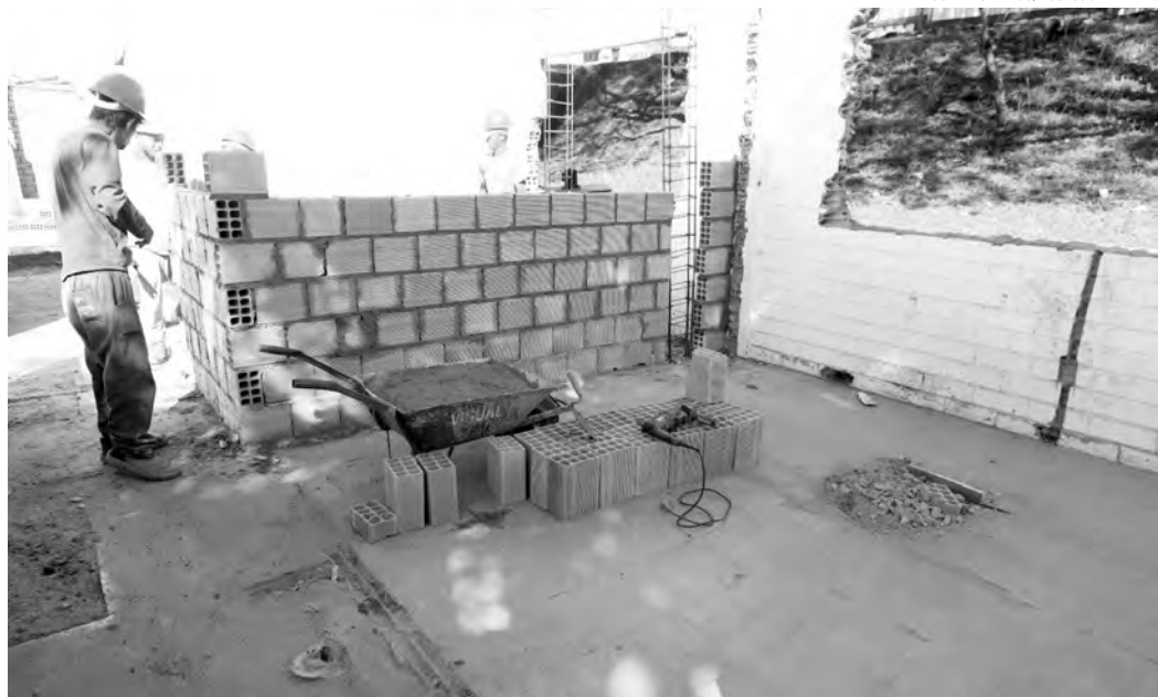
Centro está sendo edificado no bairro São Cristóvão

Redação com assessoria redacao@diariodosudoeste.com.br