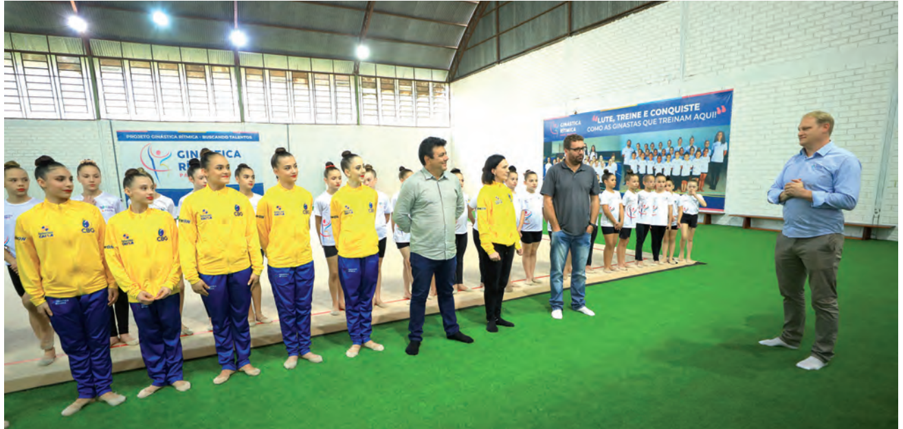
Apresentação aconteceu na tarde de terça-feira (17)