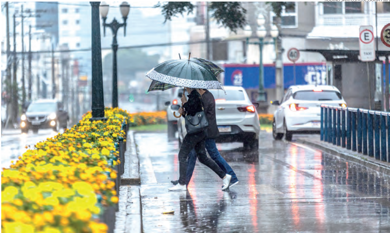
A semana iniciou chuvosa em Patro Branco e no Sudoeste