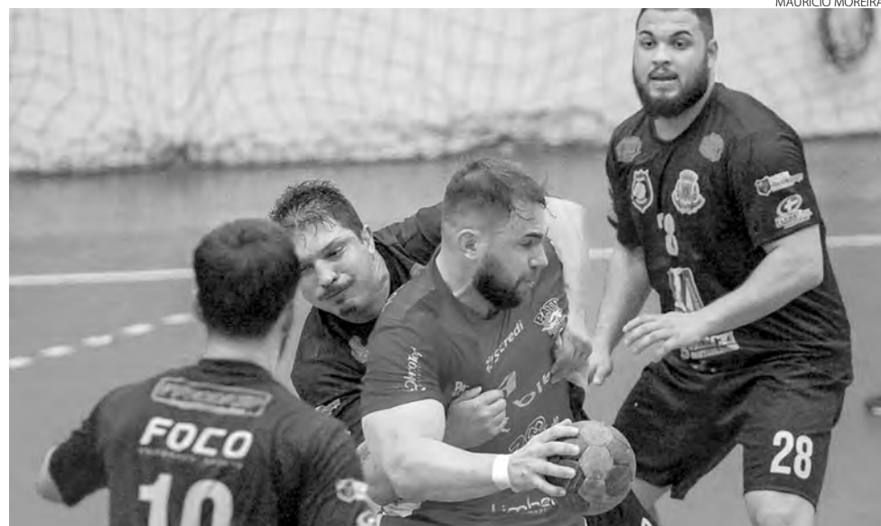
A equipe masculina do Pato Handebol venceu os dois jogos

O Campeonato Paranaense de Handebol da Chave Ouro conta com dez equipes no masculino e nove no feminino. A próxima etapa será disputada no mês de maio, em Assis Chateaubriand. (AB)