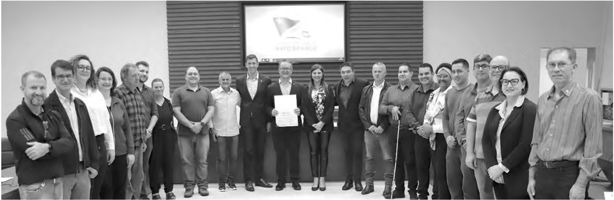
Moção de Aplauso foi entregue na sessão da Câmara dessa segunda-feira

Marcilei Rossi com assessoria marcilei@diariodosudoeste.com.br