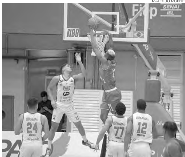
O Pato Basquete quer vencer o jogo em casa para depois tentar a classificação em São Paulo

Com relação ao jogo desta terça-feira, Jece Leite disse que a expectativa é muito boa com a equipe vindo em crescente, não somente pelos resultados positivos, mas depois da classificação. "Vamos enfrentar um adversário que a gente