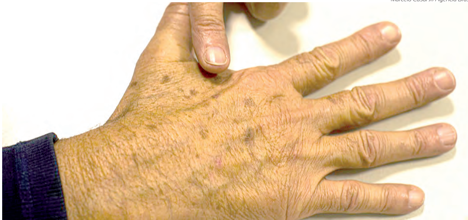
Dezembro Laranja chama a atenção para os cuidados com a pele