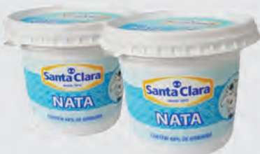
Nata Santa Clara 300g