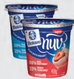
Crema Batavo Quark Nuv 450g