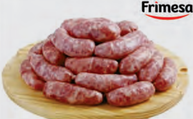
Linguíça Toscana Frimesa Kg