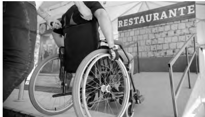
Ações voltadas para pessoas com deficiência acontecem no sábado