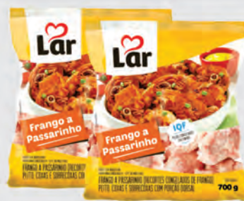
Frango a Passarinho Lar 70g