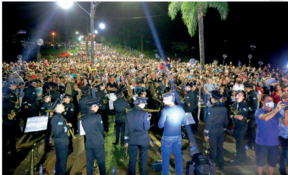
Abertura de Natal de 2021 reuniu 6 mil pessoas em Coronel Vivida

"Queremos que a nossa árvore seja um cartão-postal não só para nós vividenses, mas para todo o Sudoeste do Paraná, hoje até em nível de Sul, uma imagem que traga a luz, a paz, o amor. E tocar o coração das pessoas com essa imagem da árvore", aponta o diretor.