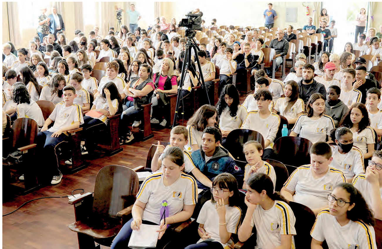
Alunos do Colégio Estadual Augustinho Zucchi assistiram à Abertura Solene do Fórum