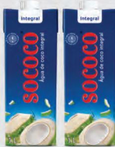
Água de Coco Sococo 1L