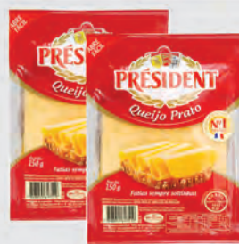
Queijo Prato Président Fatiado 150g