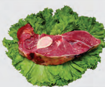
Paleta c/ Osso Bovina Kg