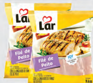
Filé de Peito Frango Lar 1Kg