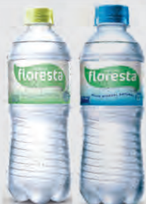
Água Mineral Floresta 500ml c/ e s/ Gás