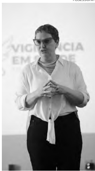
Reunião aconteceu na manhã desta quinta-feira (1º)

Sintomas graves: Dificuldade para respirar ou falta de ar, perda da fala, mobilidade ou confusão, dores no peito.