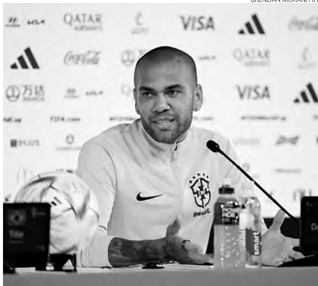
Daniel Alves vai se tornar o jogador mais experiente a vestir a amarelinha em Mundial

Convocado pela primeira vez em 2006, Daniel Alves disputará o seu 126º jogo como atleta da Seleção Brasileira. Presente em três Mundiais, um a menos que o recordista Thiago Silva, o defensor relembrou a sua trajetória pelo Brasil e de tudo que o credenciou a ser chamado para a Copa do Mundo Fifa Qatar 2022. "A vida me ensinou que quando você coloca sua mente no que você quer, coloca dedicação, trabalho, a vida te leva a lugares inimagináveis. Fazer parte dessa trip, dessa viagem, eu tenho certeza que vai ser única. São 16 anos colocando o meu melhor serviço à seleção. A vida premia quem ama o que faz, as pessoas que se entregam de corpo e alma. A minha missão na Seleção Brasileira sempre foi essa e