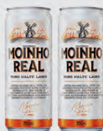
Cerveja Moinho Real Puro Malte 350ml