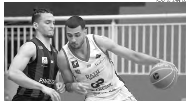
O Pato Basquete teve excelente aproveitamento na vitória sobre o Pinheiros

O time pato-branquense já disputou dez jogos nesta temporada do NBB e obteve duas vitórias, estando em 15º lugar. Com isso, precisa vencer a maioria dos jogos restantes para se classificar aos playoffs do NBB. O próximo jogo será terça-feira, fora de casa, às 20h, contra o Caxias. (AB)