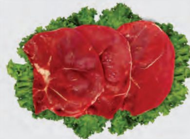
Bife Patinho Bovino Kg