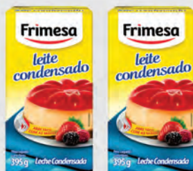
Leite Condensado Frimesa 395g