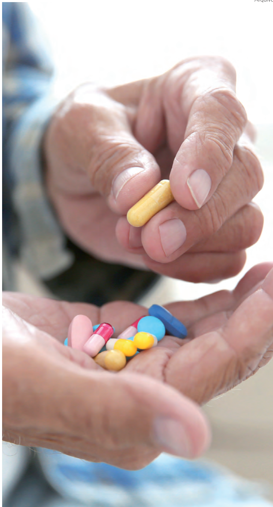
O sintoma mais comum do uso de anti-inflamatórios não esteroidais é a dor ou desconforto no estômago

Outro ponto importante é a prevenção! Mantenha-se em forma, com a musculatura forte, boa mobilidade, evite o excesso de peso sobre suas articulações, tudo isso vai auxiliar na redução das lesões e, conseqüentemente, necessidade de anti-inflamatórios!