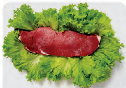
Coxão Mole Bovino p/ Churrasco Kg