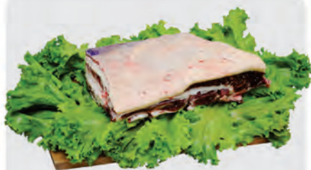
Costela Minga Bovina Kg