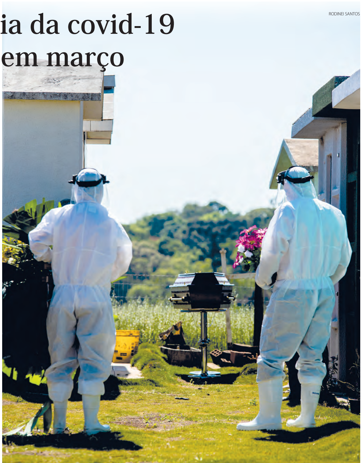
Manejo e enterro das vítimas da covid-19 eram realizados com cautela para evitar o contágio

Os leitos de Unidade de Terapia Intensiva (UTI) alocados na Unidade de Pronto Atendimento