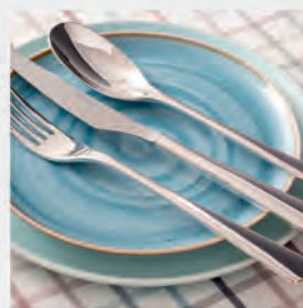
Faqueiro inox St James 101 peças