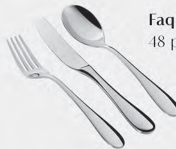
Faqueiro inox St James 48 peças