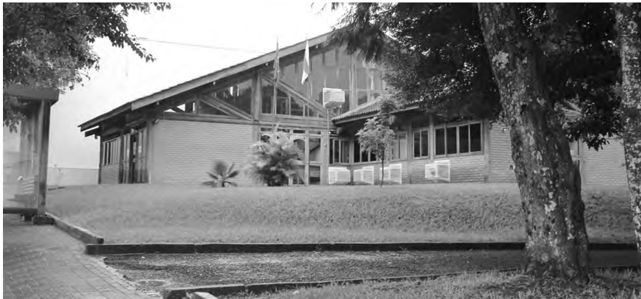
Entre os condenados pela Justiça, dois ex-servidores do IAT

Marcilei Rossi e assessoria marcilei@diariodosudoeste.com.br