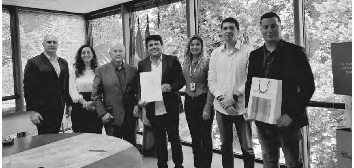
BRDE e Prefeitura assinam acordo de cooperação técnica para apoio a projetos e programas voltados à tecnologia