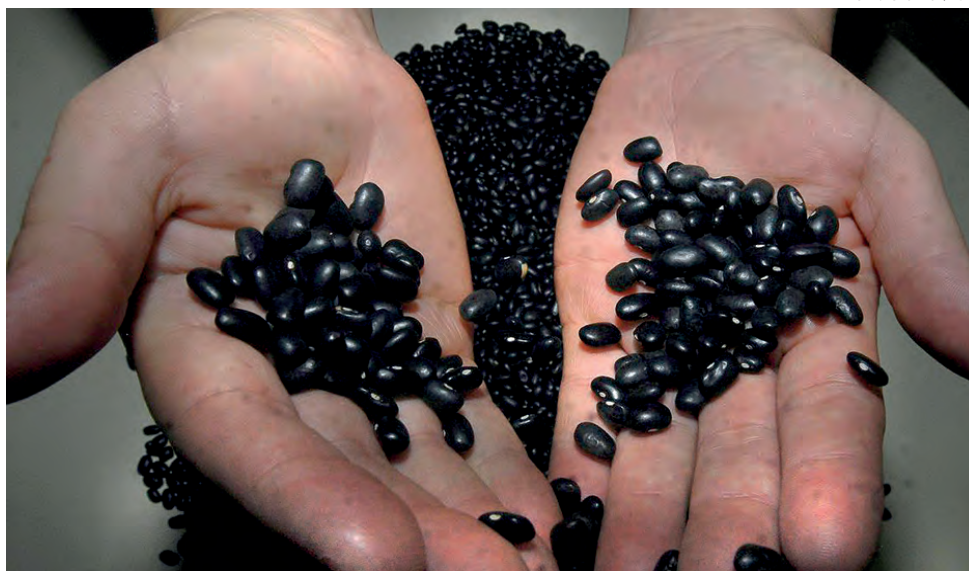
Produto é importante para dieta equilibrada, diz pesquisadora

A pesquisa apontou uma redução no consumo do feijão. A previsão é que em 2025 o brasileiro deixe de comer o alimento de