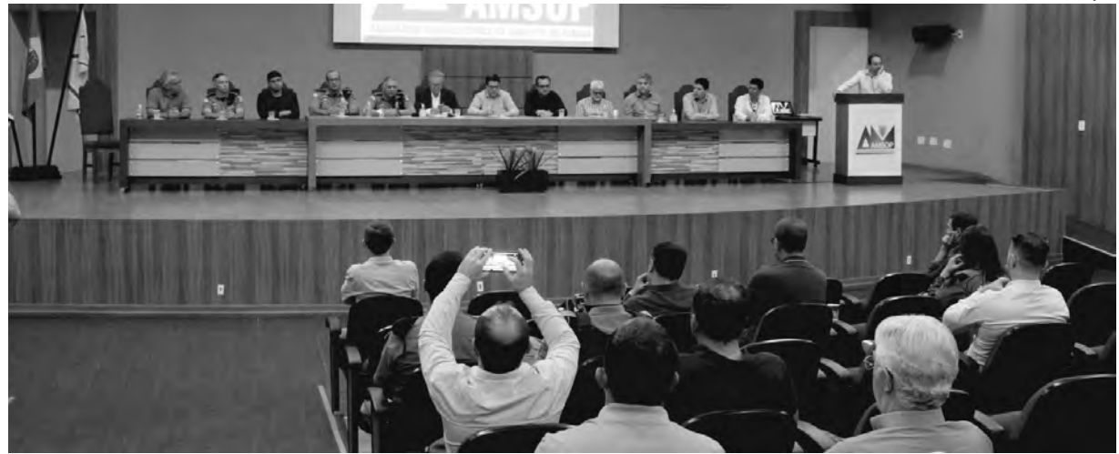
Reunião teve como finalidade solicitar aumento do efetivo da Polícia Militar na região

O presidente da Amsop destaca que o objetivo é buscar junto ao governo a sensibilidade referente a inserção de policiais na região, "pois