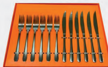
Faqueiro inox para churrasco 12 peças