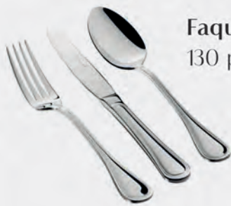
Faqueiro inox St James 130 peças