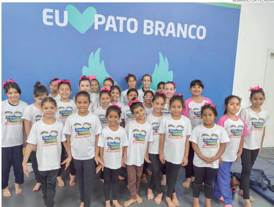
As meninas do Remanso da Pedreira participaram da Mostra de Ginástica Rítmica realizada no Centro Municipal Osiris José Guerios, localizado no bairro Anchieta, em Pato Branco. O projeto de GR vem sendo realizado no município através da parceria entre o Instituto Theóphilo Petrycoski e a Prefeitura.