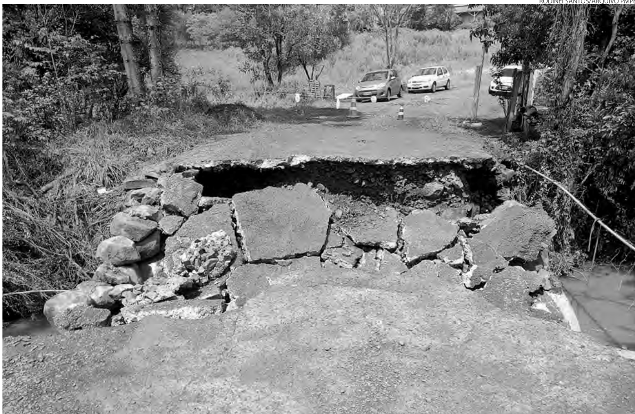
Das 12 pontes danificadas que foram identificadas na semana passada, seis estão na lista de recuperação

Estima-se que existam no município 300 bueiros na área rural, e até o momento, 50 foram desobstruídos. Assim a secretária afirma que o Município está estudando para contratar uma empresa para auxiliar neste serviço.