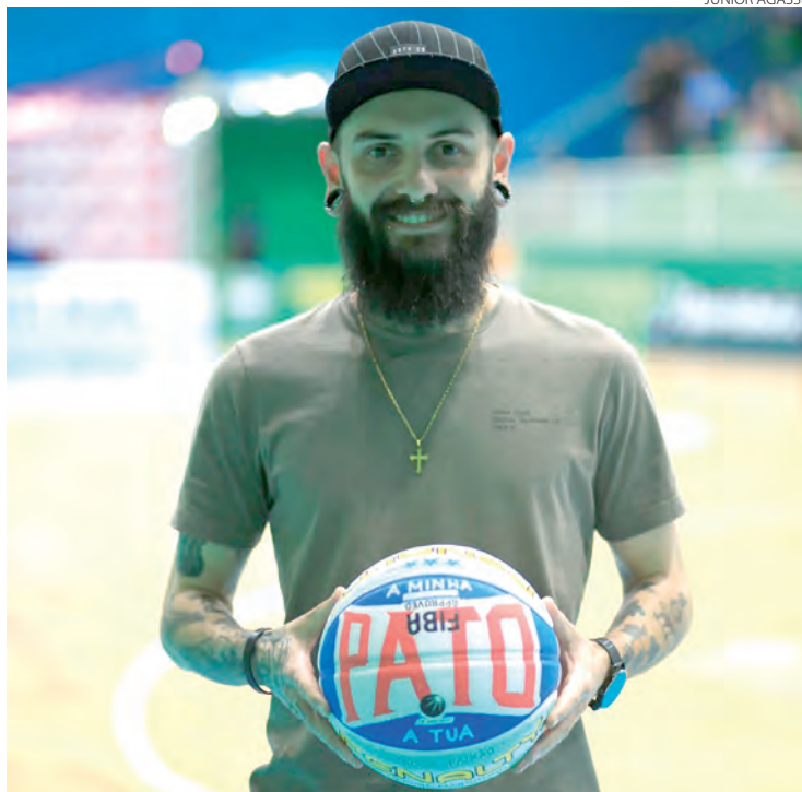
João Paulo Rohweder ilustrou a bola do Pato Basquete para o concurso do NBB e Penalty