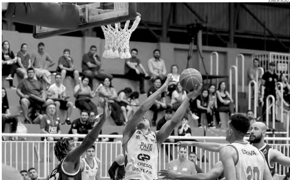
Após perder para o São José, o Pato Basquete tenta a reabilitação diante do Flamengo