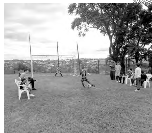
Além das disputas, haverá uma recreação especial para as crianças

Na chave A masculino, está na liderança o time da Alianza, com 35 pontos, três a mais do Medellín. O Consórcio Magalú é o terceiro colocado, com 24 pontos. Na chave B, o LZ e o Corinthians estão com 34 pontos cada, mas o LZ fica na liderança pelos critérios de desempate. O Tabajara segue em terceiro lugar, com 24 pontos. (AB)