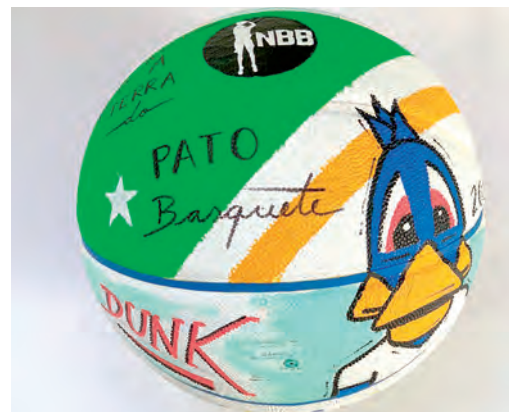
Detalhe da ilustração feita pelo artista