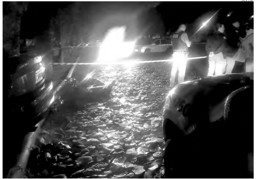
O homem foi morto quando chegou no pátio da empresa para trabalhar

O acusado do homicídio não teve o nome divulgado. Ele foi encaminhado à Delegacia da Polícia Civil de Francisco Beltrão para as devidas providências.