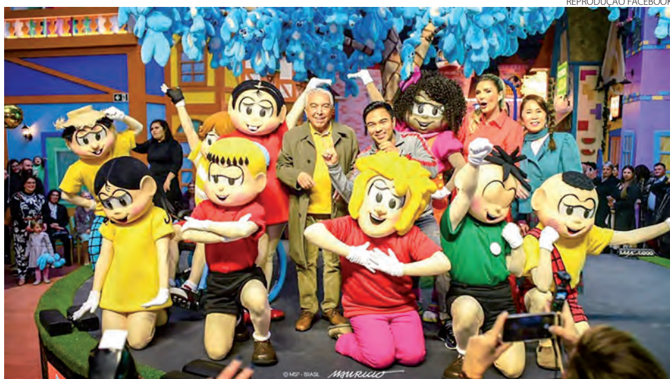
Maurício de Sousa na inauguração da Vila da Mônica em Gramado (RS)