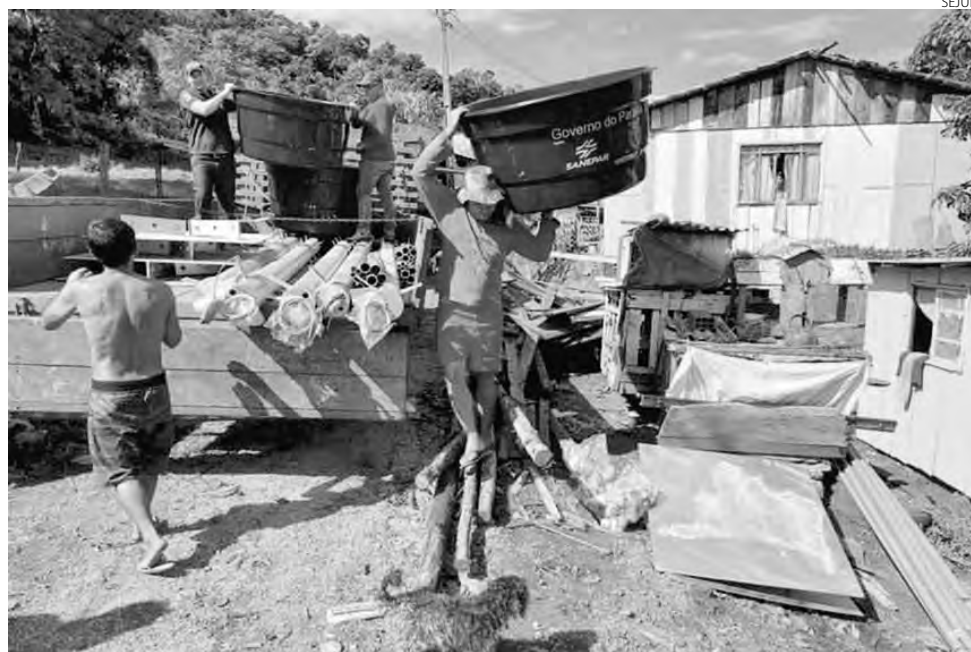
Além de equipamentos e kits de instalação fornecidos pela Sanepar, as famílias recebem R$ 1 mil

"É inigualável a diferença que faz uma caixa d'água na vida das famílias, principalmente nas que vivem nos locais mais distantes das grandes cidades. Esse projeto promove emancipação aos paranaenses mais vulneráveis", afirma o secretário