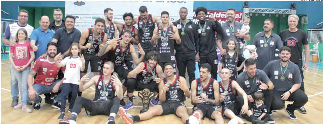
A equipe do Pato Basquete conquistou o título de forma invicta