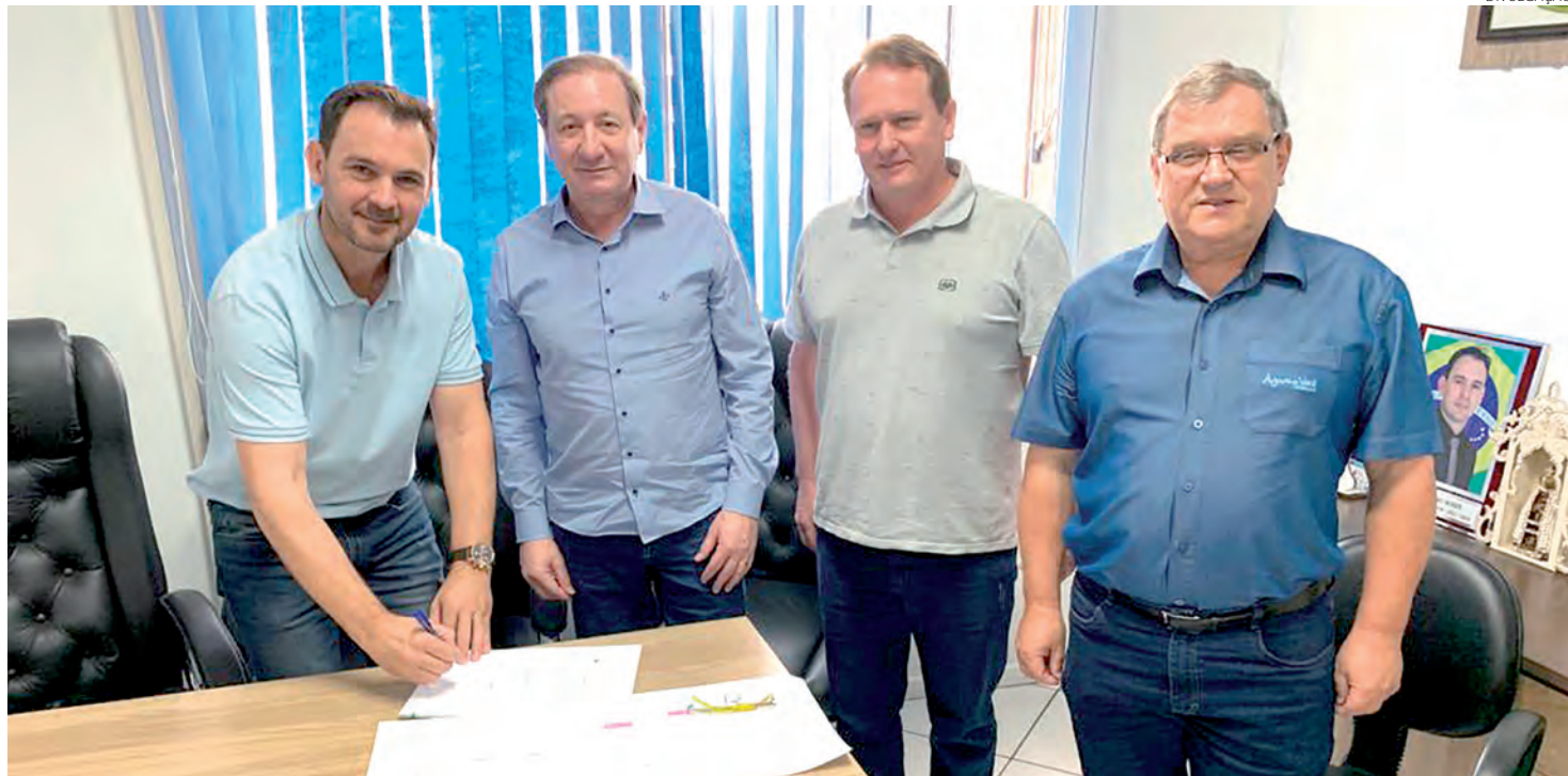
Orçamento previsto é de pouco mais de R$ 2 milhões