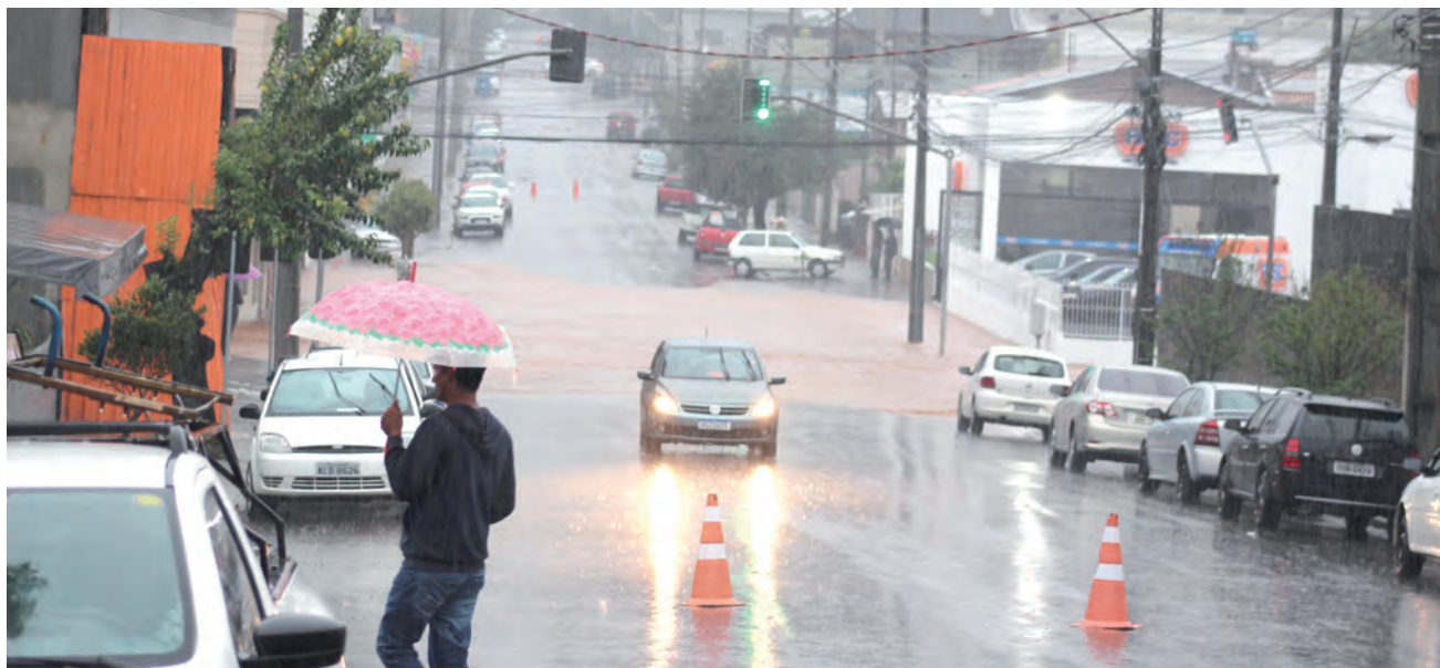
Serviço está disponível desde sábado e é gratuito

Os avisos serão gerenciados por órgãos estaduais e municipais por meio da plataforma Idap, que é mantida pelo órgão nacional desde 2017. Por enquanto, todos os estados estão cadastrados, mas apenas 148 dos 5,5 mil municípios integram a plataforma. O MDR considera fundamental que também os municípios se cadastrem para que possam fazer a comunicação de forma mais direta com os mo-