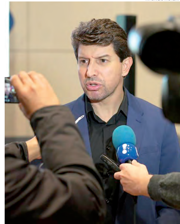
O técnico Tcheco deverá iniciar a pré-temporada do Azuriz no próximo dia 28