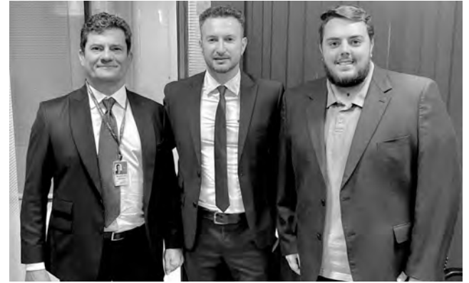
Numa das agendas, no gabinete do deputado federal reeleito, Felipe Francischini, prefeito de Vitorino conversou com o senador eleito, Sergio Moro. Todos integram o União Brasil

Além disso tudo, o Executivo dedicou atenção em visitas e tratativas com o objetivo de viabilizar recursos para o município em 2023.