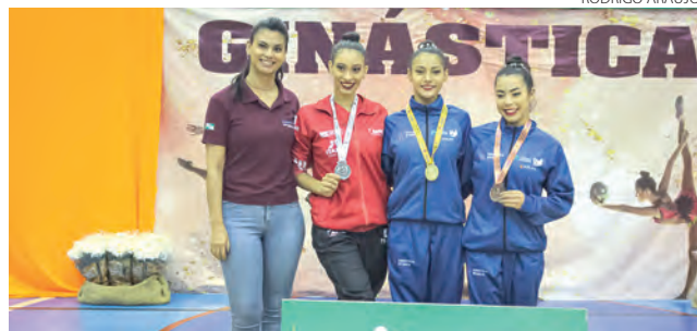
As ginastas de Pato Branco dominaram o pódio na fase final dos JAPs

Morando no Brasil há um pouco mais de um ano, a atleta se diz feliz e motivada por representar a cidade de Pato Branco. "Eu vim para o Brasil para poder treinar e me aperfeiçoar mais na ginástica, para ter uma melhor treinadora e um melhor rendimento. Hoje moro em Pato Branco e estou muito feliz em poder representar a cidade nos Jogos Abertos. Nos preparamos bastante, estamos vindo de disputas no Paranaense, no Brasileiro e treinamos todos os dias para conseguirmos esse ótimo resultado nessa competição, que inclusive tinha as melhores ginastas do Para-