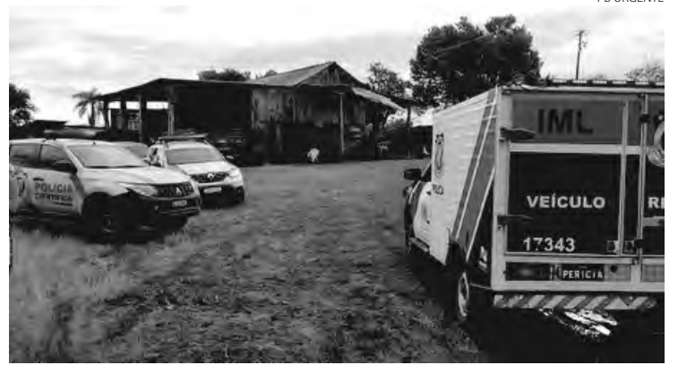
O homicídio ocorreu na comunidade de Santa Lúcia, em Coronel Vivida